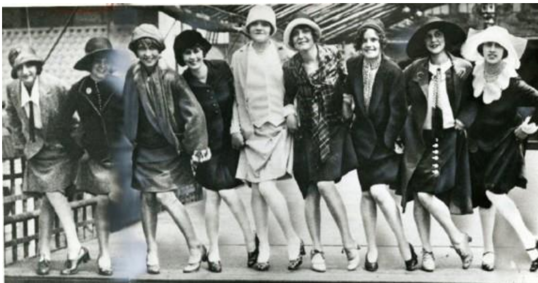
Slika 3. Flapper djevojke iz 1920-ih godina