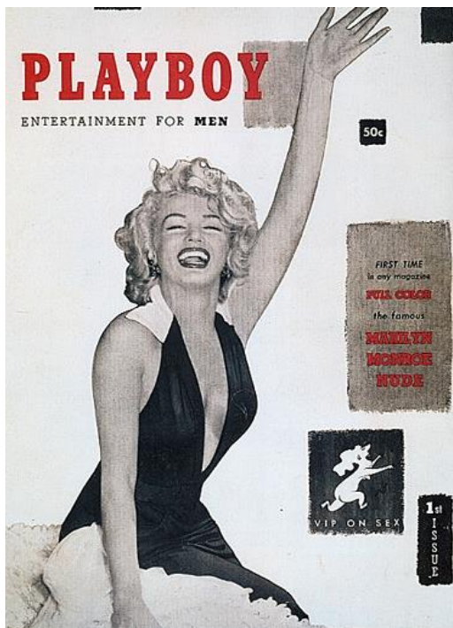
slika 8-Marilyn Monroe na naslovnici Playboya 1953.

Govoreći o konzumaciji žena i njihova tijela, važno je spomenuti samu pornografiju. Naravno, u pornografiji se ne nalaze isključivo ženska tijela, no ona su ta koja su vrlo problematična u cijeloj priči budući da utječu na stvaranje nerealne predožbe o ženama i njihovu izgledu. Do sredine 1960-ih pornografija je bila usmjerena na muškarce, tek se oko 1970-te počinje širiti i na žensku publiku te polako ulazi u žensku kulturnu sferu 13 (Wolf, 2008:158). Ukoliko govorimo o počecima porno-kulture, Playboy je bio najpoznatiji časopis koji se bazirao isključivo na ženama i njihovom nagom tijelu, a počeo se izdavati 1953. godine te je njegovu prvu naslovnicu krasila seks bomba Marilyn Monroe. Budući da je počeo izlaziti u vrijeme vrlo konzervativne struje u Americi kada je bila zastupljena figura žene kao kućanice, imao je vrlo utjecaj na popularnu kulturu budući da je tada golotinja još uvijek bila tabu tema (Gilmour, 2017.).