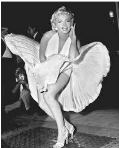
Slika 5. Marilyn Monroe