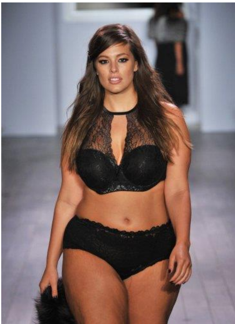
Slika 12. Plus size model Ashley Graham

Možemo se ponovo nadovezati na Naomi Wolf koja tvrdi kako je „ženska debljina tema žestoke javne rasprave i žene osjećaju krivnju zbog masnog tkiva“ te kako „ženska tijela ne pripadaju nama, nego društu, da mršavost nije privatna estetika i da je glad društvena koncesija koju provodi zajednica“ (Wolf, 2008:220). Također, Wolf navodi istraživanja provedena 1990.godine koja pokazuju kako višak kilograma više utječe negativno na zdravlje muškarca nego žene, te kako ženska debljina možda čak i nije toliko nezdrava, do neke granice naravno (Wolf, 2008:220). Kakvi god bili nametnuti standardi ljepote, proporcija i veličina, uvijek će postojati žene koje se ne uklapaju u njih. To i jest cilj potrošačke kulture, činiti žene nezadovoljnima vlastitim tijelom kako bi što više kupovale proizvode koji će ih učiniti mršavijima, ili im pak povećati obline. Zabrinute debljinom ili mršavošću postajemo toliko usredotočene na vlastito tijelo i na mogućnosti kojima možemo intervenirati i popraviti