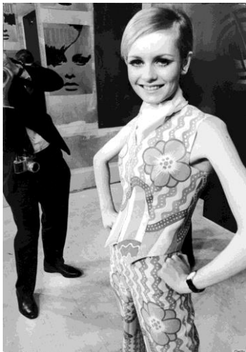
Slika 6. Twiggy

nikako nije zadovoljavao karakteristike plodnosti i reprodukcije, dok su muškarci u njoj iščitavali aseksualnost i slabost. Također, Wolf navodi citat iz Voguea iz 1965., kada su ju prvi put predstavili te i sami bili šokirani njenim izgledom: „Twiggy se naziva Twiggy jer izgleda kao da će je snažan povjetarac prelomiti napola i otpuhati ju na tlo.. njezine noge izgledaju kao da nije pila dovoljno mlijeka kao novorođenče, a njezino lice ima izraz koji su Londonci vjerojatno imali tijekom blitz krieg a“ (Wolf, 2008:217). Autorica Susan Bordo govori upravo o tome - tiraniji vitkosti. Smatra kako ono što šezdesetih i sedamdesetih bilo smatrano vitkim i „fit“, više nikako nije, već nam se čini obješeno i nezategnuto (Bordo, 1993:187). Također, Bordo smatra kako je trend mršavosti ojačao upravo zbog toga što su androgin izgled i mršavost označavali nešto sasvim suprotno od ženskosti i reproduktivne moći – mršavost je bio način ulaska u dominantan muški svijet kako bi žena uspjela u njemu. Šezdesete i sedamdesete godine su upravo to i predstavljale: donijele su promjene velikih razmjera u poimanju muškog i ženskog izgleda, rušile su se granice i „brisale“ određene norme koje su karakterizirale muški i ženski izgled; žene su sve češće bile u hlačama te se čak počela proizvoditi jednaka odjeća za žene i muškarce ( unisex ) (Vanderbilt Academy, 2017.).