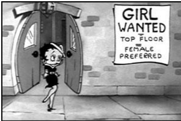
Slika 4. Jedan od ranijih prikaza Betty Boop (1920te)

razvijala sukladno s trendovima i razdobljima koji su uslijedili, a u zadnjih dvadesetak godina najviše se pojavljuje u reklamnoj industriji.