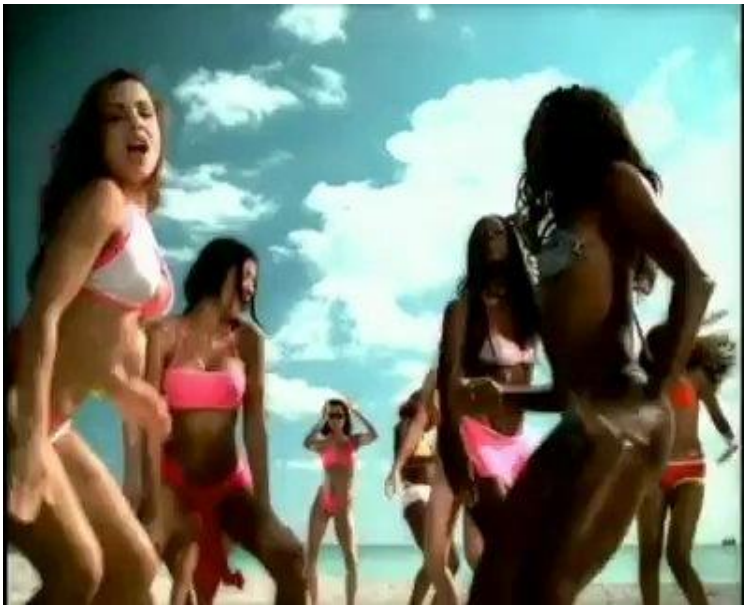
Slika 10. Isječak iz videospota „Thongs“ glazbenika Sisqoa

te otkriva stražnjicu. Postoji mnogo vrsta tangi, sa širim i užim stražnjim dijelom, G-string tanga (sa širim stražnjim dijelom) ili T-bone tanga (vrlo tanka špagica kao stražnji dio). Zanimljivo je to što su se tange kao odjevni predmet pojavila prije više od 75 tisuća godina, a nosili su ih muški pripadnici određenih plemena kojima je tanga predstavljala dio tradicionalne odjeće (pleme Khoisian iz južne Afrike, Fundoshi iz Japana). Moderne tange su se isprva počele koristiti kao kupaći kostim kada je Rudi Gernreich po prvi puta sredinom 60-ih godina predstavio javnosti monokini , kupaći kostim koji se sastojao samo od donjeg dijela (tangi), a grudi su bile nepokrivene ( topless ), dok su G-string tange postale aktualne već 30-ih godina te bile sastavni dio kostimografije žena koje su nastupale u burleskama 15 i sličnim predstavama (Perez, 2015.).