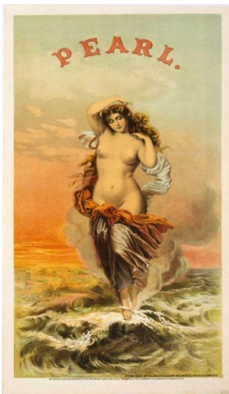
Slika 1. Prikaz žene na reklami duhanskog proizvoda Pearl iz 1871.