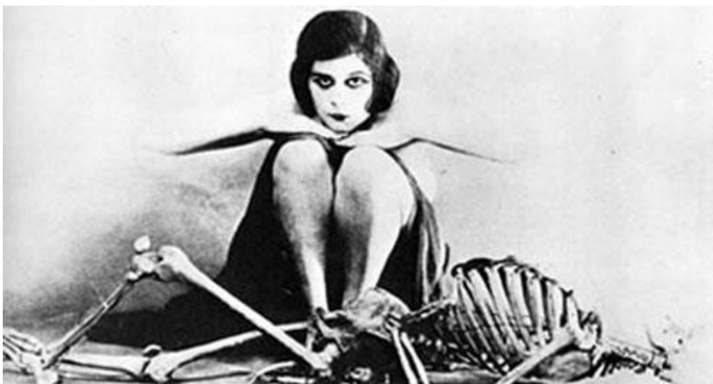
Slika 2. Theda Bara u „Fool there was“