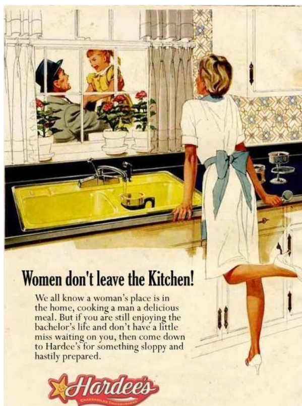
slika 7. Reklama za američki lanac restorana

Žensko tijelo bilo je podložno manipuliranju u reklamnom diskursu gotovo od samog početka potrošačke kulture. Jennifer Holt u svom tekstu „Idealna žena“ govori o ženama pedesetih godina, odnosno, na koji se način plasirao stereotip o „idealnoj“ ženi pedesetih godina. Kao što je i ranije spomenuto, nakon Drugog svjetskog rata obitelj se premješta u predgrađe te svatko u obitelji ima svoju ulogu budući da su se tradicionalne obiteljski vrijednosti ponovo vratile u američko društvo. Mediji ovdje igraju ključnu ulogu prezentirajući uniformiranu sliku žene kao domaćice, kao one koja brine o kući i svojoj obitelji te na osnovu toga i konstruira svoju pojavu i identitet – taj koncept kućanice kao „idealne“ žene u pedesetima imao je veliki utjecaj i na kasniju percepciju „idealne“ žene. Holt se posebno usmjerila na kritičku analizu ženskih časopisa koji su se i isticali u promoviranju slike žene kao kućanice. Ovdje spominje autoricu Betty Friedan i njeno djelo „The Feminine Mystique“ koja je prva primjetila i pisala o tome kako se stvaraju stereotipi o ženama te kako se „ženska mistika označava to da žena zadovoljstvo može naći samo u seksualnoj pasivnosti, muškoj dominaciji i majčinstvu, a brani ženi karijeru ili bilo kakvu aktivnost van kuće, tjerajući ju na jednu jedinu ulogu – žene kao kućanice“ (Holt, 2006). Poželjna slika idealne žene, odnosno stereotip, ili žene kao seks bombe koristila se na razne načine i oblikovala po želji tržišta.