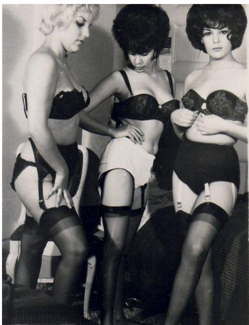
slika 9. Žene u donjem rublju početkom 1960-ih

Jedna od najpoznatijih modnih kuća za donje rublje jest „Victoria's Secret“ nastala sedamdesetih godina prošloga stoljeća, a otvorili su ju Roy i Gaye Raymond. Roy je izjavio kako je bio vrlo razočaran pri svakoj kupnji donjeg rublja za svoju ženu zato što je uvijek izgledalo ružno, s cvjetnim uzorkom i neprivlačno. Htio je otvoriti dućan koji će ženama nuditi različite vrste i uzorke donjeg rublja koji će biti lijepi ženama, ali i muškarcima (Duan, 2015.). Naravno, i izum grudnjaka 1917.godine 14 potpuno je zadobio tržište te se kroz godine toliko mjenjao i razvijao da danas postoji mnogo grudnjaka za svake prilike. Wonder bra , Bulet Bra , grudnjak za jogging samo su neki od grudnjaka koji su se pojavljivali sukladno željama tržišta i popularne kulture; većinu toga promovirale su poznate glumice i pjevačice, a lifestyle koji je veličao aerobik, fitness i zdrav život općenito pokrenuo je trend sportskih grudnjaka. Seks- industrija je također imala veliki utjecaj; sado-mazo opravice, kožni grudnjaci i gaćice 90-ih i početkom 2000-ih vrlo često su se pojavljivali kako u filmovima, tako i u glazbenim spotovima. Dakle, medijska kultura, seks-industrija i moda su oduvijek bili vrlo međusobno povezani, ali i usklađeni sa željama tržišta.