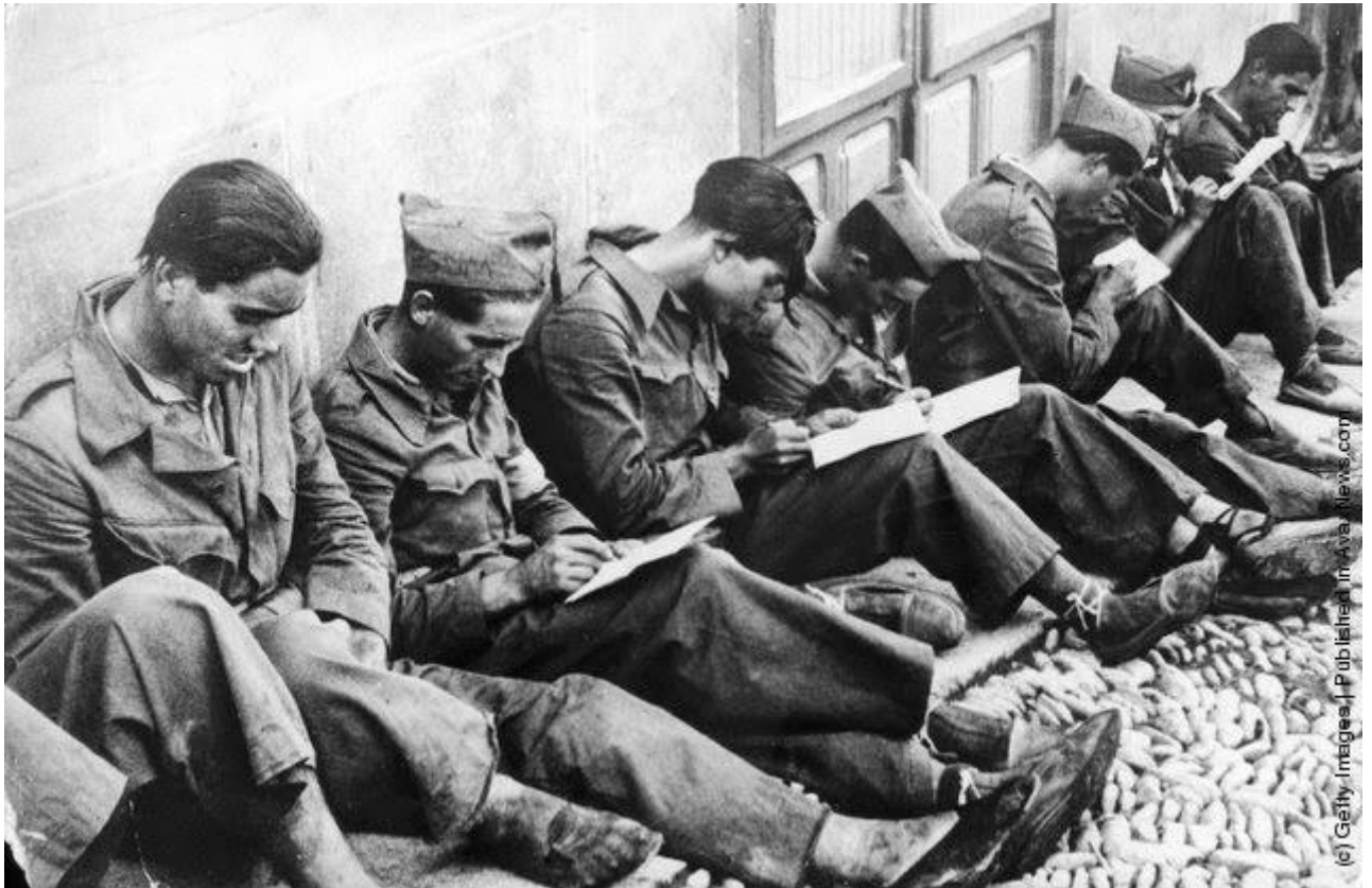
Pisanje pisama na frontu, 1936. ( http://www.vintag.es/2014/05/black-and-white-photos-of-spanish-civil.html )