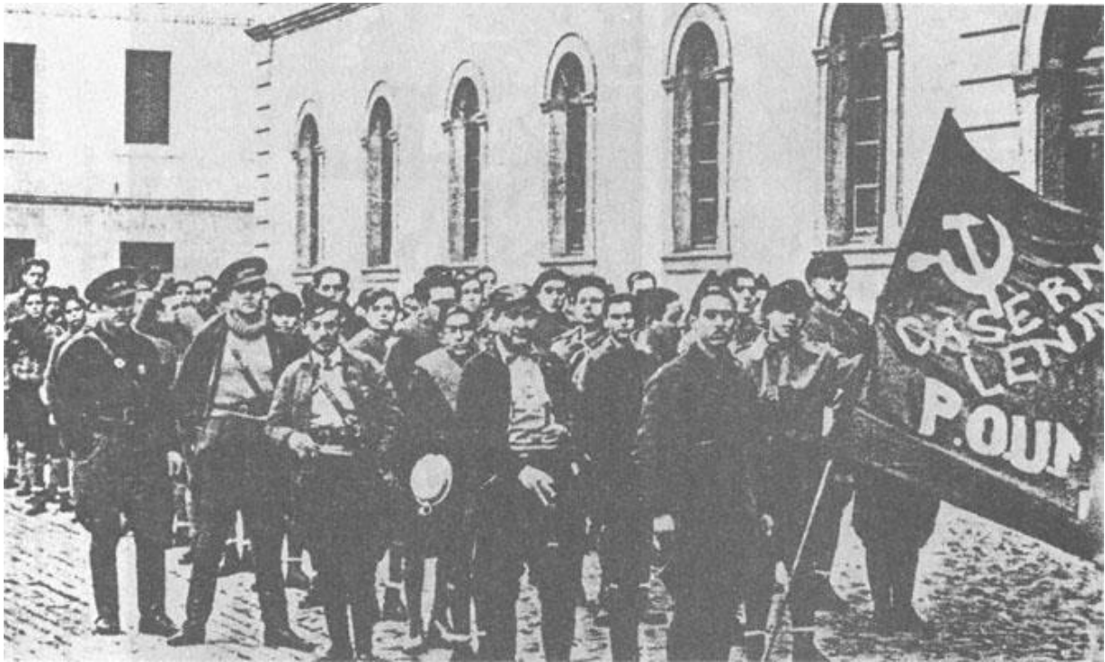
Milicija POUM- a prije odlaska na Aragonski front, kasarna Lenjin, u pozadini George Orwell, Barcelona 1936.