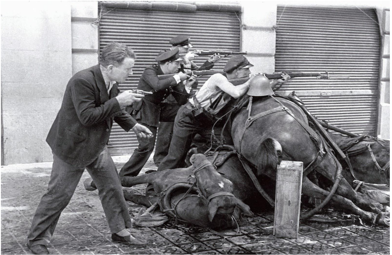
Guardia Civil i civil pucaju na ustaničko uporište, Barcelona 19. srpnja 1936.