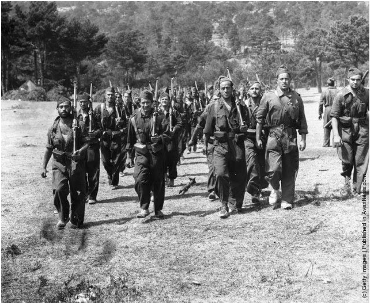
Milicija na frontu, Guadaramma, 9. rujan 1936. ( http://www.vintag.es/2014/05/black-and-white-photos-of-spanish-civil.html )