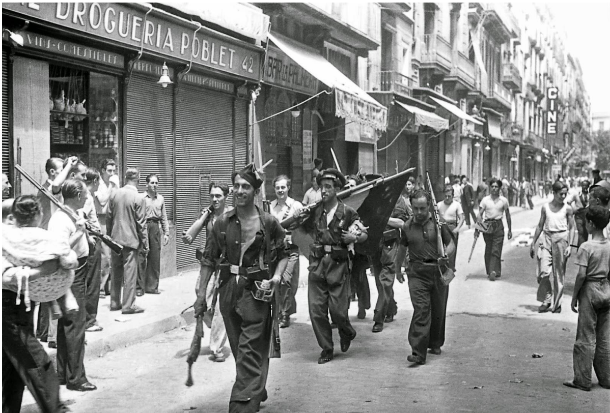
Barcelona, 19. srpanj 1936., militanti CNT-a.