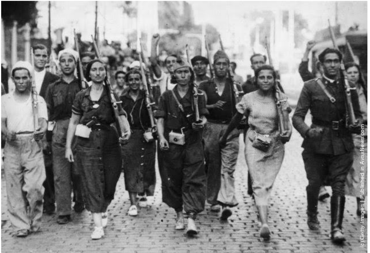
Barcelona, 19. srpanj 1936., pripadnik Guardie Civil maršira zajedno s revolucionarima netom nakon osiguranja grada.