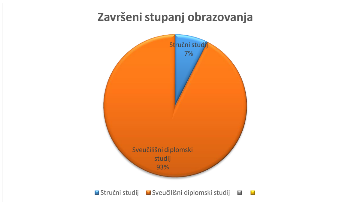
Slika 3. Broj ispitanika s obzirom na završeni stupanj obrazovanja

iskustva, te 23,3% ima 21 godinu i više. Niti jedan ispitanik nema od 11-15 godina radnog iskustva.