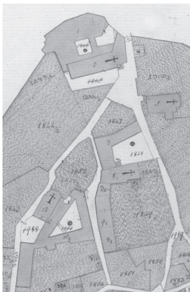
Slika. 1: Sjeverni dio grada Krka na katastarskoj mapi iz 1821. godine

Iako su samostan sv. Franje u gradu Krku trećoreci preuzeli tek 1783. godine 6 , zbog iznimne slojevitosti i starosti toga zdanja upravo njime započinjemo povijesno-umjetnički prikaz trećoredskih samostana na Kvarnerskim otocima. Na eliptičnom, u temeljima pretpovijesnom arealu pružanja krčkih gradskih zidina samostan zauzima njihov sami vršak pokraj sjevernih gradskih vrata Porte Sù(perior) . Iako smješten unutar zidina, ovaj je prostor u srednjem i ranom novom vijeku bio suburbanog karaktera. Podno njega, unutar krčkih gradskih zidina, od zapada prema istoku pružali su se i danas postojeći ženski benediktinski samostan Gospe od Anđela, ukinuti samostan klarisa s crkvom Marijina Navještenja i benediktinski samostan sv. Mihovila, od kojeg je preostala crkva koja danas nosi titular Gospe od Zdravlja. Odreda su se unutar zatvorenih samostanskih cjelina, kako je i uobičajeno uz samostanske zgrade i dvorišta, pružali prostrani vrtovi. Dok samostan sv. Franje zauzima područje uz sjeverne gradske zidine, dijelom se koristeći njima kao svojom sjevernom fasadom, crkva se pruža južno od njega. Pročeljem je orijentirana prema samostanskom vrtu, začeljem prema gradskim vratima, sjevernim zidom prema klaustru, a južnim prema Trgu krčkih glagoljaša, koji je u srednjem vijeku nosio logično ime sv. Mihovila, prema crkvi u koju se s njega moglo neposredno kročiti. 7