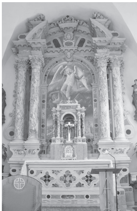
Slika 3: Giuseppe Cavallieri, glavni oltar, župna crkva svetog Mihovila, Žminj, 1706.

Oltari Cavallierijeve radionice, kao i inačice koje su iz nje izašle, postali su prepoznatljivi ne samo u Istri već i na otoku Krku. Takav je slučaj oltara Gospe od Ružarija u crkvi svetog Apolinara u Bogovićima, a koji se ovdje također može pripisati Cavallieriju. (sl. 4) Oltar je podignut 1709. za uprave Zuannea Balbija. 16 Zamišljen je poput slavoluka s četirima stupovima, dvjema nišama za kipove u interkolumniju i središnjom lučnom palom. Nad prekinutim gređem s kontinuirajućim vijencem i naglašenim obratima smješten je segmentni polukružni zabat, a nad njime istaci s mesnatim viticama i središnjim postamentom, također ukrašenim viticama. Cavallieri se za retabl oltara mogao ugledati na onaj glavni u venecijanskoj crkvi San Zulian, koji je podigao Giuseppe Sardi u sedmom desetljeću 17. stoljeća, a skulpturama u interkolumniju ukraasio Antonio Raffaelli. 17 U krčkom slučaju preuzeta je samo idejna shema, dok su kipovi naatici najvjerojatnije postavljeni naknadno. Ove se kvalitetne skulpture svetog Dominika i svetog Antuna Padovanskog mogu pripisati radionici poznatog venecijanskog kipara Paola Callala (Venecija, 1655. – 1725.).