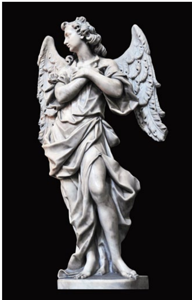
10. Giuseppe i Paolo GropPELLi, Anđeo , Katedrala, Ljubljana Giuseppe and Paolo GropPELLi, Angel, Ljubljana's cathedral

ovog oltara i inventara crkve Svetog Donata prije njezine profanacije 1798. najtemeljitiije podatke iznosi Carlo Federico Bianchi. 23 Autor, služeći se starim ispravama i vizitacijama, navodi kako je nekad izgledao interijer monumentalne rotonde Svetog Donata (sl. 13). U vrijeme vizitacije nadbiskupa Ottaviana Garzadorija 1627. crkva je bila podijeljena u dvije zone. Donja, glavna crkva imala je tri oltara smještena u apsidama, a slično je bilo i u gornjoj crkvi na galerijama, takozvanom Oratoriju Svetog Donata. U središnjoj apsidi donje crkve bio je oltar Presvetog Trojstva, u desnoj oltar svetog Donata s njegovom urnom za relikvije, dok je u lijevoj stajao oltar svetog Luke. Kada je zbog gradnji novih zidina porušena monumentalna crkva Svete Marije Velike, na glavni je oltar crkve Svetog Donata 1570. prenijeta stara romanička slika Bogorodice s Djetetom iz sredine 13. stoljeća. 24 Istovremeno je s njega slika Svetog Troj-