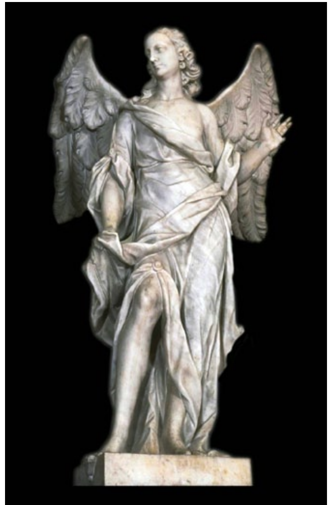
8. Giuseppe i Paolo GropPELLi, Anđeo , župna crkva, Concadirame Giuseppe and Paolo GropPELLi, Angel, parish church of Concadirame

Međutim, potpisana zadarska djela Giuseppea GropPELLija povezuju se s oltarom podignutim prema oporučnoj želji nadbiskupa Vittorea Priulija (1688. – 5. studenog 1712.). 17 Ovaj pobožni augustinac i pripadnik jedne od najuglednijih venecijanskih plemićkih i duždevskih obitelji, dao je obnoviti svoju zadarsku rezidenciju te je u njoj na drugom katu uredio i privatnu kapelu. Prilikom njegove smrti sastavljen je iscrpan popis predmeta u palači. 18 Na oltaru nalazilo se srebrno raspelo i četiri brončana svijećnjaka, a dva su pejzaža visjela nad vratima koja su bila s lijeve i desne strane oltara. U kapeli su bile slike Izgon trgovaca iz Hrama te Uskrsnuće Lazara, potom slike Uzašašće i sveti Ivan Evanđelist, a nad vratima malene sakristije, u kojoj je bilo šest nadbiskupovih misnica, stajala je slika svetog Antuna Opata. 19 Nadbiskup Priuli u svojoj je oporuci od 4. studenog 1712. izrazio želju da se podigne novi