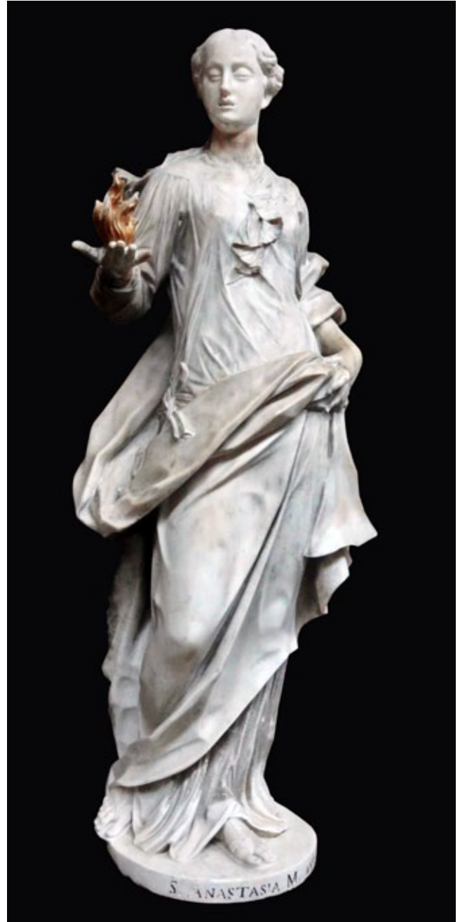
3. Antonio Corradini, Sveta Stošija , Stalna izložba crkvene umjetnosti, Zadar

Giuseppe Gropelli, St Chrysogonus , Permanent Exhibition of Religious Art, Zadar