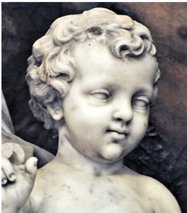
5. Paolo GropPELLi, Gospa od Ružarija , župna crkva, Veli Lošinj, detalj

Paolo GropPELLi, Our Lady of the Rosary, parish church of Veli Lošinj, detail