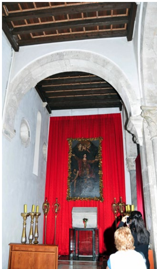
16. Kapela svete Stošije (2016.), Katedrala, Zadar Chapel of St Anastasia (2016), Zadar's cathedral