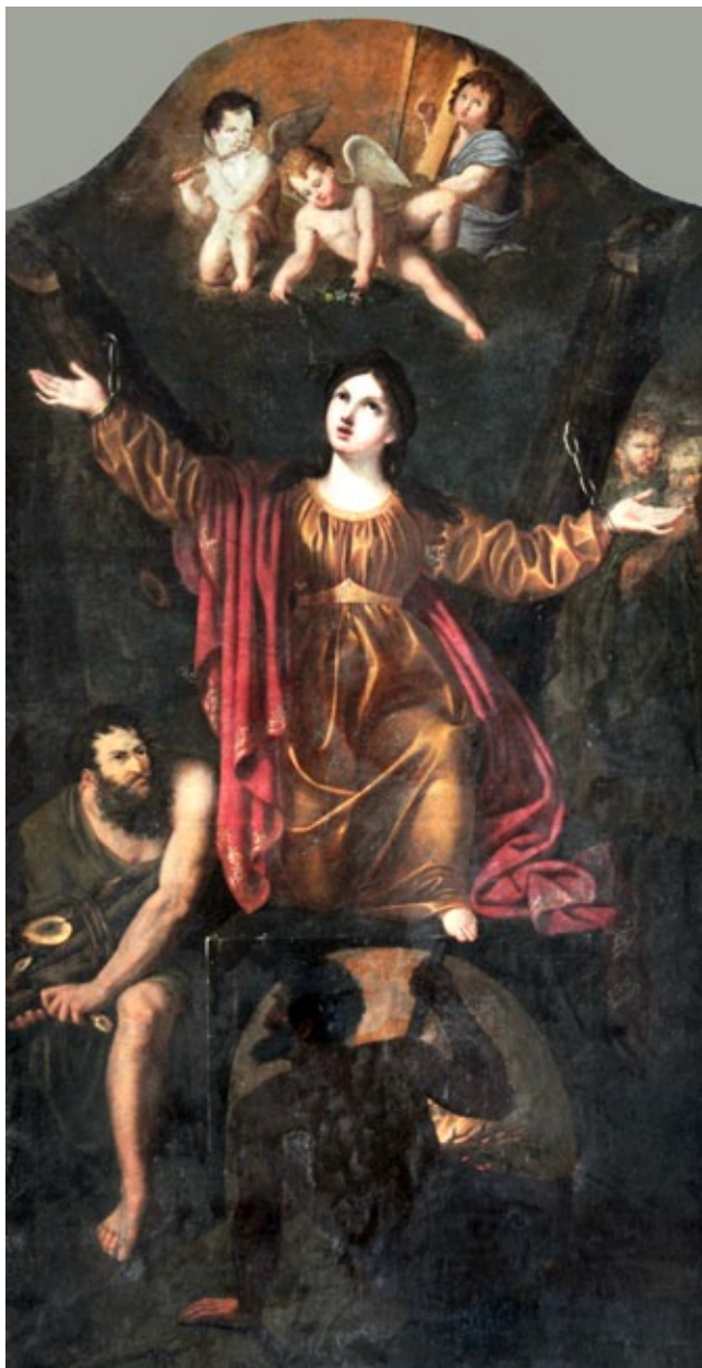
17. Giuseppe Rambelli, Mučeništvo svete Stošije , Katedrala, Zadar

Giuseppe Rambelli, Martyrdom of St Anastasia, Zadar's cathedral