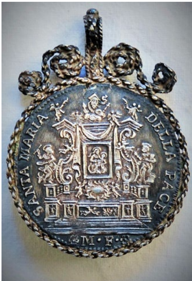
14. Medalja ( osella) dužda Alvisea IV. Moceniga s prikazom oltara iz oratorija Santa Maria della Pace, župna crkva, Plomin Medal (osella) of Doge Alvise IV Mocenigo with a depiction of the altar from the oratory of Santa Maria della Pace, parish church of Plomin