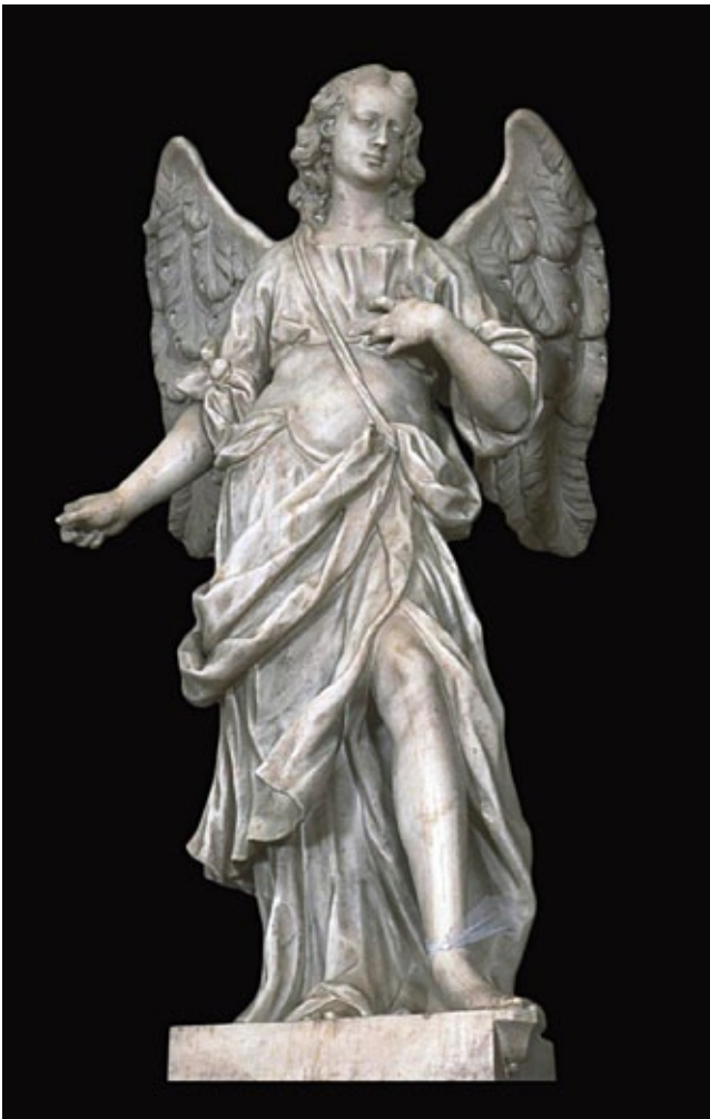
7. Giuseppe i Paolo GropPELLi, Anđeo , župna crkva, Concadirame Giuseppe and Paolo GropPELLi, Angel, parish church of Concadirame