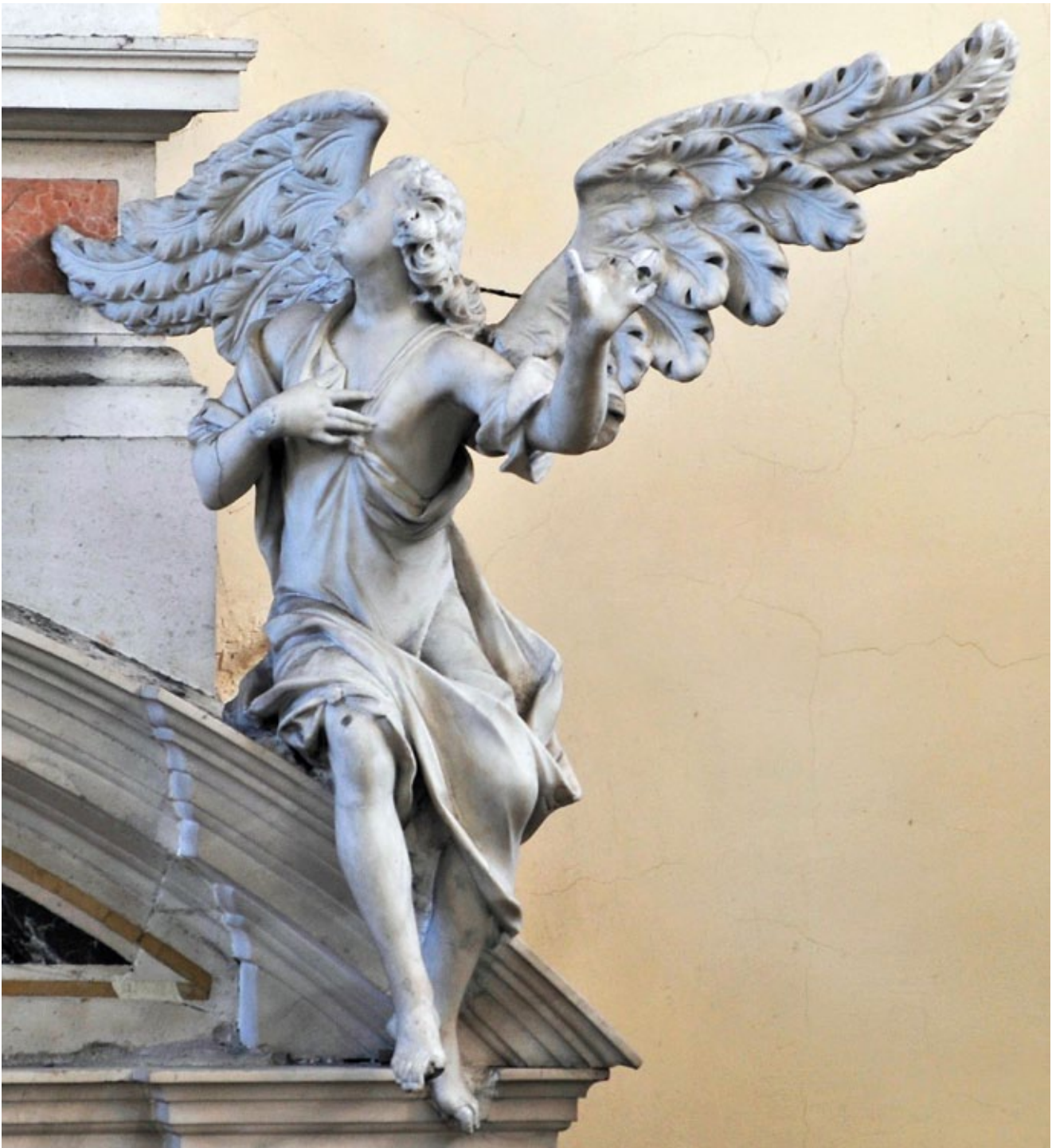
4. Giuseppe Gropelli, Anđeo , crkva Gospe Loretske, Arbanasi, Zadar Giuseppe Gropelli, Angel, church of Madonna of Loreto, Arbanasi, Zadar

Mlađa braća udružila su se u zajedničku radionicu, dokumentiranu od 1708. kod venecijanske crkve San Benedetto. Formalno ju je vodio stariji brat Giuseppe, no braća su djela uglavnom zajednički potpisivala. Od samostalnih Paolovih djela, do bratove smrti 1735., poznata je tek pre-