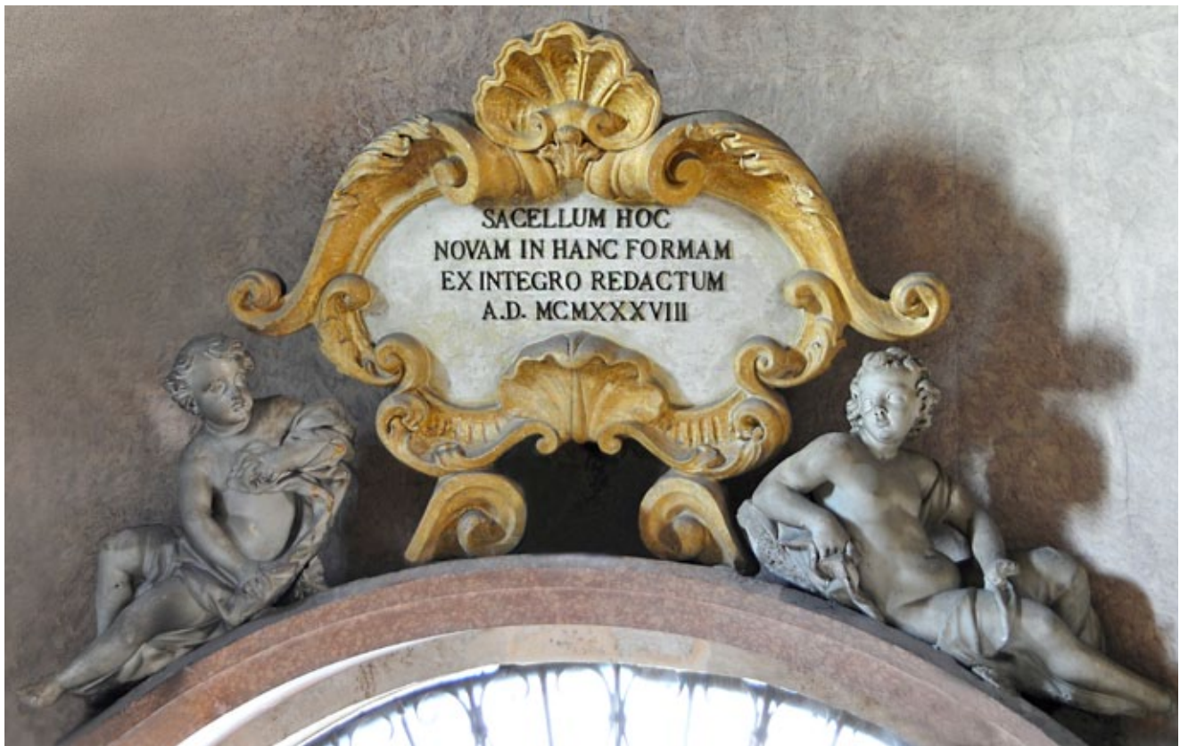
1. Giuseppe GropPELLi, Anđeli-putti, crkva Gospe od Zdravlja, Zadar Giuseppe GropPELLi, Angels-putti, church of Our Lady of Health, Zadar

gata redovnička crkva. Slično se dogodilo i sa samostanima Svetog Nikole i Svete Katarine te s brojnim sakralnim zdanjima od kojih treba istaknuti crkvu Svete Marcele, Svetog Silvestra, Svetog Roka te Svetog Antuna Opata. 4 Ne treba smetnuti s uma ni traumu koju je Zadar prošao 1943. – 1944. sustavnim bombardiranjem i rušenjem u II. svjetskom ratu. Tada su, također stradale brojne umjetnine po gradskim crkvama, naročito u benediktinskoj Svete Marije i crkvi Gospe od Zdravlja, a u potpunosti je srušena ranokršćanska krstionica Katedrale.