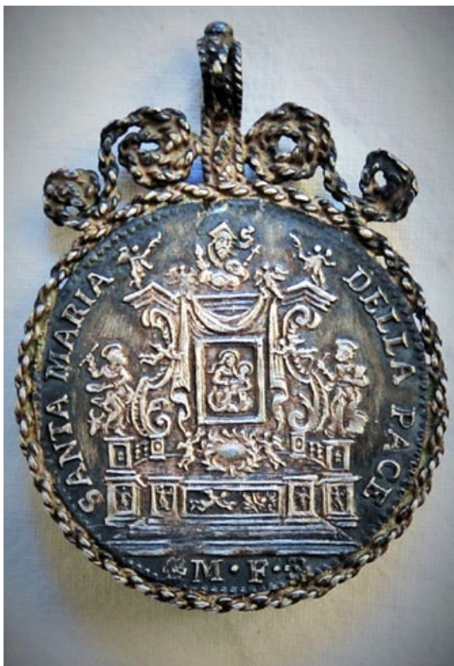
14. Medalja ( osella) dužda Alvisea IV. Moceniga s prikazom oltara iz oratorija Santa Maria della Pace, župna crkva, Plomin Medal (osella) of Doge Alvise IV Mocenigo with a depiction of the altar from the oratory of Santa Maria della Pace, parish church of Plomin