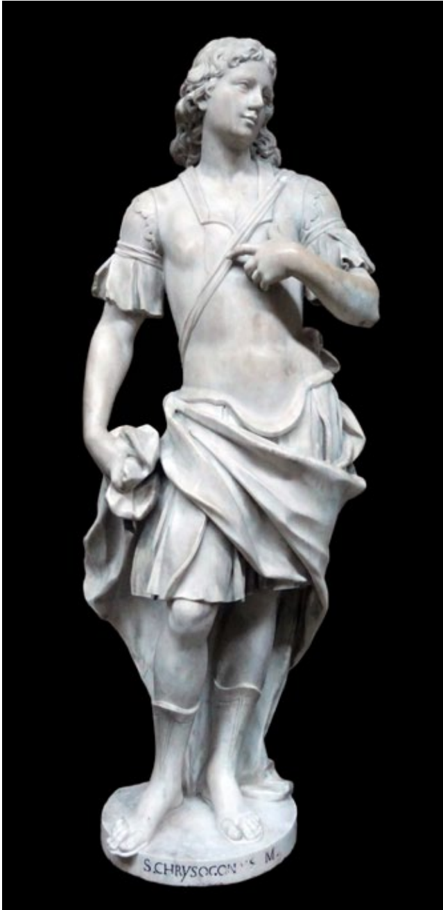
2. Giuseppe Gropelli, Sveti Krševan , Stalna izložba crkvene umjetnosti, Zadar

18. stoljeća. 8 Najstariji od njih Marino, u Dubrovniku je gradio antologijsku crkvu Svetog Vlaha (1706. – 1715.) zajedno s radionicom koja je izvela veći dio njezina glavnog oltara. 9 Njegova su i dva monumentalna anđela te četiri anđela – putta kupljena u 19. stoljeću za župnu crkvu u Velom Lošinju, a koji su napravljeni 1691. – 1692. za bivšu benediktinsku crkvu Santa Croce u Veneciji. 10