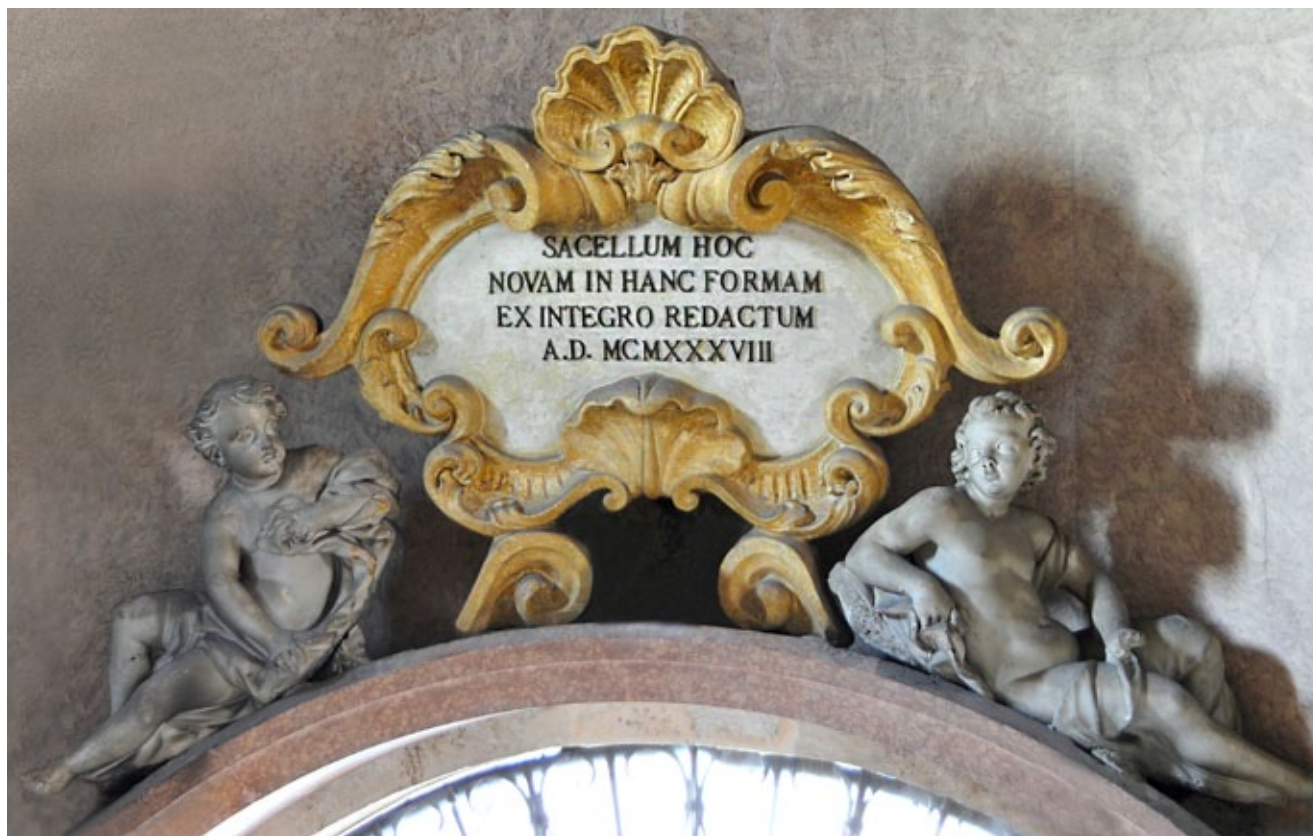
1. Giuseppe GropPELLi, Anđeli-putti, crkva Gospe od Zdravlja, Zadar Giuseppe GropPELLi, Angels-putti, church of Our Lady of Health, Zadar

gata redovnička crkva. Slično se dogodilo i sa samostanima Svetog Nikole i Svete Katarine te s brojnim sakralnim zdanjima od kojih treba istaknuti crkvu Svete Marcele, Svetog Silvestra, Svetog Roka te Svetog Antuna Opata. 4 Ne treba smetnuti s uma ni traumu koju je Zadar prošao 1943. – 1944. sustavnim bombardiranjem i rušenjem u II. svjetskom ratu. Tada su, također stradale brojne umjetnine po gradskim crkvama, naročito u benediktinskoj Svete Marije i crkvi Gospe od Zdravlja, a u potpunosti je srušena ranokršćanska krstionica Katedrale.