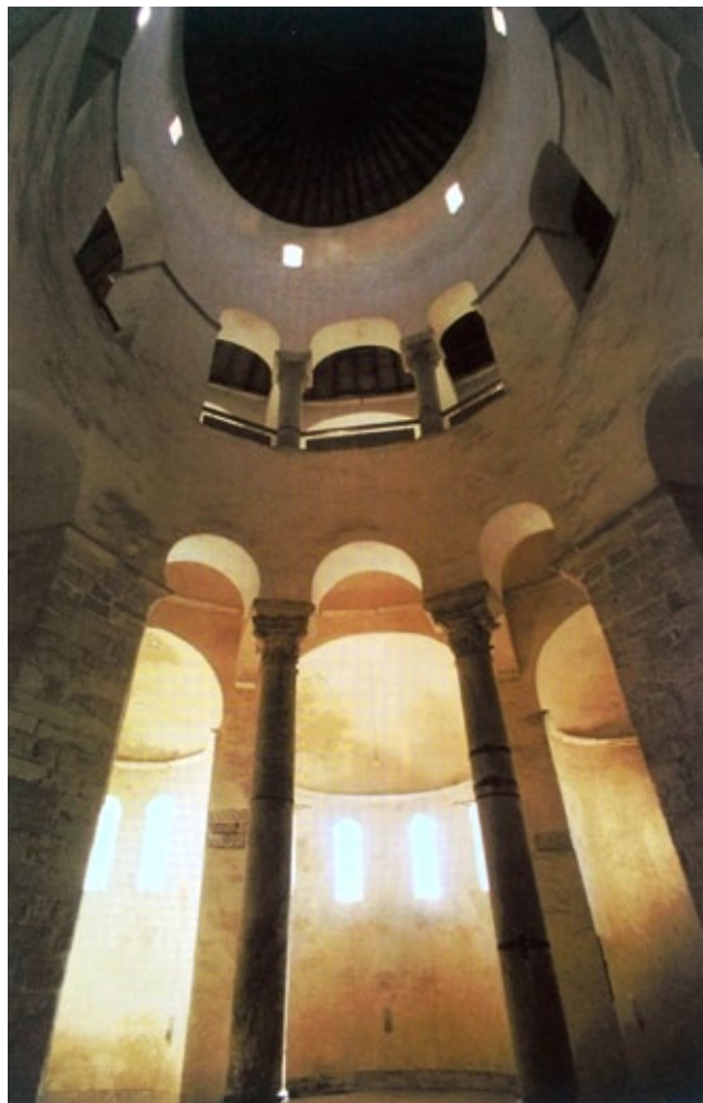
13. Unutrašnjost crkve svetog Donata s pogledom na središnju apsidu (izvor: PAVUŠA VEŽIĆ /bilj. 3/, 94)

Interior of the church of St Donatus with a view to the central apse