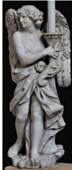
6 Giovanni Comin, Anđeo , crkva San Nicolò, Treviso

Giovanni Comin , St John the Evangelist, Franciscan church in Trsat