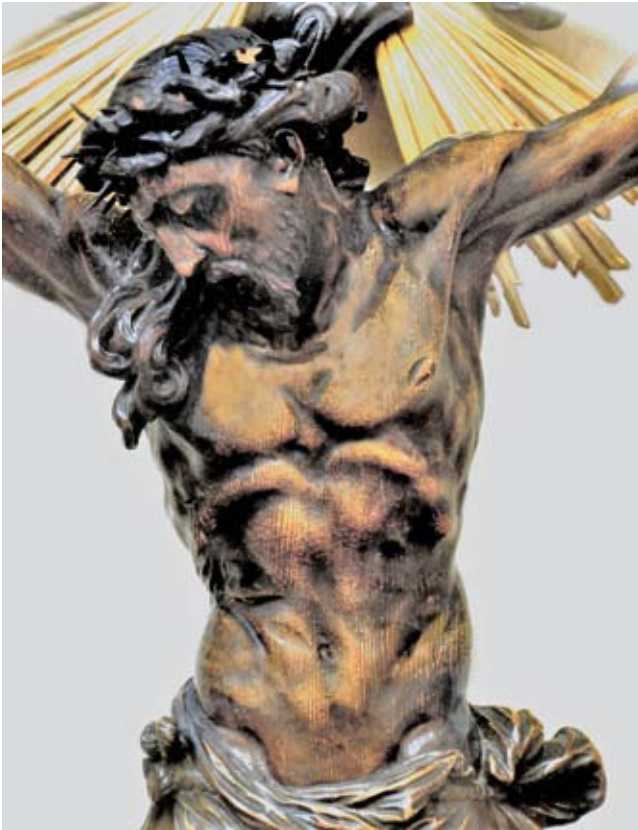
12. Giovanni Bonazza, Crocifisso , chiesa di Sant'Andrea, Padova, dettaglio

Giovanni Bonazza, Crucifix, Sant'Andrea, Padua, detail