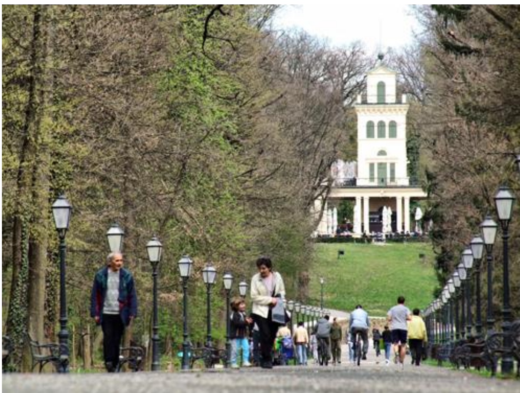
Slika 4: Maksimir