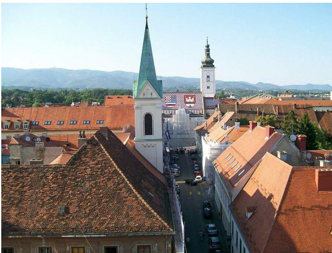
Fotografija 1: Zagreb - Gornji grad