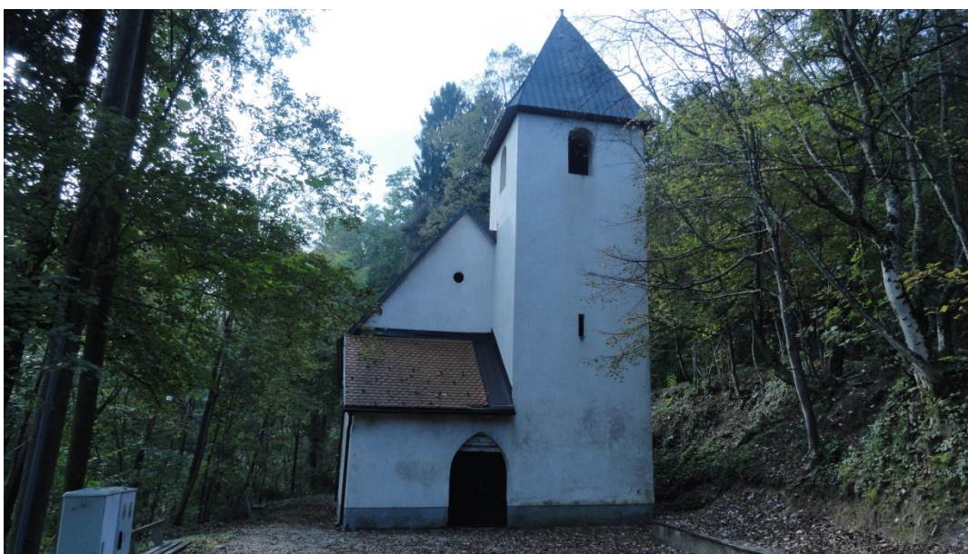
Fotografija 2: Kapela svete Ane u Anindolu, Samobor