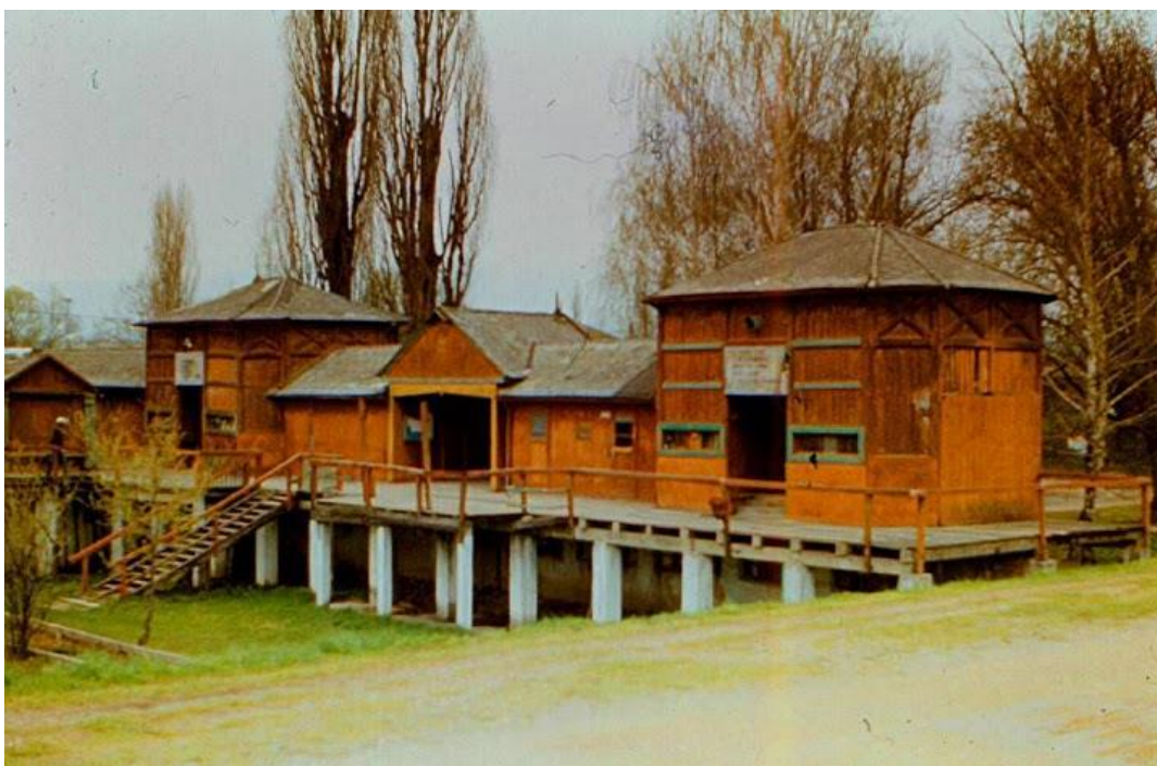
Fotografija 3: Savsko kupalište 80-ih godina