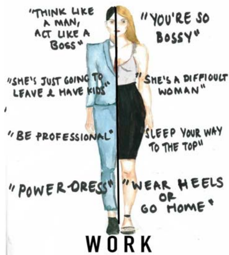
Slika 1. Dvostruki standardi temeljeni na ženskoj poslovnoj odjeći