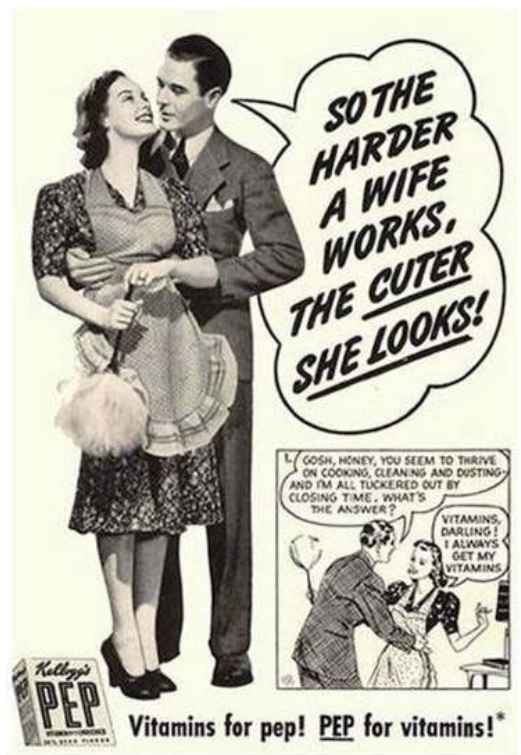
Slika 2. Reklama za Kellogg's PEP pahuljice (1930)