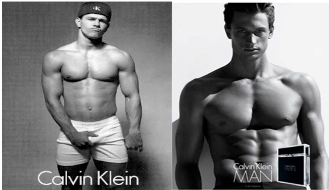
Slike 24. i 25. Prilikom seksualne objektivizacije muškaraca i dalje se prenosi subliminalna poruka moći i dominacije

Muškarac se na prvoj reklami drži za međunožje naglašavajući svoju muškost, a prodornim pogledom upućenim direktno u kameru. Mogli bismo reći kako se na taj način suprotstavlja i odupire vlastitoj objektivizaciji, naglašavajući ono što ga čini superiornim i dominantnim, to jest referirajući se na svoj spol. Na drugoj reklami naglasak je na muškarčev gornji dio tijela, dok mu je facijalna ekspresija tupa; ne pokazuje nikakvu emociju. Također, pogled je upućen direktno u kameru.