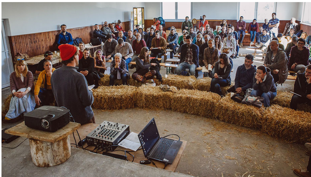
Slika 3. Radionica permakulturnog dizajna, 12.04.2018.