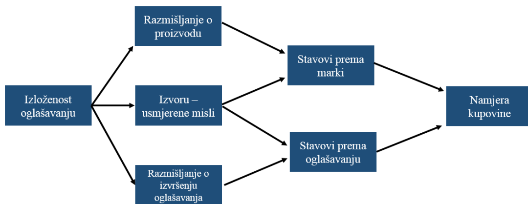
Slika 3. Grafički prikaz modela reakcije na oglašavanje prema Belch i Belch

No prilično je teško mjeriti rezultate tog procesa iako je ciljeve lako postaviti. Jedan su od poznatih modela reakcije na oglašavanje izradili George i Michael Belch. Oni smatraju da je potrošač u procesu stvaranja mišljenja o brendu podložan utjecaju različitih varijabli.