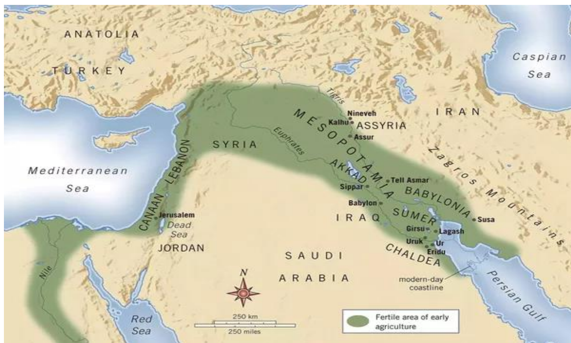
—Slika 1: Mapa civilizacija na Bliskom istoku.

Pojam drevne bliskoistočne civilizacije odnosi se ovdje na sumersku, babilonsku, starohebrejsku i grčku. Dok su se sumerska i babilonska civilizacija smjestile u plodnim dolinama rijeka Eufrat i Tigris, hebrejska je bila u njihovoj neposrednoj blizini, odnosno u Kanaanu. Grčka se civilizacija ne može geografski smjestiti na Bliski istok, no uključena je u ovaj rad zbog svoje snažne povezanosti sa spomenutim civilizacijama, kao što ćemo vidjeti u nastavku rada. Važno je napomenuti i veliku razliku u geografiji ovih regija, koja je donijela različite društvene djelatnosti i zanimanja. Tako je Grčka bila pomorska zemlja