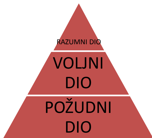
Shema br. 2. – Podjela duše kod Platona

Da bi bolje shvatili način na koji Platon dijeli dušu, u nastavku će, na shematski način biti prikazana podjela iste: