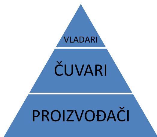
Shema br. 1 – podjela Platonove države

Kako bismo bolje shvatili Platonovu interpretaciju odnosno podjelu države na staleže, bit će prikazana sljedeća shema koja prikazuje sastav Platonove države: