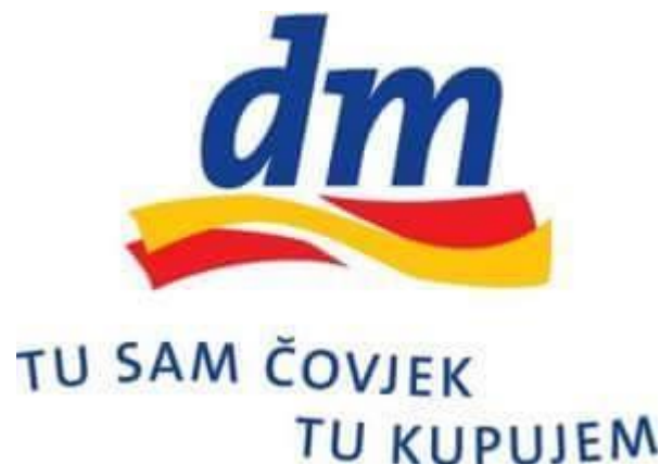
Slika 7. Reklama 6. 10

Nivea šalje jedinstvenu poruku koja je razumljiva cijelome svijetu. Kao takva uključuje koheziju unutar koje riječi prate gramatička pravila i kao takve su razumljive svima. Koherencijom se poručuje i naglašava dostupnost ovoga proizvoda, a intencionalnošću se naglašava snaga spomenute kreme koja hrani kožu. Reklama je prihvatljiva za oba spola, vrlo je razumljiva i šalje jednostavnu poruku unutar koje sadrži mnoge informacije pa možemo govoriti i o prisutnosti informativnosti. Situativnost se odnosi na potrebne signale koji su potrebni za određenu komunikacijsku situaciju. Ovdje je definitivno prisutna intertekstualnost jer u jednoj reklami postoje dvije. Jedna je povezana s Niveinom prošlošću što znači da su potrošači itekako upoznati s navedenim proizvodom, a druga se odnosi na sadašnjost i uključuje nove informacije koje su korisne potrošačima.