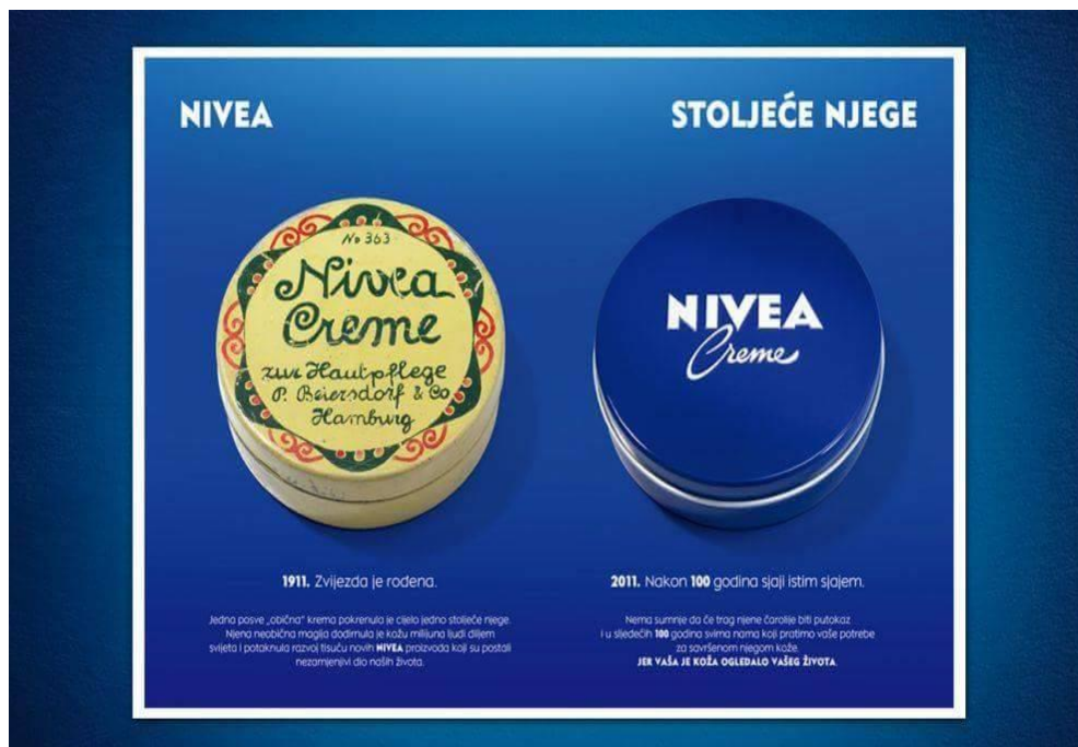
Slika 6. Reklama 5. 9

Svaka će žena putem ove reklame dobiti i dovoljno željenih informacija, bilo da je riječ o poznatome ili nepoznatome. Situativnost je također prisutna jer se točno zna da je ova reklama plasirana na tržište ciljanoj skupini i kao takva ispunjava svoju relevantnost. Ovdje možemo govoriti i o intertekstualnosti jer je očito kako se ova reklama nastavlja na prethodnu reklamu sa sličnim proizvodom. Dakle, žene su već upoznate s pojedinim informacijama iz prijašnjih reklama za proizvode za kosu.