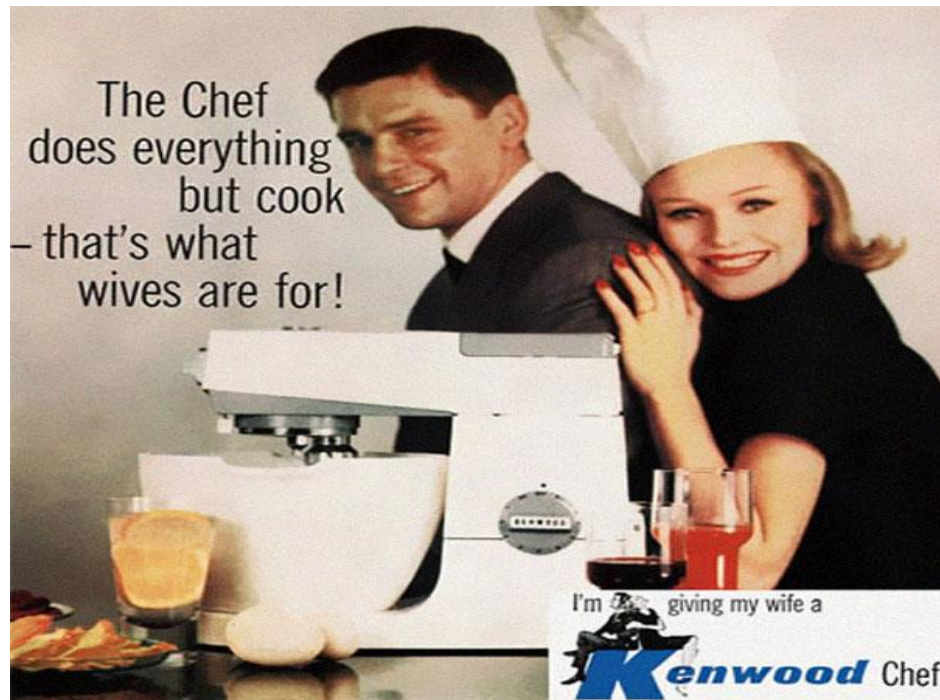
Slika 1. Reklama 1. 3

Ono što se očituje u takvom tipu reklama, svakako su šovinizam i stereotipija. To je najbolje vidljivo u odnosu između muškarca i žene. Riječ je o dva suprotna svijeta – jačem i slabijem. Muškarci su prikazani kao snažniji, zaštitnički spol, dok su žene promatrane kao slabije, podređene i ponižavane jedinice kojima je mjesto u kuhinji. Primjer jedne takve slike društva možemo vidjeti u sljedećoj reklami: