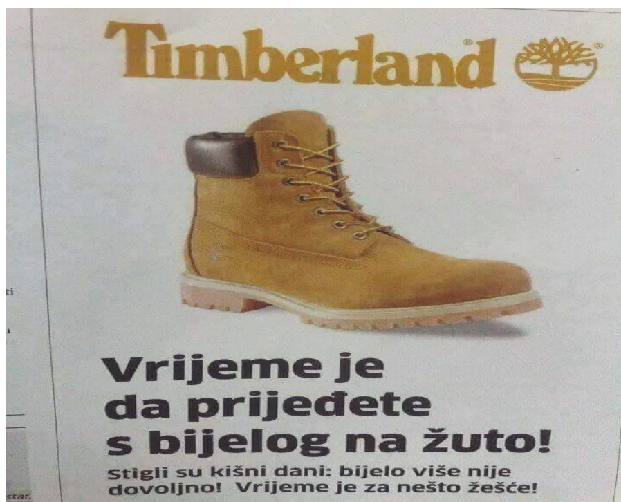
Slika 4. Reklama 3. 6

Kao što smo već naglasili, svatko od nas drugačije percipira reklamu. Svaka na nas drugačije utječe, ali sve imaju isti cilj – impresionirati i potaknuti pojedinca na kupnju određenog proizvoda. Reklame nas uvjeravaju da nam baš taj proizvod treba te nas navode na potrošnju.