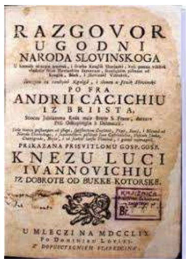
Slika 2 Razgovor ugodni naroda slovinskoga (1756. - 1759. godine)

Izvor: https://www.goodreads.com/book/show/16128552-razgovor-ugodni-naroda-slovinskoga , pregledano 2. kolovoz 2018