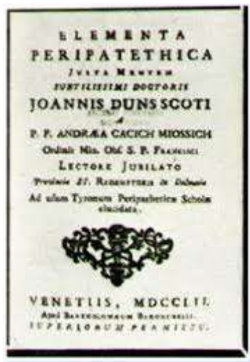
Slika 1 Elementa peripatethica iz 1752. godine