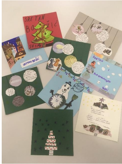
Božićne čestitke izradene od starih knjiga

Učenici Medijske grupe su snimili promotivni video o svojoj školskoj knjižnici kako bi ju kreativno predstavili na Prolječnoj školi školskih knjižničara .