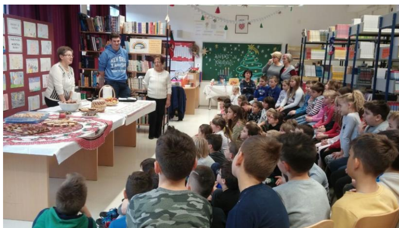
Projekt školske knjižnice „Božić po starinski“

U suradnji s predmetnim nastavnicima redovito se organiziraju projekti poput Božić po starinski , Najljepše ljubavne poruke ili Halloween vs. Holywin koji žele potaknuti djecu na samostalno istraživanje i stvaranje u prostoru knjižnice. Nastoji se, koliko god je moguće, i nastavu premjestiti u knjižnicu, kako bi se djeci i na takav način približila knjiga i prostor knjižnice.