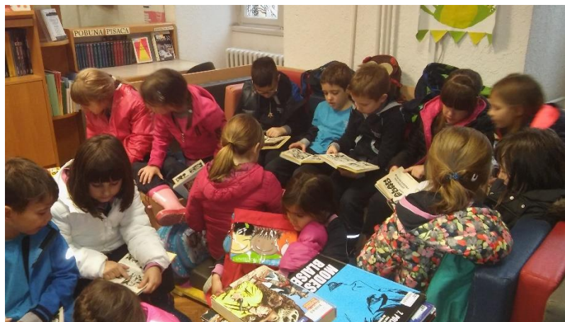
Posjeta dječjem odjelu Gradske knjižnice „Stribor“

Knjižničarka organizira i posjete drugim knjižnicama pa učenici često idu u posjet i dječjem odjelu Gradske knjižnice „Stribor“. Na taj se način djecu nastoji upoznati sa knjižnicom kao kulturnom ustanovom te kod njih razviti interes i ljubav prema čitanju.