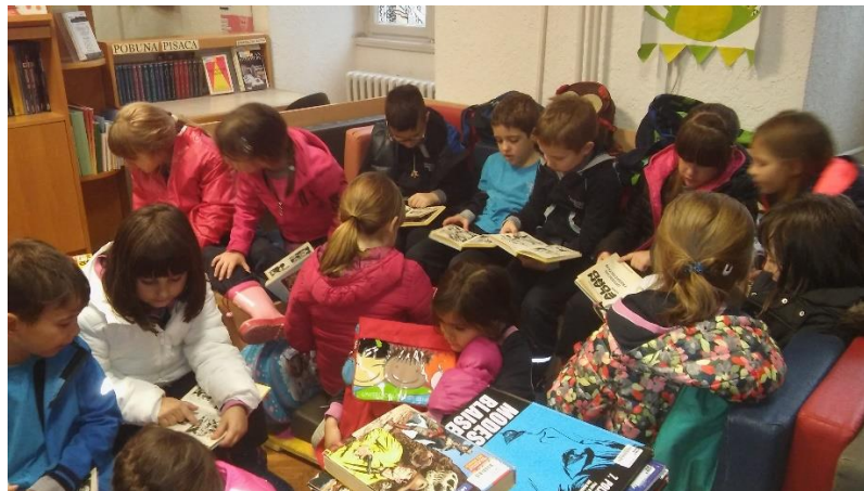
Posjeta dječjem odjelu Gradske knjižnice „Stribor“

Knjižničarka organizira i posjete drugim knjižnicama pa učenici često idu u posjet i dječjem odjelu Gradske knjižnice „Stribor“. Na taj se način djecu nastoji upoznati sa knjižnicom kao kulturnom ustanovom te kod njih razviti interes i ljubav prema čitanju.