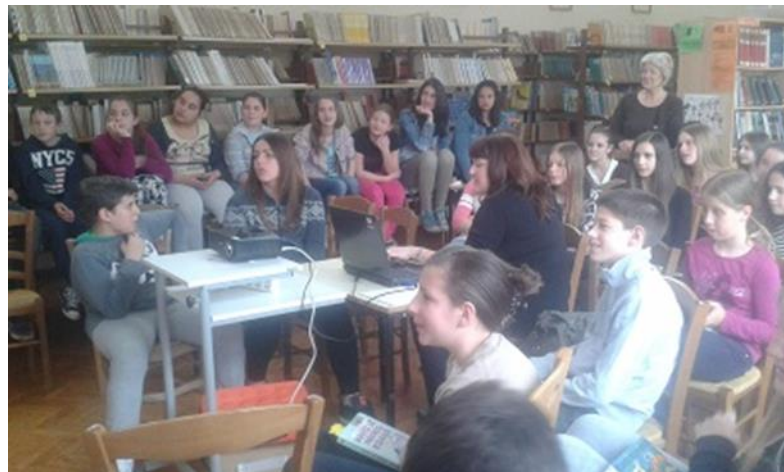
Obilježavanje manifestacije Noć knjige

Već tradicionalno, u toj se knjižnici obilježava i Noć knjige , manifestacija pod pokroviteljstvom Vlade Republike Hrvatske i djeca se tada uključuju u mnoštvo aktivnosti. Među djecom se provode ankete o tome koliko i kako čitaju te ih se potiče da odaberu svoje omiljene knjige ili ulomke i da ih čitaju drugim učenicima. Tijekom te manifestacije mlađe učenike posjećuje „teta pričalica“ i priča im poznate dječje priče domaćih autora, stariji učenici pripremaju recitacije i igrokaze prema mnogim poznatim djelima.