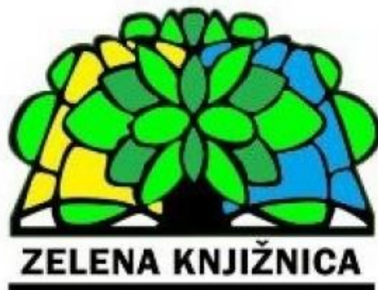
Slika 1: Logo projekta Društva bibliotekara Istre „Zelena knjižnica“ 67

Prateći svjetske trendove i hrvatske knjižnice su prepoznale važnost informiranja svojih korisnika i šire javnosti o ekološkim temama, no s programima i brojni aktivnostima su krenule tek desetak godina kasnije u odnosu na prve programe diljem svijeta.