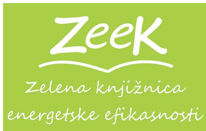
Slika 2. Logo projekta Zelena knjižnica energetske efikasnosti u knjižnicama 72

gospodarstva, rada i poduzetništva i Programa Ujedinjenih naroda za razvoj i uz financijsku podršku Globalnog fonda za okoliš - Poticanje energetske efikasnosti u Hrvatskoj (2005. - 2013.). 73