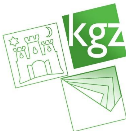
Slika 7. Logo projekta "Zelena knjižnica za zeleni Zagreb" 100

Knjižnice grada Zagreba također su dio zelenog pokreta sa svojim projektom „Zelena knjižnica za zeleni Zagreb“ kojeg su pokrenuli 2017. godine.