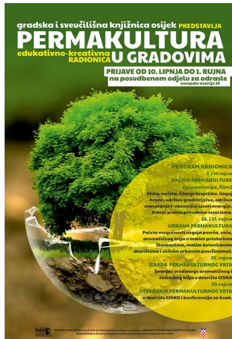
Slika 5. Najava radionice "Permakultura u gradovima" 88

bilja u malim prostorima (na balkonima, u malim betoniranim dvorištima i sličnim urbanim površinama), a kao praktični zadatak morali su zajednički izraditi mali