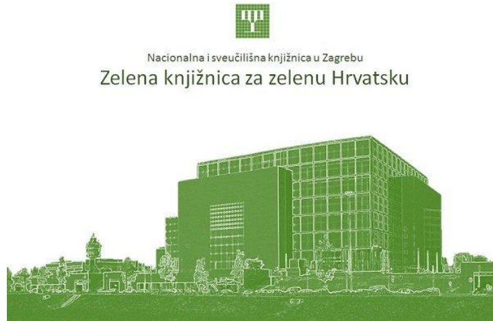
Slika 6. Logo projekta "Zelena knjižnica za zelenu Hrvatsku" 95

sadržaja, uključena u međunarodni ekološki projekt te je oformila Ekogrupu. Suradivala je također s Udrugom ZMAG (Zelena mreža aktivističkih grupa) s kojom su organizirali predavanja i radionice na temu ekologije. 94