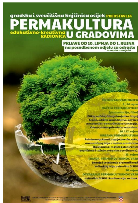
Slika 5. Najava radionice "Permakultura u gradovima" 88

bilja u malim prostorima (na balkonima, u malim betoniranim dvorištima i sličnim urbanim površinama), a kao praktični zadatak morali su zajednički izraditi mali