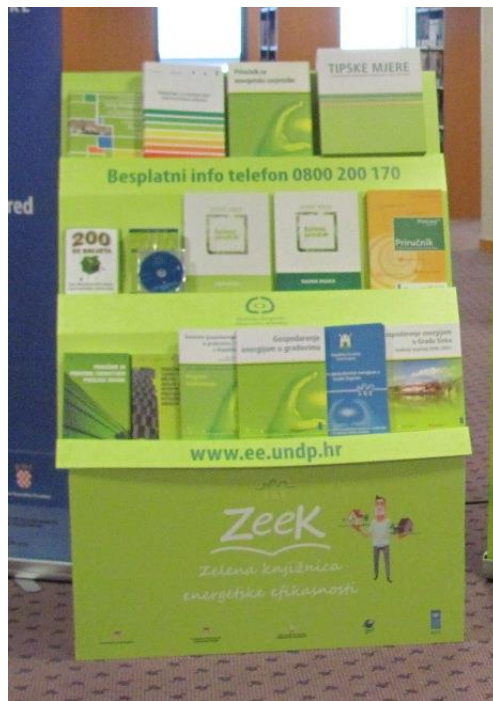
Slika 3. Polica Zelene knjižnice energetske efikasnosti 77

knjižnica, od školskih, visokoškolskih do narodnih diljem Hrvatske (Split, Rijeka, Osijek, Pula, Zadar, Karlovac,...). 76