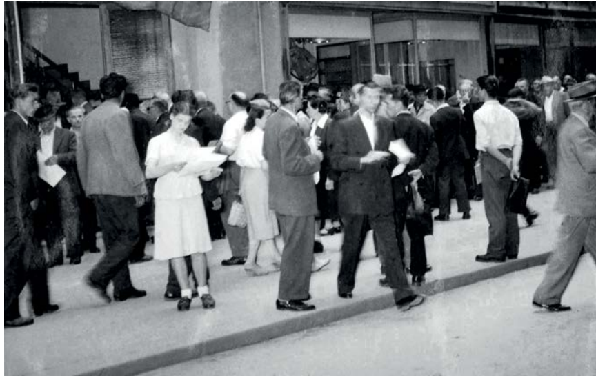
Prilog 1: Redovi ispred Američke čitaonice u Zagrebu na podjeli dnevnih radionovina Bilten