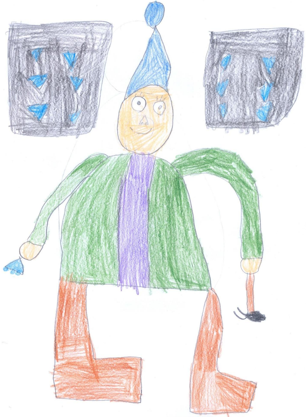
Prilog 2: Rad nastao tijekom radionice Pričanje priča u knjižnici, učenički rad