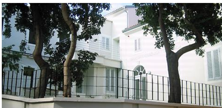
Slika 3.: Zgrada Gradske knjižnice i čitaonice Mali Lošinj (2012.)