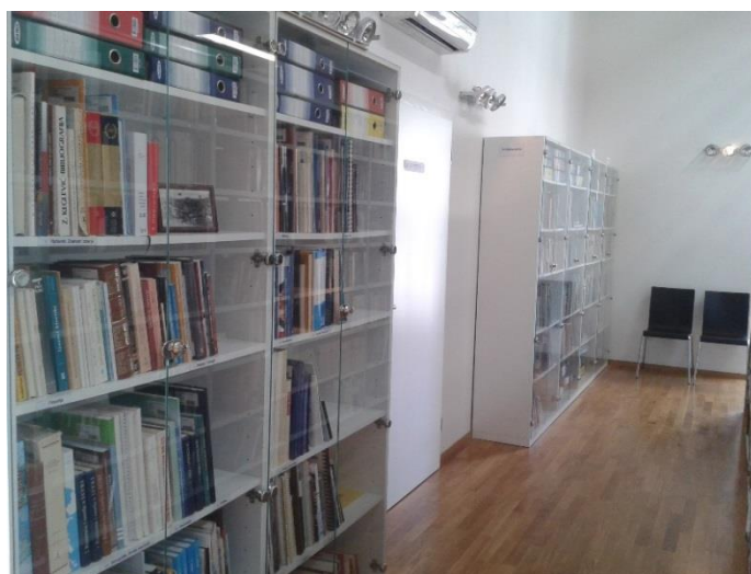
Slika 4.: Zavičajna zbirka Gradske knjižnice i čitaonice Mali Lošinj

U sadašnjem novouređenom prostoru zavičajna građa je i dalje izdvojena iz općeg fonda te je smještena u posebnim drvenim ostakljenim ormarima u Odjelu stručne i popularno-znanstvene literature. Monografske publikacije imaju oznaku Z ispred stručne oznake u signaturi, a periodične publikacije koje se stručno obrađuju od 2013. nose oznaku ZP. Veći dio građe može se koristiti isključivo u prostoru Knjižnice uz pomoć knjižničarke koja otvara ormar i uručuje korisniku potreban primjerak, a korisnik nakon korištenja građu vraća knjižničarki. Zavičajna građa koju knjižnica posjeduje u više od dva primjerka i novijeg datuma daje se na korištenje i posudbu korisnicima izvan Knjižnice prema pravilima posudbe. Dio zavičajne građe za koji postoji mogućnost posudbe nije smješten u opći fond, već je izdvojen i smješten u poseban ormar na samom kraju zbirke.