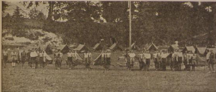
Hrvatski Junaci u radu i borbi spremni za Boga i Hrvatsku