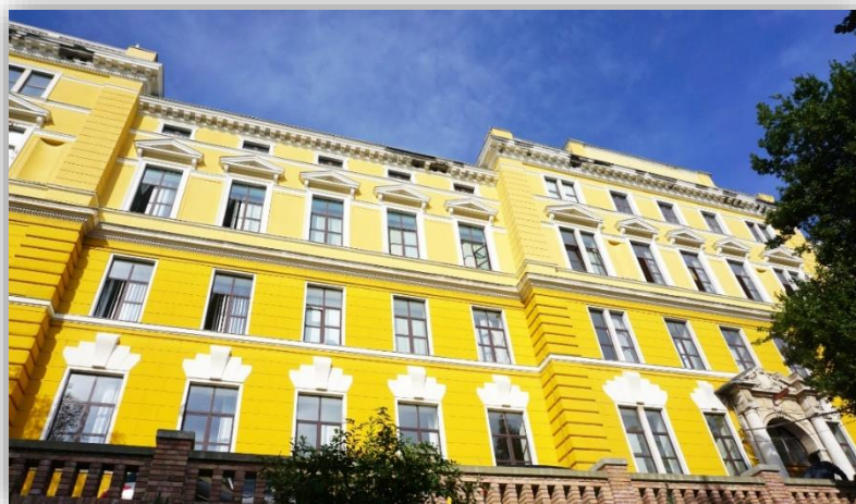
Slika 2. Zgrada Pedagoškog fakulteta u Rijeci, Omladinska 14

djeluje pri Filozofskom fakultetu u Rijeci. Knjižnica kontinuirano napreduje, pa je zabilježeno da je 1988. godine imala fond od 75.000 svezaka knjiga i 7.000 svezaka domaćih i stranih časopisa. Zabilježen je i statistički podatak da je pri studijskom radu u čitaonici te godine korišteno 45.000 knjiga. 41