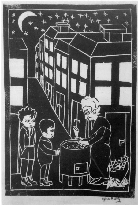
Slika 6. Vjera Biller, Stara prodavačica kestena , linorez, 49.7x34.7, 1921., Mađarska nacionalna galerija, Budimpešta