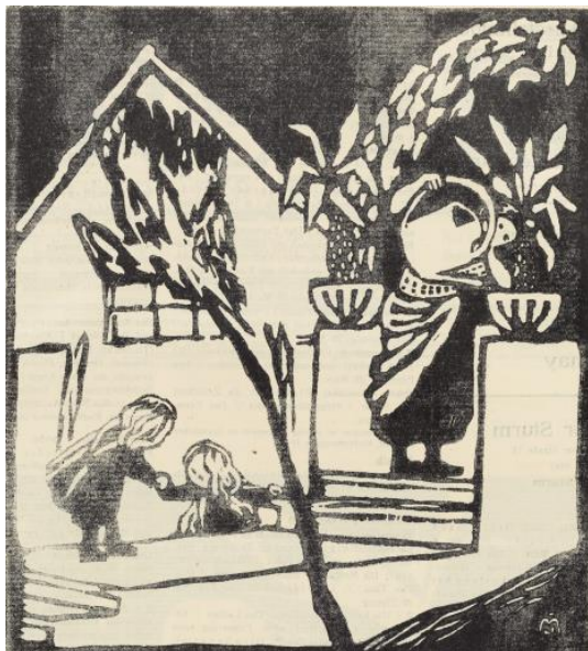
Slika 10. Gabriele Münter, Bez naziva , drvorez (Reprodukcija iz časopisa Der Sturm 138/139. (1912.)