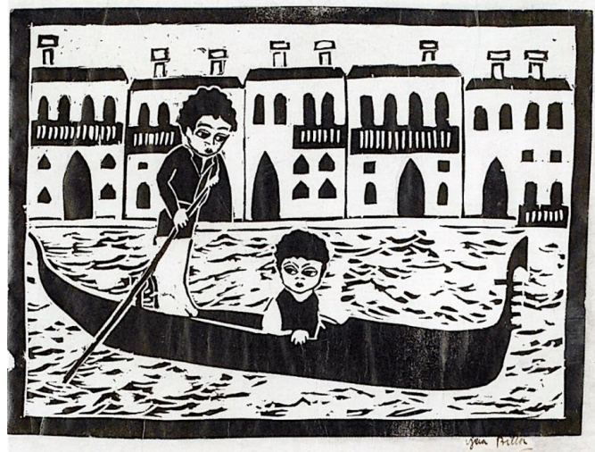
Slika 2. Vjera Biller, Gondola , 1921., linorez, 34.7 × 49.7 cm, Narodni muzej u Beogradu