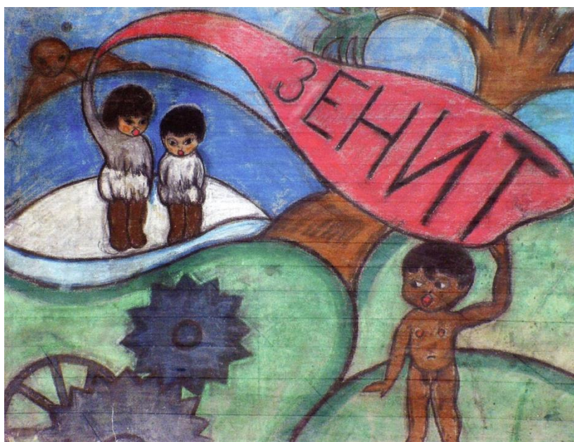
Slika 8. Vjera Biller, Zenit , 1924., pastel na papiru, 60.3 × 48.6 cm, Narodni muzej u Beogradu