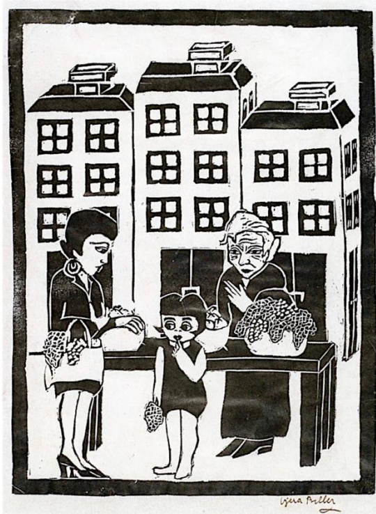
Slika 3. Vjera Biller, Tržnica , 1921., linorez, 49.7 × 34.7 cm, Narodni muzej u Beogradu

između likova pomalo je zbunjujuća ako se u obzir uzmu tjelesni pokreti i pogledi svakog od njih. Za očekivati je da bi starica sa podignutom rukom gledala u kupce ili voće koje želi dohvatiti, ali njezin je pogled uperen direktno u promatrača. Slično tome majka podiže ruku kako bi uzela grozd od djevojčice u koju gleda, no njezina je preokupacija voće u majčinoj torbi ili događaj izvan prizora slike. Neodređeni međuodnos likova doprinosi osjećaju otuđenosti i distanciranosti koji određuje ton čitave serije, a djevojčica s bubi frizurou se centralnim smještajem ponovno pojavljuje kao fokus slike.