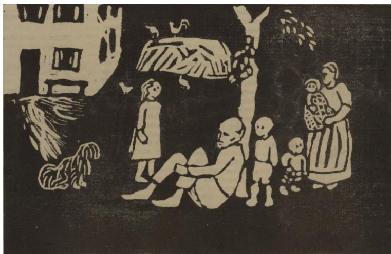
Slika 11. Gabriele Münter, Bez naziva , drvorez (Reprodukcija iz časopisa Der Sturm 152/153.(1913.)

Drvorez Gabriele Münter prikazuje igru dvoje djece, najvjerojatnije djevojčica, u vrtu pokraj kuće. Pokraj njih se nalazi žena koja zalijeva cvijeće u lončanicama. Prostor je građen linearno i bez detalja, tek sa naznakama stepeništa, ograde i dijelova kuće poput prozora i krova. Unatoč tome, drvorez daje naslutiti slikarsku vještinu autorice, primjerice u tretmanu suknje odrasle žene koja odaje određeni volumen. Ekspresionističke detalje susrećemo u oblikovanju bilja; poglavito krošnje drveta koje vizualno odvajaju djevojčice od zaposlene žene. Lica likova ne pokazuju nikakve karakteristike osim naznake očiju, jednako kao i na Münterinom drvorezu iz 152/153. broja Der Sturm koji prikazuje šesteročlanu obitelj. Sudeći prema domaćim životinjama i platu sijena u pozadini, riječ je o portretu seoske obitelji u vrtu kuće, a zanimljivim ekspresionističkim i linearnim oblikovanjem posebno se ističe dugodlaki pas.