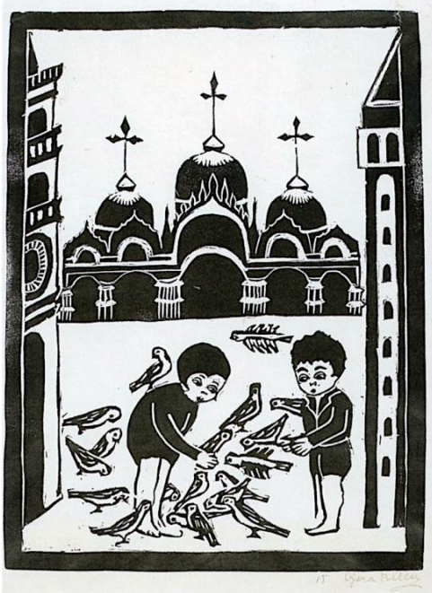
Slika 1. Vjera Biller, Trg svetog Marka , 1921., linorez, 49.7 × 34.7 cm, Narodni muzej u Beogradu