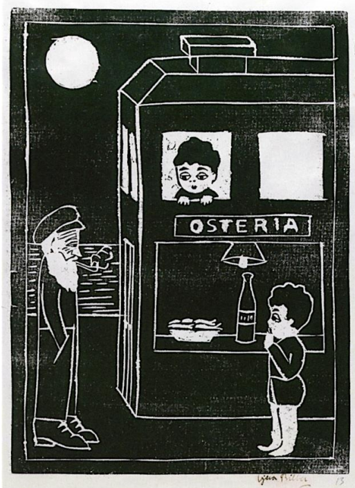
Slika 4. Vjera Biller, Osteria , 1921., linorez, 49.7 × 34.7 cm, Narodni muzej u Beogradu