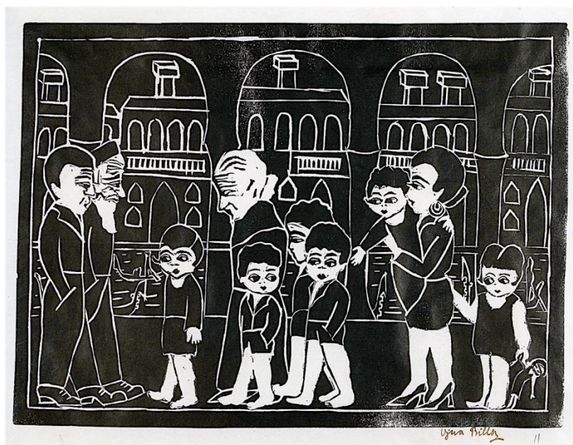
Slika 5. Vjera Biller, Šetnja Venecijom , 1921., linorez, 49.7 × 34.7 cm, Narodni muzej u Beogradu