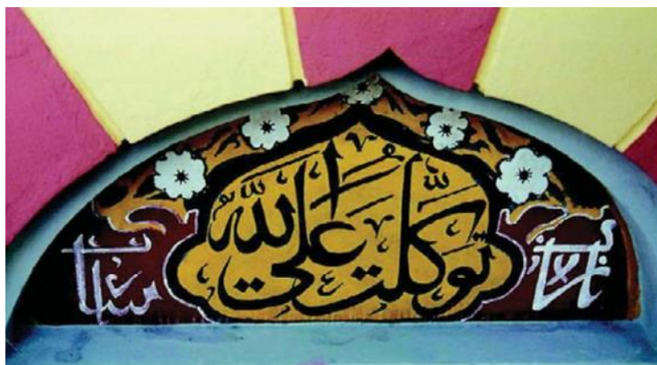
Fotografija 7: Detalj pročelja, Turska kuća, Rijeka, 1906.

Na trećem katu Verdijeve ulice nalazi se 7 natpisa. Natpisi su smješteni unutar žuto ispunjenog oblika koji u donjem dijelu nalikuje cvjetnom obrubu, a u gornjem vrhu turbana. Natpisi se tekstom ne razlikuju od drugih, a glase: „Uzdam se u Boga!“ (ovaj se natpis ponavlja dva puta), „Spas je u iskrenosti!“, „O, Gospodaru moći!“, „Bog te zaštitio!“, „Blagoslovio uzvišeni Bog!“ i „Ne ureklo se!“. 34 Situacija na trećem katu ulice Vatroslava Lisinskog nije bitno drugačija, a natpisi su sljedeći: „Blagoslovio uzvišeni Bog!“, „Uzdam se u Boga!“, „Spas je u iskrenosti!“, „U ime Boga milostivog i samilosnog“, „O, Gospodaru moći!“, „Bog je najbolji zaštitnik! 1324.“, „Blagoslovio uzvišeni Bog! 1325.“ i „Ne ureklo se!“. 35 Na dvije lunete tekst je oštećen te nije sa sigurnošću otkriveno što piše, no za jedan se pretpostavlja da je natpis „Uzdam se u Boga“, 36 a za drugi da je napisano ime Nikolakides. 37 Ispis varijante Nikolakijeva imena odskače od ostalih natpisa na prve tri etaže, ali uzevši u obzir činjenicu da se nalazi na posljednjoj etaži na kojoj se nalaze oslikane lunete, te na luneti kojom završava niz luneta te etaže, može se gledati kao namjerni naglasak. Također se može gledati i kao prijelaz iz natpisa s tematikom vjere na natpise koji se protežu uz potkrovnju traku.