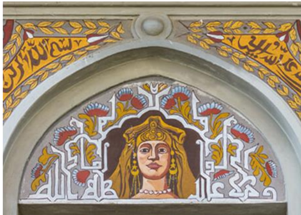
Fotografije 3 i 4: Detalj pročelja, Turska kuća, Rijeka, 1906.

Drugi kat Turske kuće nema figuralne prikaze te se u svakoj luneti natpis pojavljuje na jednom mjestu. Natpis se nalazi u žuto obojenom obliku koji može podsjećati na turban. U Verdijevoj se ulici ukupno nalazi sedam natpisa od kojih su četiri različita. Prvi natpis, koji je jedini koji se pojavljuje samostalno, glasi „Ne ureklo se!“ 24 Od sljedećih se svi pojavljuju u dva navrata, a prevode se kao: „O, Božji poslanice, o, moj oče, o, majko moja!“, „Uzdam se u Boga!“ i „Ne ureklo se!“ 25 Razlika između ova dva natpisa koja se prevode kao „Ne ureklo se“ jest u pismu. Prvi natpis koji se pojavljuje samostalno pisan je uglatim kufi pismom 26 dok je drugi, ponovljen u dva navrata, pisan sulus pismom. 27 Drugi kat koji gleda na ulicu Vatroslava Lisinskog formalno je drugačiji od strane koja gleda na Verdijevu ulicu. Ovdje se nalazi 10 natpisa, no oblikovanje luneta je drugačije te se zbog toga na različiti način pojavljuju. Na ovoj se strani nalaze i dva trodijelna natpisa što je posljedica uklapanja luneta i nadprozornika ili slijepih lukova iznad balkona na trećem katu. U ovom slučaju, zbog oblika balkona (odnosno ravnog