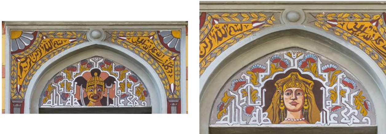
Fotografije 3 i 4: Detalj pročelja, Turska kuća, Rijeka, 1906.

natpise uz smisao i poruku legende. Naime, uz pomoć Boga i njegove samilosti, njegovog znanja i snage, čovjek uspijeva shvatiti poantu života i slobode i osigurava takav osjećaj i drugima, onima koji su u određenim vremenima ljudske povijesti smatrani nižom klasom - ljudima bez slobode i prava glasa. Naravno, svi ti natpisi se mogu gledati i kao samostalne poruke, upravo se tako i pojavljuju na višim katovima, ali je iznimno interesantno postavljanje takvih, vjerskih, natpisa uokolo ljudskih likova koji nisu česta pojava na građevinama neomaurskog stila.