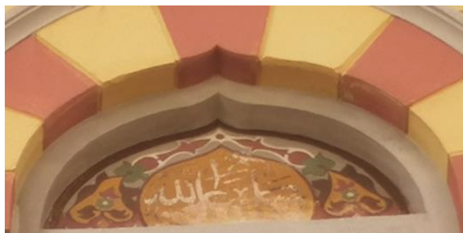
Fotografija 5 i 6: Detalj, natpis na pročelju Turske kuće, 1906.