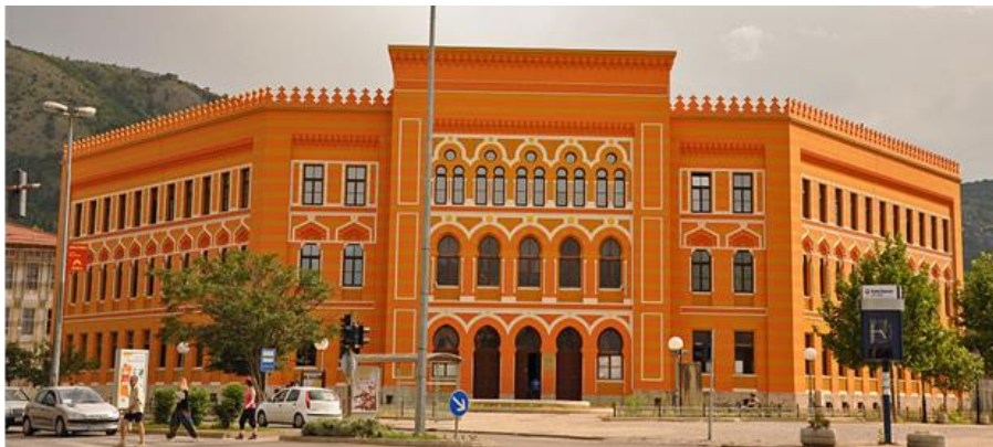
Fotografija 15: Gimnazija, Mostar, 1898. – 1902.