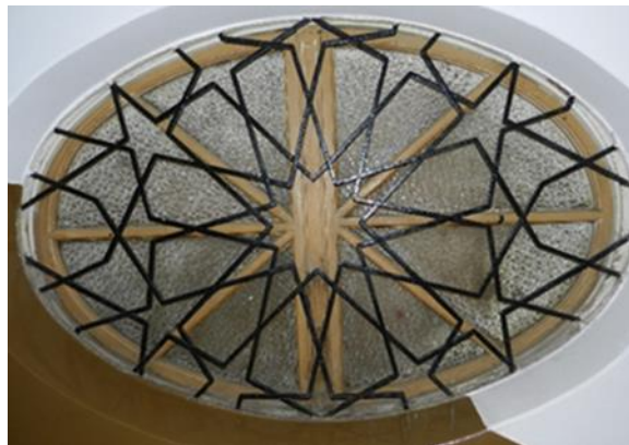
Fotografija 11: Rešetka, Casa Turca, Rijeka

Ono što ove dvije značajke čini važnima za riječku građevinu jest to što se u Rijeci iznad ulaznih vrata u samu zgradu nalazi rešetka od kovanog željeza koja ima identičan oblik ispunjen zvijezdama i linijama koje ih međusobno povezuju. Takav motiv u kovanom željezu se pojavljuje i na unutarnjim prozorima uz stubište te na vratima u prizemlju.