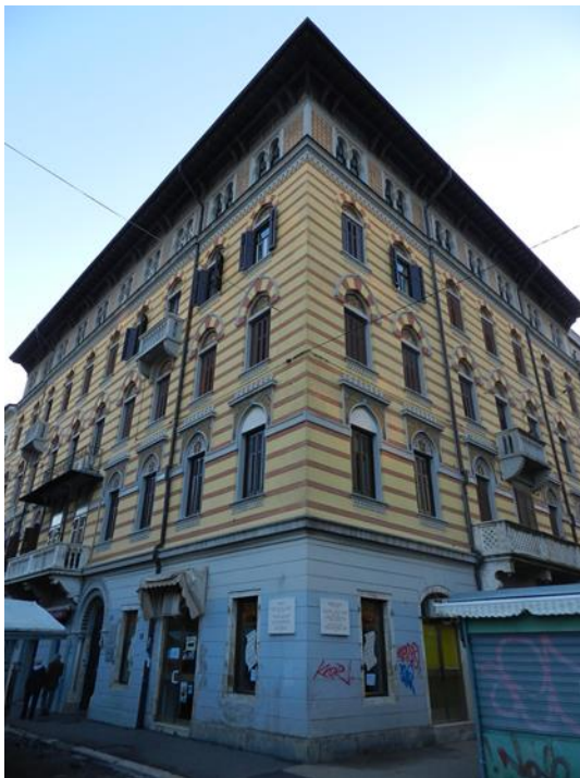
Fotografija 1: Turska kuća, Rijeka, 1906.

Carlo Conighi bio je arhitekt koji je radio na području Rijeke i okolice. Završava Politehniku u Münchenu 1875. godine. 11 Stvarao je u razdoblju historicizma i secesije te mu stoga i arhitektonski stil varira između ta dva različita izričaja. Pri projektiranju Turske kuće kombinirao je oba „stila“, pa na građevini dominira dekoracija neomaurskog stila koji pripada historicizmu, ali su vidljiva i obilježja secesije, ponajviše uočljiva na likovima unutar luneta. Ime Carla Conighia kao arhitekta stoji uz brojne građevine na području Rijeke i okolice, a neke od njih su i Palača Miculinich-Richtmann, nekadašnja sinagoga, Palača Schiucca-Matcovich.