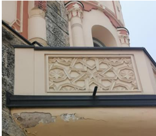
Fotografija 10: Balkon, Gradska vijećnica, Novi Grad

Druga značajka koja se pojavljuje na ovoj građevini, a može se povezati s Rijekom, jest reljefni ukras balkona erkera. Taj reljef također ima oblik rešetke sačinjene od zvijezda i linija koje se protežu iz jednih zvijezda u druge. Ovaj reljef i njegova rešetka sačinjena od zvijezda u manjim su dimenzijama od oslikanog stropa, ali ponavlja ideju već predstavljenu na oslikanom stropu glavne prostorije.