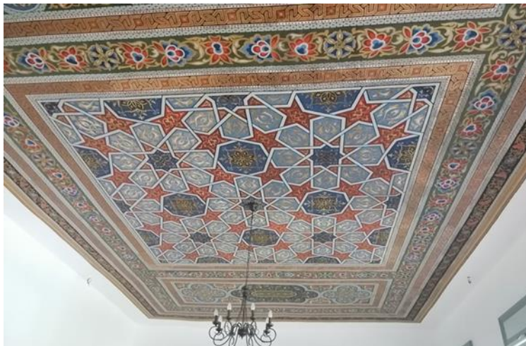
Fotografija 9: Strop glavne prostorije, Gradska vijećnica, Novi Grad

Iako nema upečatljivo pročelje razrađeno crvenim i žutim linijama boja, dvije značajke ovoga zdanja, koje su po osnovnim motivima jednake, mogu se povezati s riječkom Turskom kućom. Oslikani strop glavne prostorije prožet je ornamentalnom dekoracijom, a središnji dio istaknutim čini slikana rešetka sačinjena od zvijezda koje su također ispunjene ornamentalnom dekoracijom. Dekoracija koja ispunjava prostor oko te oslikane rešetke i ona unutar nje identične su te je stoga cijeli oslik upotpunjena cjelina. Glavninu cijelog oslikanog stropa čine biljni i geometrijski motivi te korištenje različitih i žarkih boja.