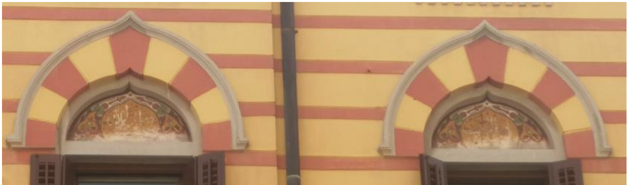
Fotografija 16: oštećenja oslika, Casa Turca u Rijeci, 1906.

Važno je uzeti u obzir mogućnost bržeg propadanja te učiniti sve što se može kako bi se taj proces usporio. Također je važno napraviti dobru foto-dokumentaciju kako bi slike ostale zabilježene dugovječno u digitaliziranom obliku. Na taj se način može očuvati sjećanje na umjetničko djelo koje je sklonije propadanju od nekih drugih. To naravno nije konačno rješenje, ali se treba poduzeti sve što se može kako bi zdanje ostavilo neizbrisiv trag u sjećanju i kako bi moglo biti detaljnije proučeno i obrađeno kada tehnologija bude to dopuštala i omogućavala.