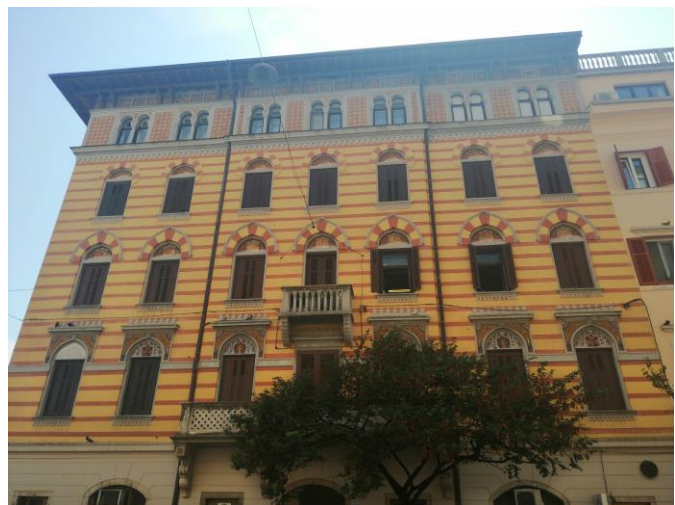
Fotografija 2: Turska kuća, pročelje koje gleda na Verdijevu ulicu, 1906.