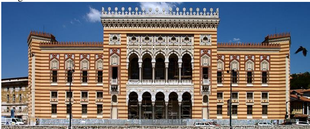
Fotografija 14: Gradska vijećnica, Sarajevo, 1896.

Sarajevsku vijećnicu odlikuje bogatija dekoracija arhitektonskim elementima i dekoracija unutrašnjosti. Koristilo se puno više boje u dekoraciji interijera te se tako dobiva puno jači doživljaj maurskog stila. To nije iznenađujuće budući da se građevina nalazi u gradu koji ima povijest gradnje s islamskim dekorativnim i građevinskim elementima te su arhitekti mogli skupljati izvore i iz bliskog okružja. „Zbog određene sličnosti lokalnog i novog arhitektonskog rječnika prijem nove arhitekture nije bio izrazito kontrastan kao na Zapadu.“ 44 Može se pretpostaviti da je građevina u Sarajevu izazvala puno manje iznenađenja nego li građevina u Rijeci, jer je stanovništvo već naviklo na takve oblike arhitekture. Riječka građevina priča drugačiju priču jer se nalazi unutar drugačijega konteksta. Riječka Turska kuća u sebi nosi priču o drugačijoj kulturi, poučava prolaznike i promatrače o novim stvarima, dok Sarajevska vijećnica uči o varijacijama na temu. To nikako ne umanjuje arhitektonsku, kulturnu i umjetničku važnost vijećnice, ona je i dalje jedan izuzetno važan spomenik Austro-Ugarske gradnje na području Bosne i Hercegovine.