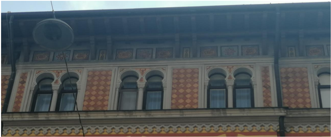
Fotografija 8: detalj potkrovlja, Casa Turca u Rijeci, 1906.

vlasnika u varijanti Nikolaki te ime vlasnika u varijanti Nikolaki efendija Nikolaides. 39 Tugra je kaligrafski amblem, a koristi se kao sultanov znak. 40 Potkrovlje koje gleda na ulicu Vatroslava Lisinskog nosi 30 natpisa. Pojavljuju se varijante Nikolakijeva imena, tugra sultana te lunarne godine, no ovdje se pojavljuje i fraza, koja je već viđena na nekoliko luneta, a glasi „Ne ureklo se!“. 41 Ovdje se može vidjeti odmak od natpisa viđenih na dijelovima ispod potkrovlja, ali se ti natpisi ne smiju gledati različito od cjeline. Vjerojatno su smješteni u potkrovnju traku kako bi zaokružili cjelokupni program i kako bi promatračima i posjetiteljima pružili širi kontekst nastanka i kulture koju prenosi.