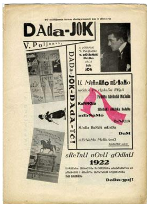
Slika 6.: Naslovnica časopisa br. 1. Dada- Jok, maj, 1922.