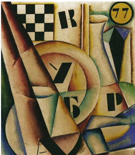
Slika 6.: Mihailo S. Petrov, Kompozicija 77, 1924. gvaš na papiru, 31 x 23,5 cm, Muzej savremene umetnosti, Beograd