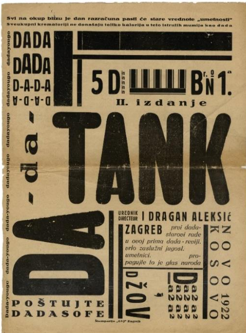
Slika 5.: Naslovnica časopisa Dada Tank, 1922., 319 x 237 mm