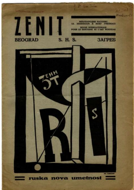
Slika 4.: El Lissitzky, rješenje za naslovnicu časopisa Zenit, 1922