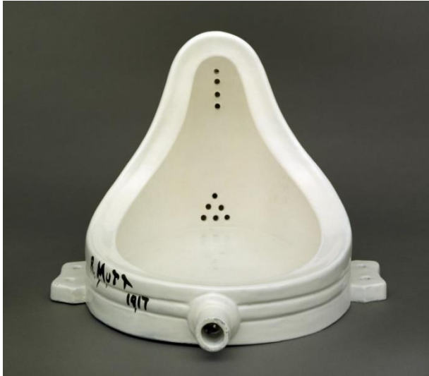
Slika 1.: Marcel Duchamp, Fontana, 1917.–1917., keramika, 360 x 480 x 610 mm, Tate Museum, London