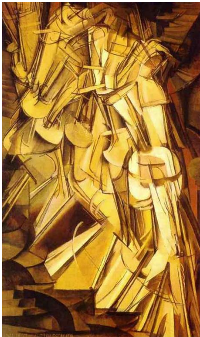
Slika 2.: Marcel Duchamp, Akt silazi niz stepenice br. 2., 1912., ulje na platnu, 147 cm x 89.2 cm, Philadelphia Museum of Art, Philadelphia; Preuzeto: http://allart.biz/photos/image/Marcel_Duchamp_1_Nude_Descending_a_Staircase_No_2.html