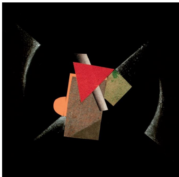
Slika 7.: Josip Seissel/ Jo Klek, Pafama, 1922. kolaž; pastela, papir, 17 x 17 cm, Muzej suvremene umjetnosti, Zagreb