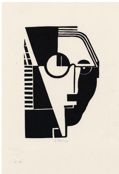
Slika 8.: Avgust Černigoj, Srečko Kosovel, 1926., linorez, 41, 9 x 29, 8 cm, Umetnostna galerija Maribor, Preuzeto: https://museu.ms/museum/details/2/maribor-art-gallery