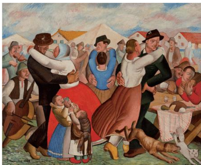
Slika 9.: Krsto Hegedušić (grupa Zemlja), Proštenje u mojem selu, 1927., ulje na platnu, 50 x 61 cm, Moderna galerija, Zagreb, Preuzeto: http://www.matica.hr/hr/362/retrospektiva-krste-hegedusica-u-galeriji-adris-u-rovinju-21168/