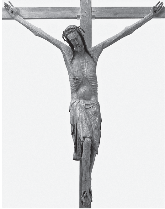
2. Drveno raspelo iz Rogova, 14. st.

kojima su građena ikonografska načela i svako nalaže zahtjevan pristup 'čitanju' prikaza. 12 Pritom je iznimno važan kontekst i djela i 'slike', koji nije nimalo jednostavan (kako se to može činiti), već otvara slojeve poruka i značenja koji se ne mogu svesti pod pravocrtni razvoj ikonografske tipologije. Tako poznajemo primjere koji odskaču od uobičajenih ikonografskih shema, poput stranice Sakramentarija iz opatije Gellone s kraja 8. stoljeća (sl. 3.), 13 koji na početnom slovu Te igitura pokazuje razapetog Krista, pobjednika, otvorenih očiju, ali s istaknutim ranama na rukama, nogama i boku iz kojih izbija krv – neuobičajen ekspresivni element za to vrijeme, koji upućuje na naglasak na tjelesnoj patnji i smrti na križu. Sagledan u povijesnom kontekstu, ovaj je prikaz dio cjeline (sakramentarija) koja je u nastojanjima Pipina Malog da stvori jedinstven liturgijski jezik povezala rimsku i galsku tradiciju u novome ritusu koji između Sanctusa i Te igitura uvodi pauzu materijaliziranu slikom Razapetog. Ta će promjena u molitvenoj praksi stvoriti prostor (najprije u rukopisima) za izdvojen i naglašen