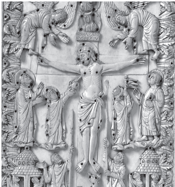
4. Bjelokosna korica rukopisa iz Metza, 9. st., Victoria i Albert muzej, London, detalj

prikaz raspeća, kojemu se sada posvećuje cijela stranica. 14 Prikaz krvarećih Kristovih rana nije invencija zrelog srednjeg vijeka, on se pojavljuje u ranijem periodu i upućuje na dvojnost događaja: trijumf Božjega Sina i patnju inkarniranoga Boga, o čemu svjedočanstva postoje u nizu radova u bjelokosti ili iluminacija u rukopisima. Između ostalih, treba naglasiti i motiv skupljanja krvi iz rane na boku koji se pojavljuje već u 9. stoljeću u vidu personifikacije Crkve koja skuplja krv u kalež – kao na primjeru bjelokosti iz Berlina iz 9 st., Drogovu sakramentariju (Paris, BNL, MS lat. 9428, fol. 43v), bjelokosnim koricama evanđelistara Henrika II. koje datiraju u 9. st. (Bayerische Staatsbibliothek, München) 15 ili bjelokosnim koricama iz Metza iz druge polovice 9. stoljeća (sl. 4.) 16 i drugo.