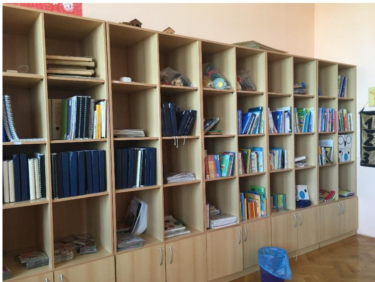
Slika 2.: Police s knjigama na brajici