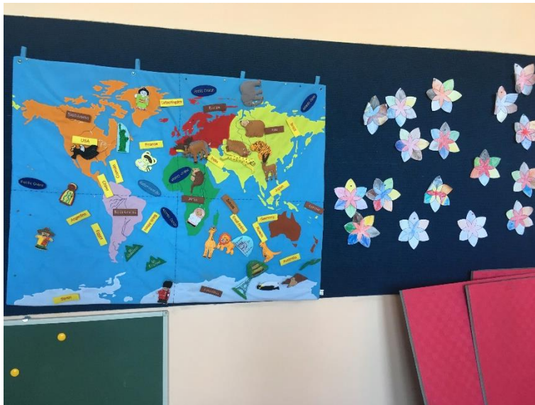
Slika 4.: Taktilna geografska karta