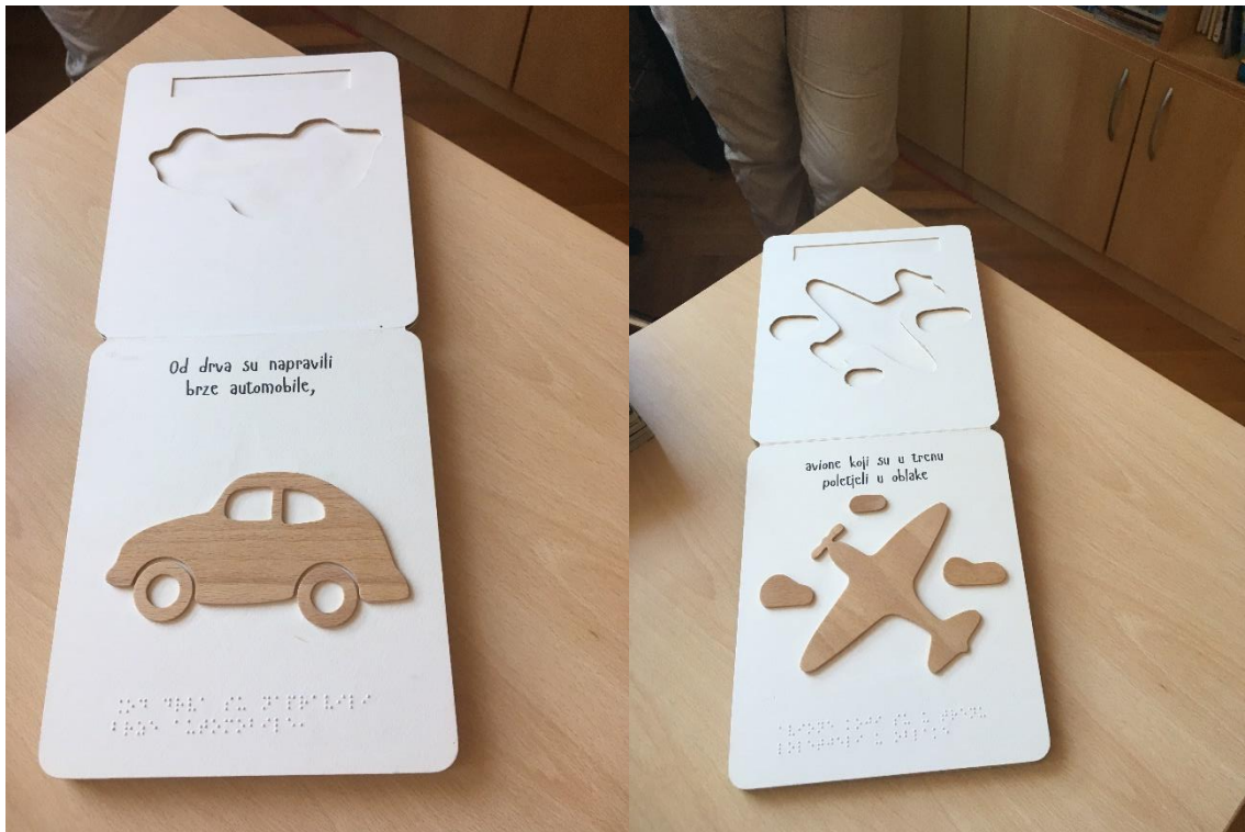
Br. 2.: Taktilna slikovnica „Dva života jednog drva“