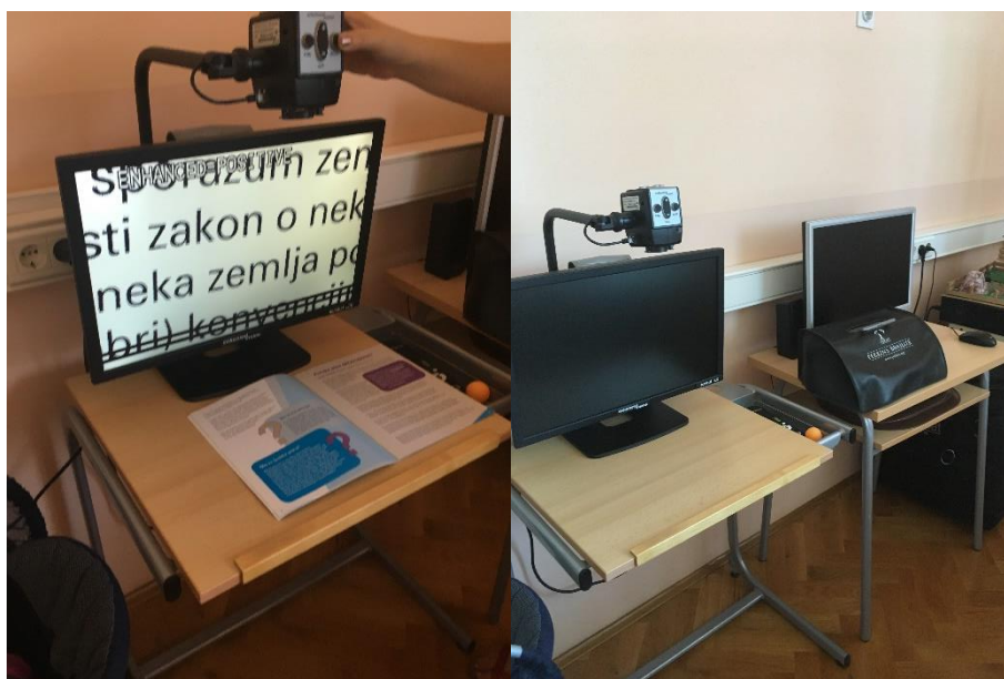
Slika 8./9.: Elektronično povečalo Acrobat enhanced vision