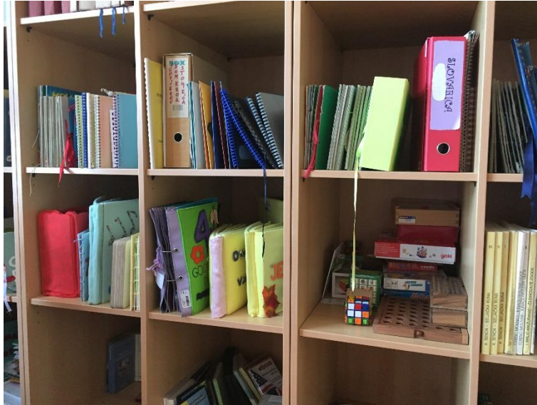
Slika 5.: Police s taktilnim slikovnicama