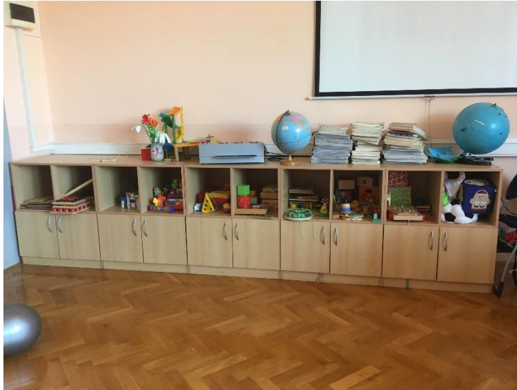
Slika 3.: Ormarići s taktilnim igračkama