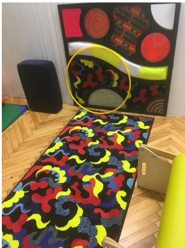
Slika 12.: Senzorna soba II