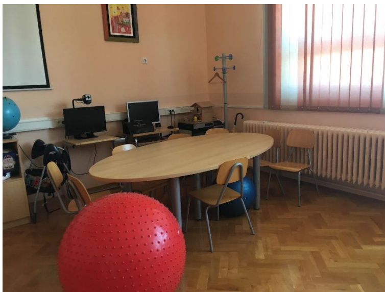
Slika 7.: Kutak za rad i čitanje