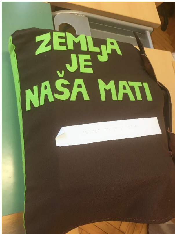
Prilog 3.: Taktilna slikovnica „Zemlja je naša mati“ (audio – vizualni zapis)

U Prilogu 3. nalazi se audio - vizualni zapis u kojem se može vidjeti kako izgleda taktilna slikovnica koja je napravljena prema gore navedenim smjernicama i koja će biti promovirana na Međunarodnom natjecanju na području Taktilne slikovnice za slijepu i slabovidnu djecu 2019.