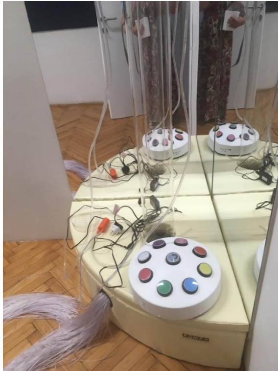
Slika 14.: Standardna oprema senzorne sobe „Bubble tube“