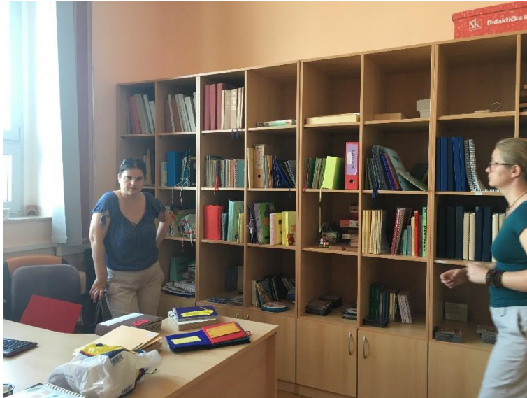
Slika 1.: Radni dogovor djelatnica Prve dječje knjižnice za djecu oštećena vida

Slijede slikovni zapisi koji predstavljaju prostor, opremu te svakodnevicu Prve dječje knjižnice za djecu oštećena vida.