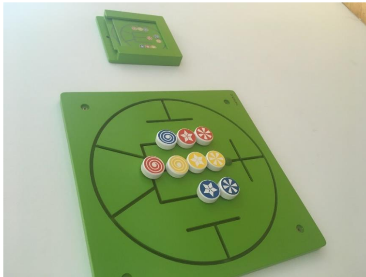
Slika 16.: Senzorna igračka „Ida didacta“