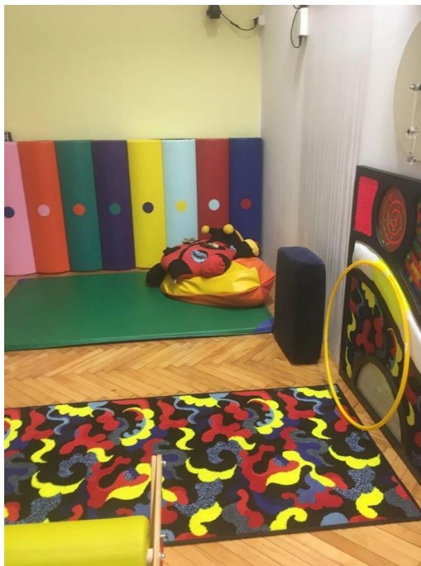
Slika 11.: Senzorna soba I

Slijede slikovni zapisi o navedenim programima Odjela za oštećenje vida, odnosno prostora i njihovih pomagala u radu.