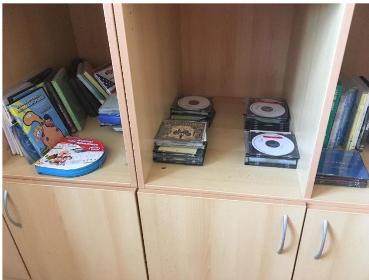
Slika 6.: Police s audio knjigama