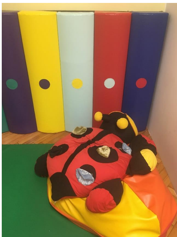
Slika 13.: Senzorna soba III