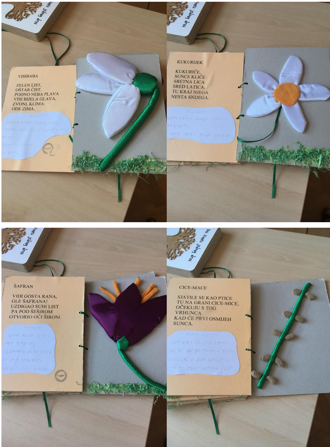
Br. 1.: Taktilna slikovnica „Vjesnici proljeća“

U Prilogu 2. kao slikovne primjere navode se dvije taktilne slikovnice: „Vjesnici proljeća“ i „Dva života jednog drva“.