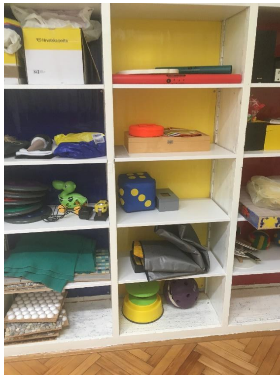
Slika 15.: Police sa senzornim igračkama