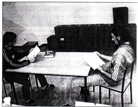
Knjiga sve omiljenija među zatvorenicima