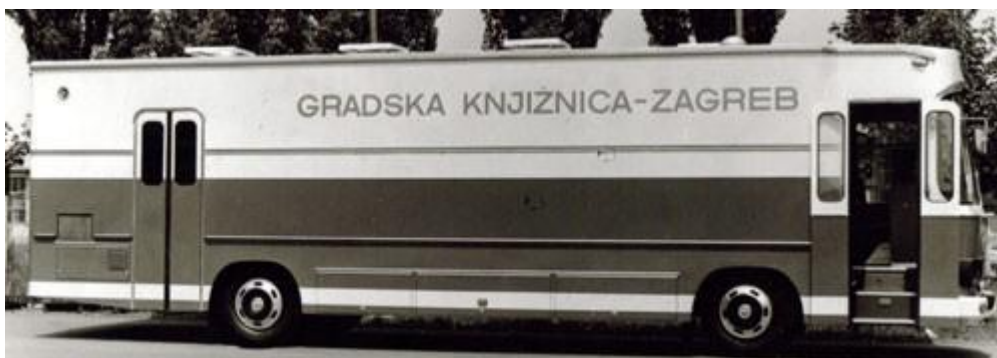
Slika 3. Prvi zagrebački bibliobus.

Sredinom 1980-ih godina bibliobusne su službe doživjele vrhunac svog razvoja. Prema rezultatima ankete koju je 1986. godine provela Sekcija za narodne knjižnice Hrvatskog knjižničarskog društva, krajem 1985. godine djelovalo je 17 vozila na području Hrvatske.