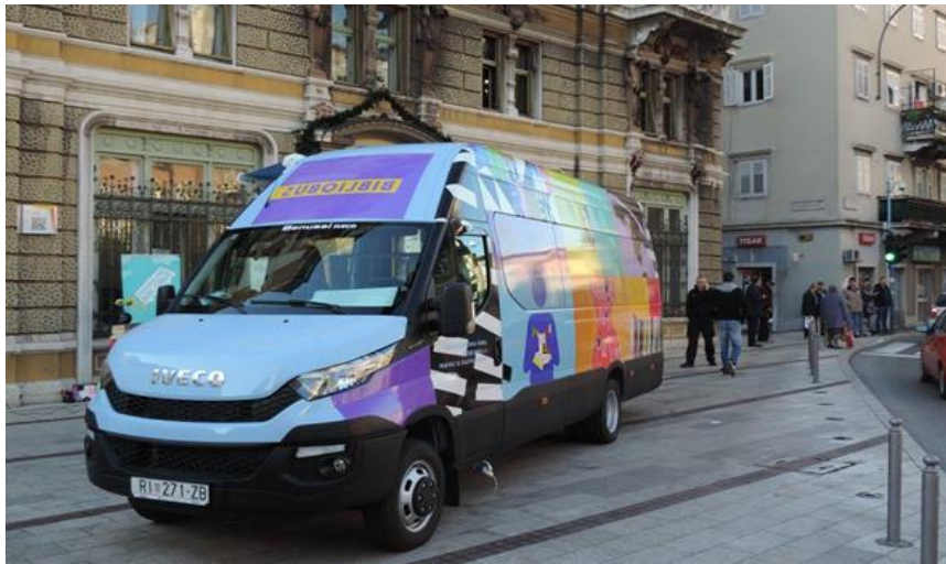
Slika 5. Gradski bibliobus u Rijeci. 31

S obzirom na potrebu pružanja knjižnične usluge u svim mjestima županije koja nemaju druge oblike djelatnosti narodne knjižnice, Gradska knjižnica Rijeka osmislila je projekt bibliobusne službe Primorsko-goranske županije za područje Gorskog kotara i drugih brdsko - planinskih dijelova tog prostora. Partnerski projekt Gradske knjižnice Rijeka i Primorsko-goranske županije prepoznalo je i Ministarstvo kulture, koje je 2004. godine sufinanciralo nabavu novog Županijskog bibliobusa. 32 Osnovne značajke navedenog bibliobusa su sljedeće: