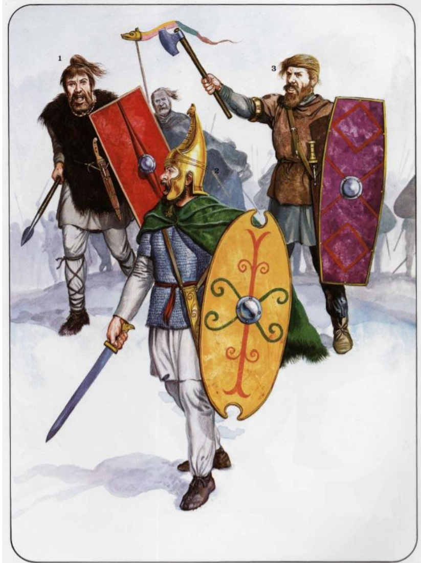
Slika 1 – Markomani i Kvadi, 1.-2. st. Preuzeto iz Peter Wilcox, Rafael Treviño 2002. Barbarians Against Rome , str. 31.