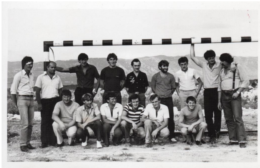
Prilog 2. Nogometni susret na Krku

Navedenome u prilog idu i sljedeće dvije fotografije koje prikazuju radni kolektiv 3.MAJ-a na nogometnom susretu: