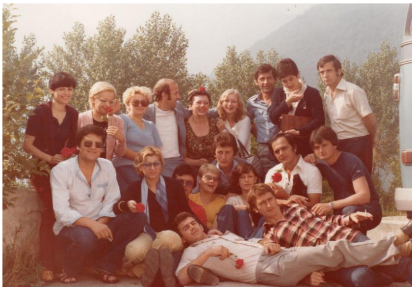
Prilog 4. Kolektivni izlet radnika 3.MAJ u Jajce, BIH

Jedno od posjećenih odredišta bila je i Kozara, o čemu svjedoči priložena fotografija: