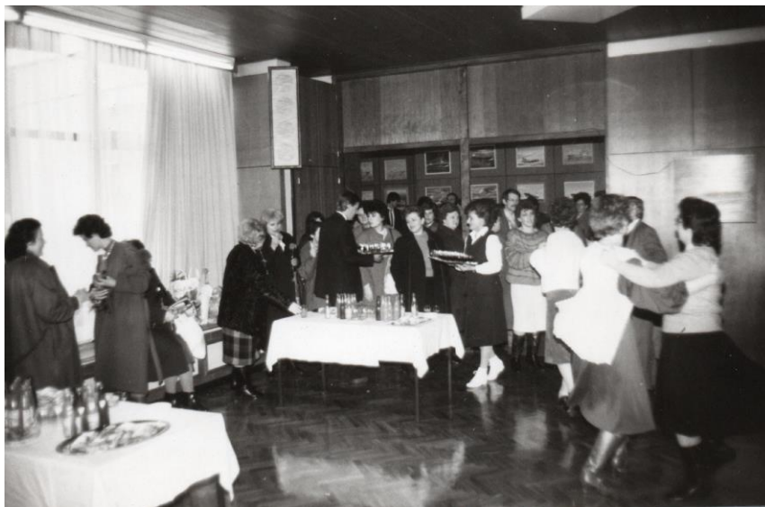
Prilog 6: Proslava Dana žena u Sindikalnom domu 3.MAJ na Mlaci 1986. godine

Za razliku od njih, neke bi pripadnice radnog kolektiva pak u vlastitoj organizaciji okupile svoje društvo te proslavile svoj dan na nekom mjestu po njihovom izboru gdje bi onda pozvale i ostatak izabranog dijela radnog kolektiva. Ženama se u čast povodom Dana žena posvećivao i tekući broj Informacija , što konkretno susrećem u broju 9 iz 1989. godine, gdje pod naslovom “ Ženama u čast ” stoji članak koji, ne samo hvali žene, već se zauzima i za njihovu ravnopravnosti: “ Ravnopravnost je lijepa riječ, ali sve žene još uvijek nisu ravnopravne. Nauka je dokazala da je žena biološki jače biće, a historija potvrdila da su žene utjecale na tokove historije. ” (Informacije, s.n., 1989:3). No, osim toga ističe se i njihova važnost u brodogradilištu: “ Ovaj je dan posvećen svim ženama. I zato treba naći trenutak da se u ovoj ludi trci malo zastane, na trenutak, da im se prizna njihov doprinos. Bez izuzetka. ” (s.n. u Informacije, 1989:3).