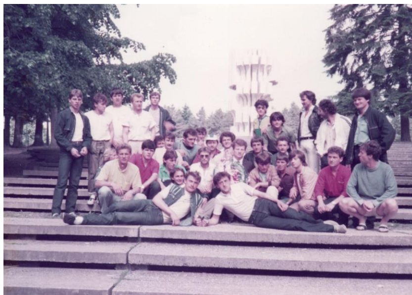
Prilog 5: Kolektivni izlet radnika 3.MAJ na Kozara Mrakovica

Jedno od posjećenih odredišta bila je i Kozara, o čemu svjedoči priložena fotografija: