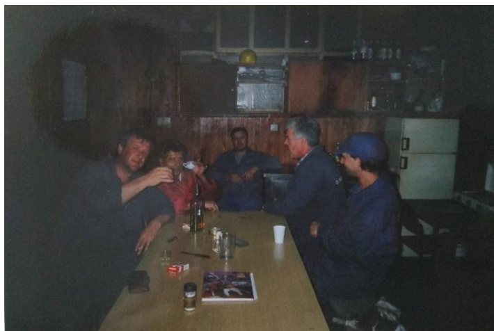
Prilog 7. Dan porinuća u jednoj od radničkih koliba

S obzirom da je u 3. MAJ-u radio, uz jedan kraći prekid, gotovo 25 godina, mogu reći da sam kroz njega djelomično i ja proživljavala kako je to biti trećemajac ili barem dijete trećemajca. Moj otac bi tako nakon svakog njegovog rođendana, pa čak i rođendana majke, brata ili mene, odnesao koji komad torte, kolača, pa i nareska da počasti kolege iz svoje “kolibe”. Za svečanije se prigode nosila i boca žestice, a za kolektivne proslave, znalo se na poslu ostati i duže pa bi se unutar koliba pripremio i kakav bolji ručak. Točno se znalo kada je čiji rođendan i koji dan će netko častiti. Tom se prigodom znalo doći i ranije na posao ako je bilo potrebno, kako bi u miru popili kavu i razmijenili doživljaje.