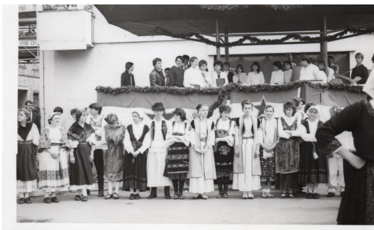
Prilog 1. Nastup KUD-a na „Štafeti mladosti“ 1985. godine

O navedenome svjedoči i ova priložena fotografija koja prikazuje nastup RKUD-a Brodograditelj na manifestaciji „Štafeta mladosti“ 1985. godine. Ovdje se, dakle, već nazire još jedna važna funkcija dokolice trećemajskih radnika ili općenito radnika u SFRJ, a radi se o podizanju nacionalne svijesti i promoviranju socijalističkih ideja, na što ću se vratiti nešto kasnije kada ću ovaj aspekt detaljnije izložiti.