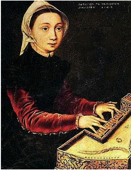
Slika 4. Caterina van Hemessen, Djevojka svira virginal, 1548., 30.5 x 24 cm, Wallraf-Richartz-Museum

naznake prostora, osim u autoportretu i portretu sestre. Djevojka svira virginal (vidi Slika 4 ) portret je na kojem je prikazala svoju sestru kako svira.