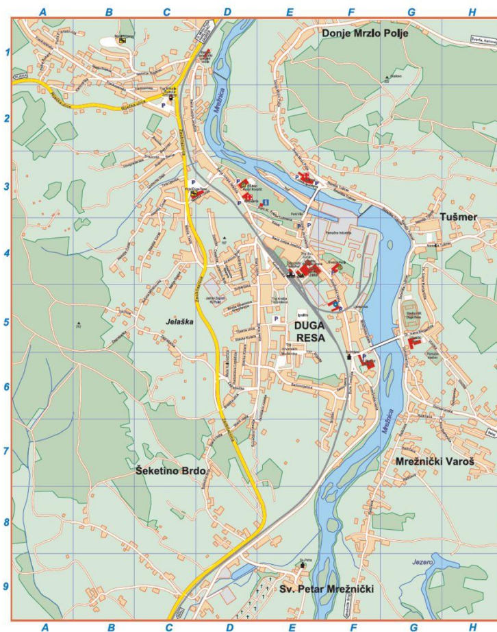
Slika 2. Plan grada Duge Rese i njezine okolice (URL 2)

Iako se ne zna koliko je Duga Resa stara, ovaj kraj sadrži arheološke nalaze naseljenosti još od prapovijesnoga doba. Naime, arheološkim iskopavanjima istočno od grada Duge Rese utvrđeno je da se ovdje živjelo u kasnom brončanom i početkom željeznoga doba, odnosno u posljednjim stoljećima 2. i počecima 1. tisućljeća prije Krista. Ono što se pouzdano može reći jest to da su ovo područje nastanjivali Rimljani što i potvrđuju tragovi 3 iz tih vremena, a pronađeni su na lokalitetu Sveti Petar, naselju nedaleko grada Duge Rese (Šišler 2004: 567).