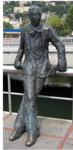
Slika 2: Spomenik Janka Polića Kamova na mostu iznad Rječine, rad kipara Zvonimira Kamenara