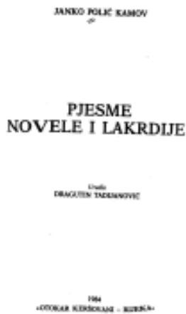
Slika 3: Naslovna stranica „Pjesme, novele i lakrdije“ u: Sabrana djela Janka Polića Kamova