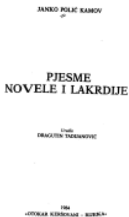
Slika 3: Naslovna stranica „Pjesme, novele i lakrdije“ u: Sabrana djela Janka Polića Kamova