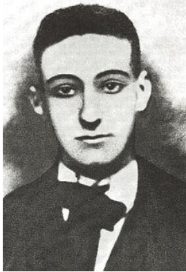
Slika 1: Janko Polić Kamov