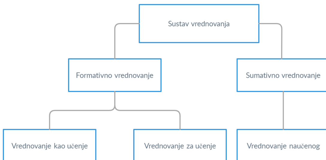
Slika 1. Sustav vrednovanja

U Ujedinjenom Kraljevstvu i SAD-u provedena su brojna istraživanja o unaprjeđenju formativnog vrednovanja, odnosno vrednovanja za učenje. Mnoga od njih spomenuta u ovom radu, objavljena su u časopisu Assessment in Education: Principles, Policy & Practice 1 . U hrvatski obrazovni sustav taj je koncept implementiran po uzoru na prakse u inozemstvu, stoga pristupi vrednovanje kao učenje, vrednovanje za učenje te vrednovanje naučenog i njihovi mogući modeli nisu dostatno teorijski razrađeni u hrvatskoj dokimološkoj literaturi. Osim toga, učinkovitost predloženog koncepta vrednovanja u hrvatskom školstvu nije ispitana, s obzirom na to da je Školom za život tek implementiran. Važno je napomenuti da ti pristupi vrednovanju podrazumijevaju mnoge metode vrednovanja koje su u nastavnoj praksi već poznate. Smještanjem tih metoda pod zajedničke nazivnike upotrebljavajući navedena tri termina, omogućeno je veće usmjerenje i poticaj na formativno vrednovanje i alternativne oblike vrednovanja, a to doprinosi osvješćivanju povezanosti procesa vrednovanja, učenja i poučavanja.