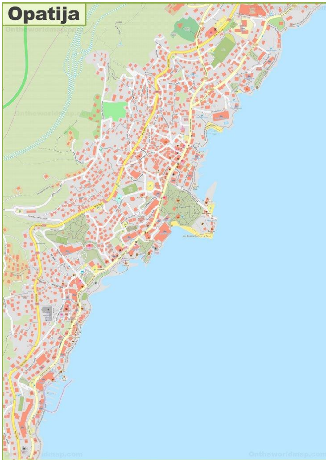
Abbildung 2: Karte des Erhebungsgebietes (Large detailed map of Opatija: 15.08.2020).