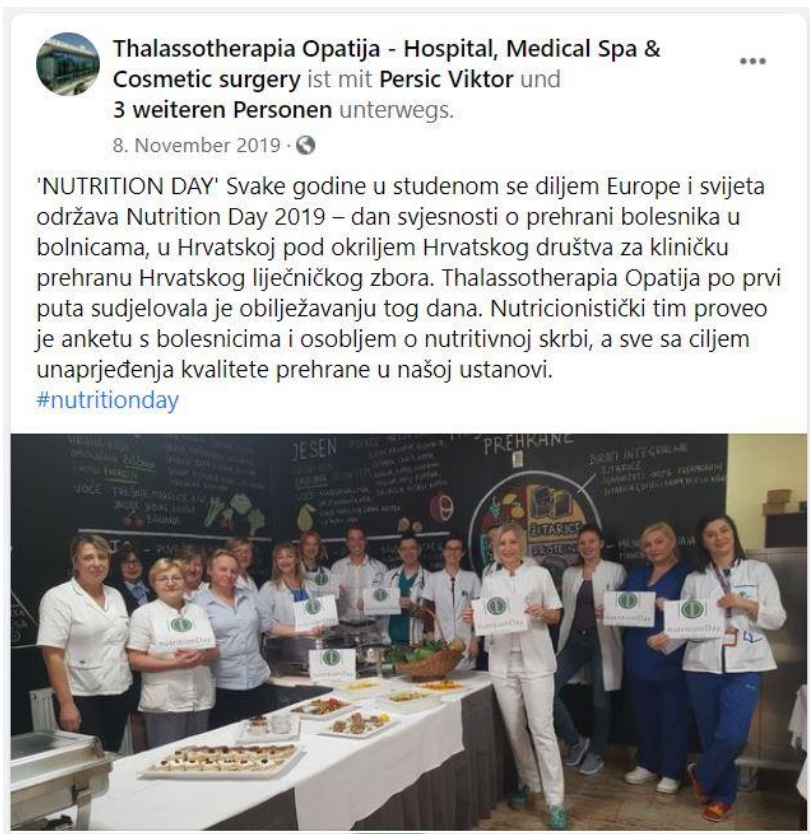
Abbild 2: Minimal komplementäre Inhaltsanordnung (Thalassotherapia Opatija - Hospital, Medical Spa & Cosmetic surgery: 15.08.2020)