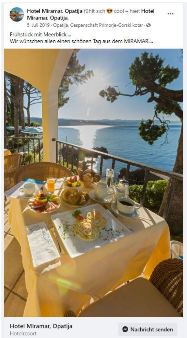
Abbild 5: Beitrag mit Kontakt- und impliziter Appellfunktion.