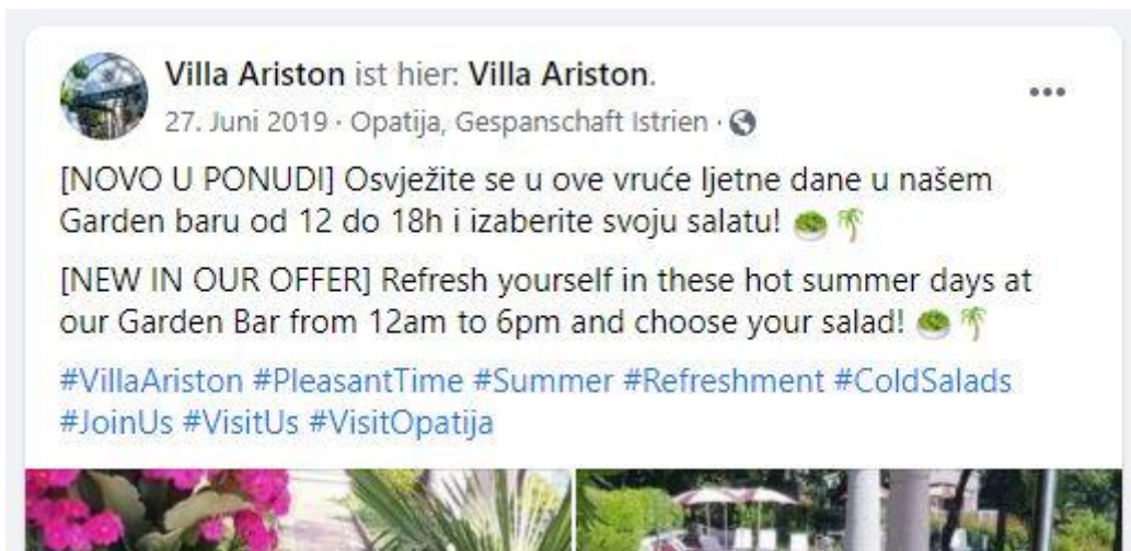
Abbild 3: Vollständige Übersetzung.