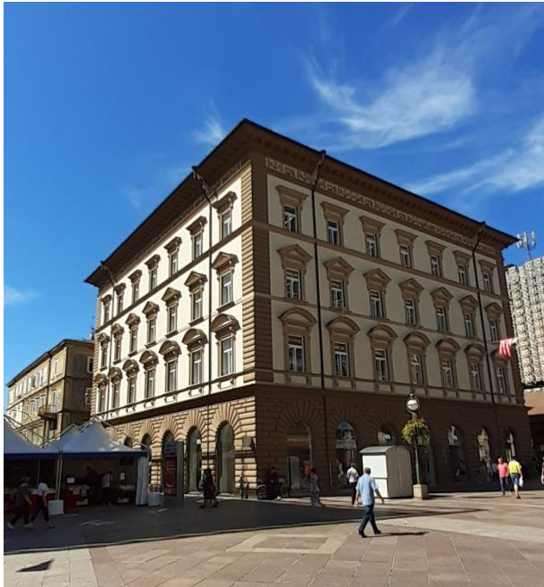
Slika 2: Zgrada bivšeg Kraljevskog ugarskog Ministarstva financija

Nakon obnove, koju je vodio arhitekt Saša Randić, 13 zgrada Pošte izvana je zadržala svoj izgled, dok je unutrašnjost pretrpjela znatne promjene.