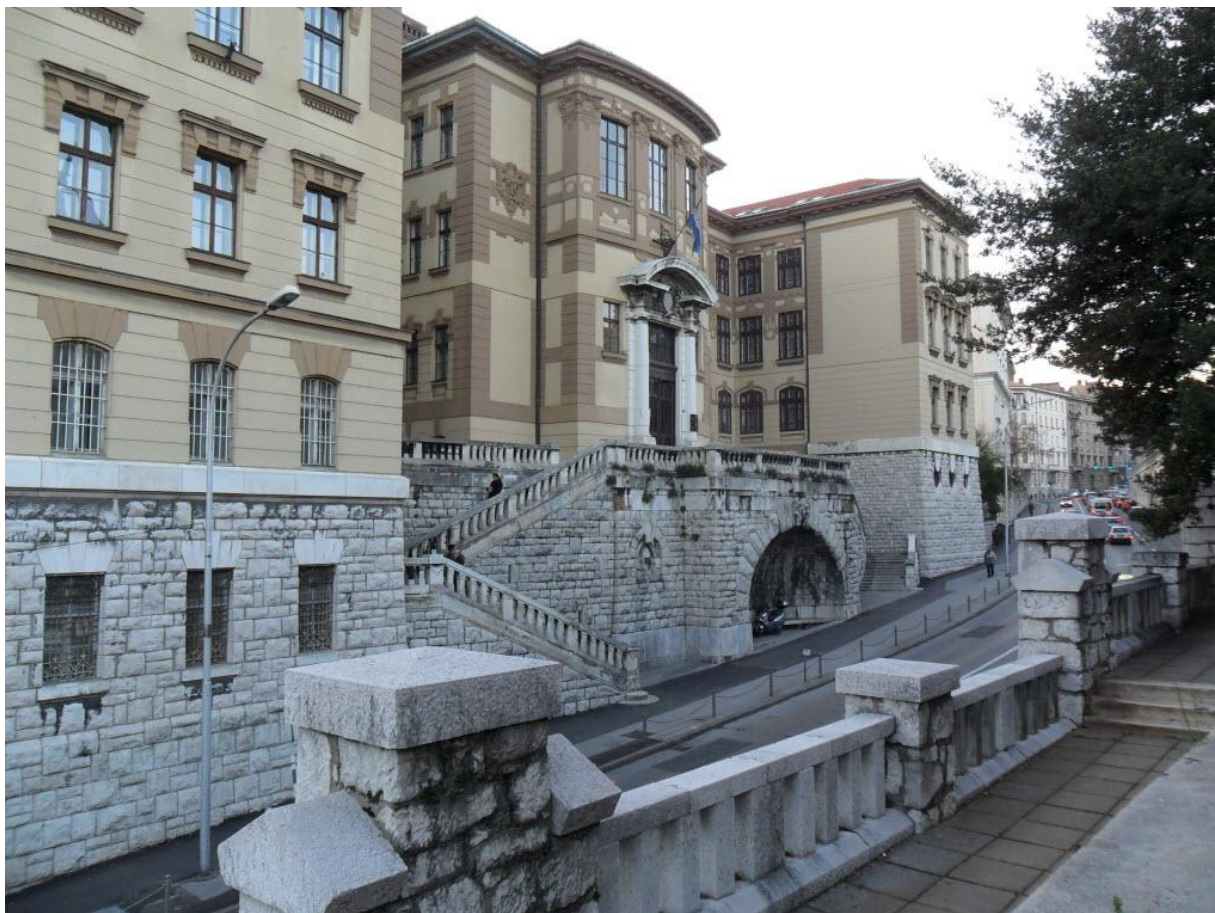
Slika 7: Sudbena palača

Druga veličanstvena zgrada koja je nastala za potrebe državnih službi u vremenu secesije, ako već ne u potpunosti i u secesijskom stilu, je Sudbena palača. Smještena iznad starog grada i svojim ulaznim pročeljem okrenuta strmoj ulici, doima se prevelikom za taj položaj. Zaslužan za ovaj projekt je budimpeštanski arhitekt Győző Czigler koji je u Rijeci već projektirao zgrade dviju škola na Dolcu. Pri projektiranju Sudbene palače Czigler slijedi historicističke zahtjeve za reprezentativnošću i monumentalnošću; secesijski elementi vidljivi su tek u trodijelnim prozorima i ukrasnim elementima fasade među njima. Upravo ju monumentalnost izdvaja iz tkiva grada te palača stoji u snažnoj opreci prema manjim zgradama i strmim uličicama iz njezinog neposrednog okruženja.