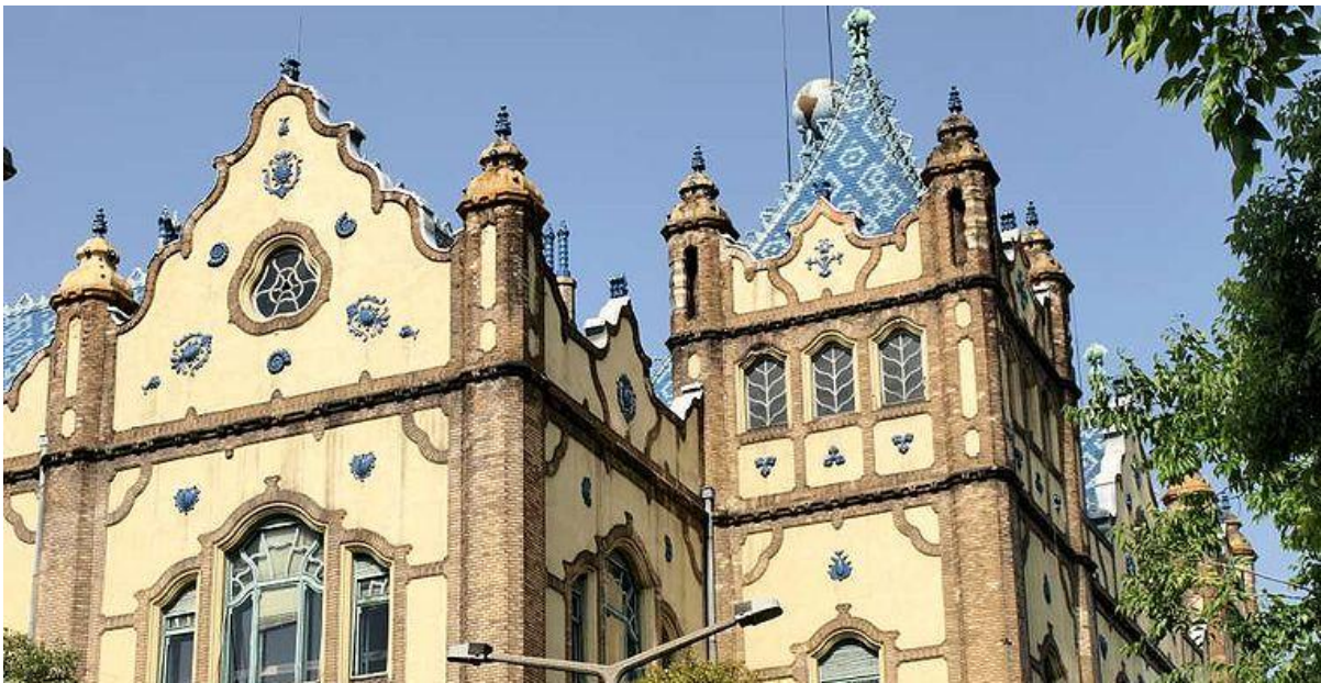
Slike 5 i 6: Zabati zgrade Mađarskih željeznica te zgrade Geološkog instituta u Budimpešti