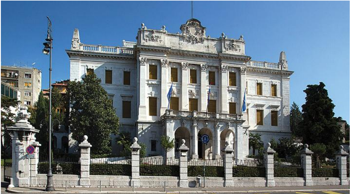
Slika 3: Guvernerova palača

atika s uokvirenim poljem koje danas stoji prazno a u kojem se nekada vjerojatno nalazio grb. Glavna je zgrada spojena s pomoćnim gospodarskim zgradama arkadnim galerijama.