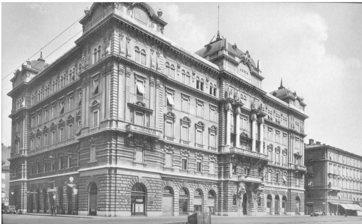
Slika 4: Palača Adria prije nadogradnja posljednjeg kata

dijelom južnog pročelja okrenutog moru. Kao što je to bio slučaj i s zgradom lučke uprave, na palaču Adria nadograđen je još jedan kat, smješten među kupole čime su one vizualno izgubile na svojoj visini. Oba duža pročelja – sjeverno okrenuto trgu i južno okrenuto moru – bogato su ukrašena plastikom: muškim hermama nad glavnim ulazom i slobodnostojećim figurama koje je izradio talijanski kipar Sebastiano Bonomi 16 te uobičajenim ukrasnim elementima koji su se jednostavno naručivali putem kataloga raznih proizvođača. Monumentalna kakva već jest, ova se građevina ogleda u vodi stvarajući veličanstven prizor za sve one koji pristižu s mora.