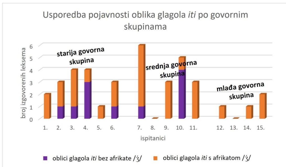
Grafikon 1. Usporedba pojavnosti oblika glagola *iti po govornim skupinama

Iz grafikona se može iščitati kako su oblici glagola iti bez afrikate /ʒ/ čuvaju u starijoj i srednjoj govornoj skupini iako je i ova značajka sklona gubljenju. Iako je potvrđena u mlađoj govornoj skupini, govornici je ovjeravaju u manjoj mjeri nego u ostalim dvjema skupinama.