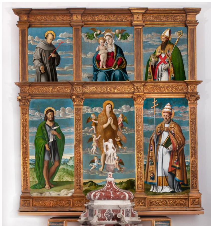
Slika 9. Sv. Marija Magdalena, sv. Ivan Krstitelj, sv. Grgur, Bogorodica s Djetetom, sv. Franjo, sv. Kvirin, 16. st., Franjevački samostan, Porat, Krk

Poliptih je smješten na glavnom oltaru sv. Marije Magdalene u franjevačkom samostanu u Portu na otoku Krku. Poliptih se povezuje s venecijanskom radionicom Girolama da Santacrocea.