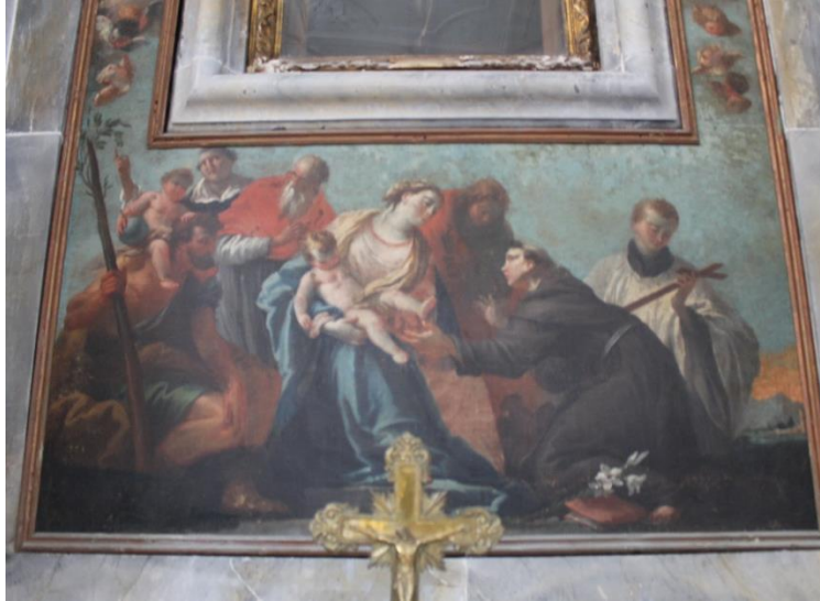
Slika 27. Bogorodica s Djetetom, sv. Kristoforom, sv. Vincenzom Ferrerijem, sv. Jeronimom, sv. Antunom Padovanskim, sv. Alojzijem Gonzagom i sv. Ivanom Evanđelistom, Gioanni Scajari, 18. st., crkva sv. Križa, Rab

Oltarna pala nalazi se na oltaru u crkvi sv. Križa u Rabu. Riječ je o pali portante, tj. oltarnoj slici koja je služila kao okvir „čudotvornom“ raspelu koje se nekada nalazilo u sredini oltara. Datira se u sedmo desetljeće 18. stoljeća i pripisuje se Giovanniju Scajariju. 86