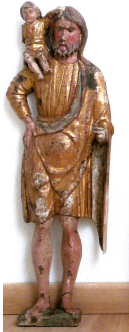
Slika 32. Triptih (sv. Kristofor, Bogorodica s Djetetom, sv. Sebastijan), druga polovica 15. st., župni ured, Beli, Cres

Danas se polikromirani drveni triptih nalazi u župnom uredu u Belom na otoku Cresu, a izvorno je bio smješten u kapeli Gospe Lurdske uz župnu crkvu Prikazanja Bogorodice u Hramu u Belom. Središnji reljef prikazuje Bogorodicu s Djetetom, a bočne figure prikazuju sv. Kristofora i sv. Sebastijana. 91