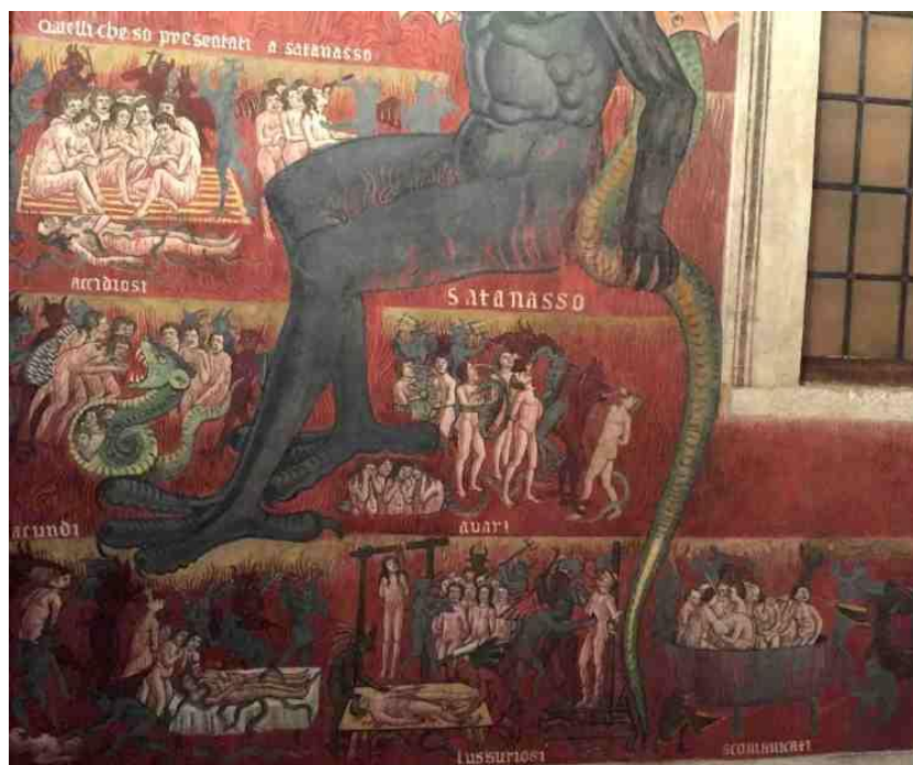
Antoniazzo Romano, Vizija pakla Franciske Rimske (detalj), 1468., freska, samostan Tor de' Specchi, Rim