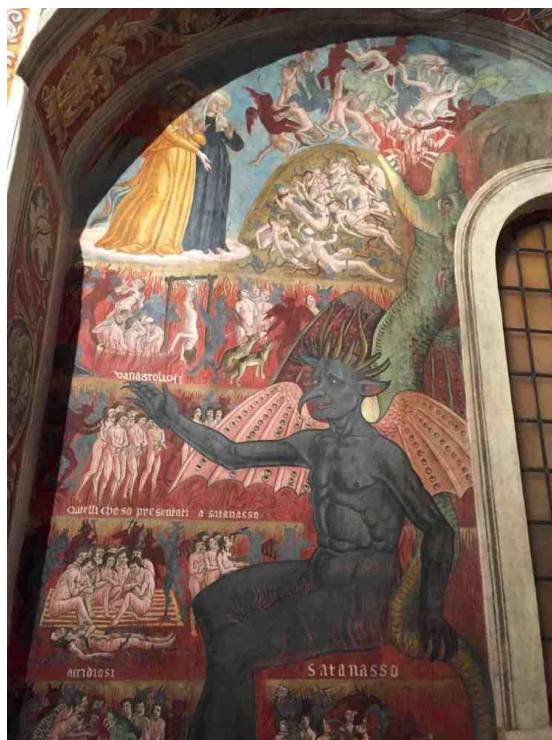
Antoniazzo Romano, Vizija pakla Franciske Rimske (detalj), 1468., freska, samostan Tor de' Specchi, Rim

ispunjenom tekućom smolom, sumporom, uljem i željezom 131 , a na njihovim licima vidi se iznimna bol i očaj zbog muka koje trpe na tome mjestu.