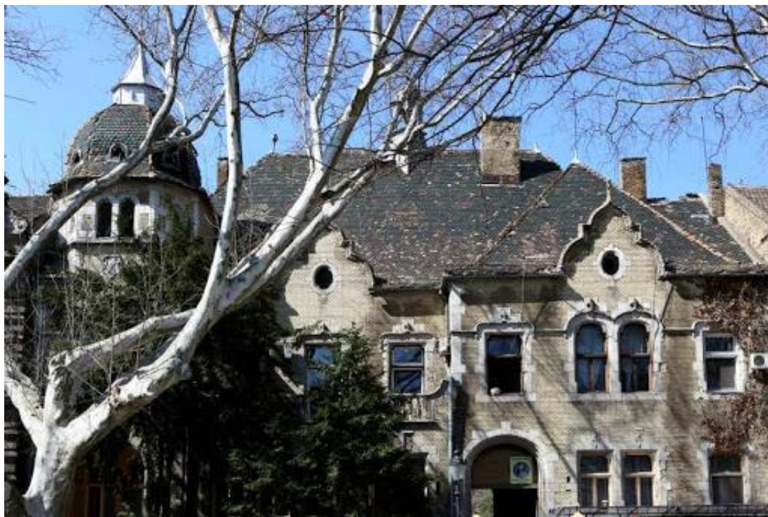
Slika 4: Palača Leović

Lechnerovo ostvarenje krči nove puteve arhitektonskom izrazu u trenutku kada se generacija arhitekata okreće budućnosti kroz pokret označen nazivima: Art nouveau, Jugend Stil itd. a kod nas odomaćenim terminom secesija. 11 Lechner pokušava uklopiti folklorne motive u izgled fasade, iako su u početku njegove građevine opterećene ornamentikom Istoka, istovremeno on gradi modernije oblike i skreće pažnju na funkciju objekta.