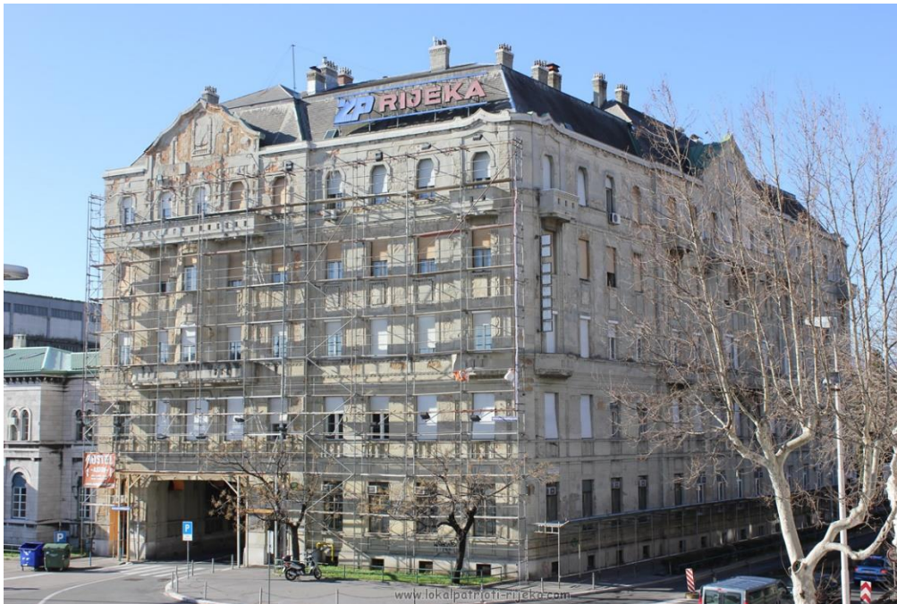
Slika 2: Zgrada državnih željeznica

Zgrada državnih željeznica je stambeno-poslovna palača u kojoj se nalaze uredi državnog poduzeća kao i stanovi činovništva. Nove državne ustanove koje gradi mađarska vlast izgrađene su u cilju smještaja mađarskog činovništva u državnim službama. Sandor Mezey, mađarski inženjer, izrađuje ovaj projekt. Izvodi ga privatno riječko poduzeće Farcas & Koch a nadzorni organ je Giuseppe Farcas. Problem se javlja zbog izbočenja pročelja zbog kojega je bilo teško uklopiti građevinu u već zadani prostor. Tehnički ured, međutim, ne traži prilagodbu niti korekciju projekta a još manje propituje pitanje stila. Utjecaj koji je Tehnički ured imao najveći je kad je u pitanju privatna stambena izgradnja a najmanji u slučaju građevina državne namjene. Zgrada državnih željeznica ima tlocrt u obliku slova L i na četiri je kata s dva valorizirana pročelja.