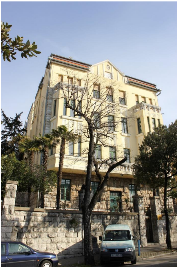
Slika 3: Kraljevski šumarski ured

Građevina je dovršena 1912. godine a podignuta je na donjem Boulevardu. Ima visoko prizemlje s tri kata te predstavlja jedinstveni primjer mađarske secesije na Sušaku. Južno pročelje koje je ujedno i ulično, organizirano je simetrično. Na prvom i drugom katu nalaze se erkeri, na trećem oni se otvaraju u balkone. Balkone krase ornamentalna dekoracija u obliku stiliziranih mađarskih folklornih elemenata. Specifične su i ukrasne ploče s motivima kvadrata upisanih jedan u drugi koji su tipična kasnosecesijska dekoracija. Figurativna plastika na pročelju s motivima šumske faune kao što su jeleni, sove i vjeverice ili na kapitelima gdje nalazimo vukove, lisice, lovačke pse i hrastovo lišće samo su neke od karakteristika koje upućuju na novi stil. Simboličnom karakterizacijom funkcije Šumarskog ureda prepoznatljivim životinjskim svijetom primorskog šumskog zaleđa, Lechner je postigao toplinu i ugođaj, čime se indirektno provukao i duh podneblja u tipično mađarski projekt s početka 20. stoljeća. 8