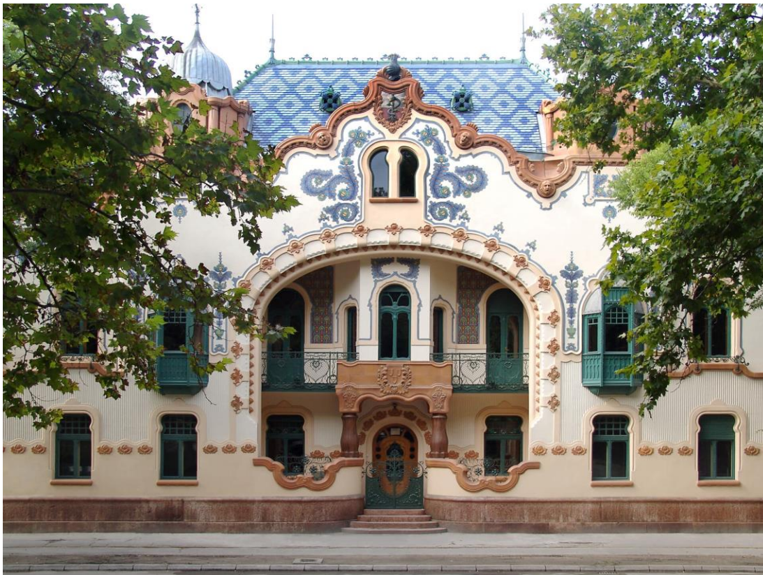
Slika 6: Rajhlova palača

U htijenju da se dopadne i nametne gledaocu, kazujući mu o bogatstvu i ukusu domaćina koji se njome ponosi, fasada se vezuje za duh graditeljske tradicije ovdašnjih sela. 14 Dva su razloga za gradnju ove palače, prvi je to da je arhitekt gradio svoj dom u dostojanstvenom izolacionizmu karakterističnom za zemljoposjednike, drugi razlog je inat i konkurencija. Rajhlova palača je od 1948. Gradski muzej a danas je Zgrada Likovnog susreta i ostaje središte umjetničkih događanja u gradu.