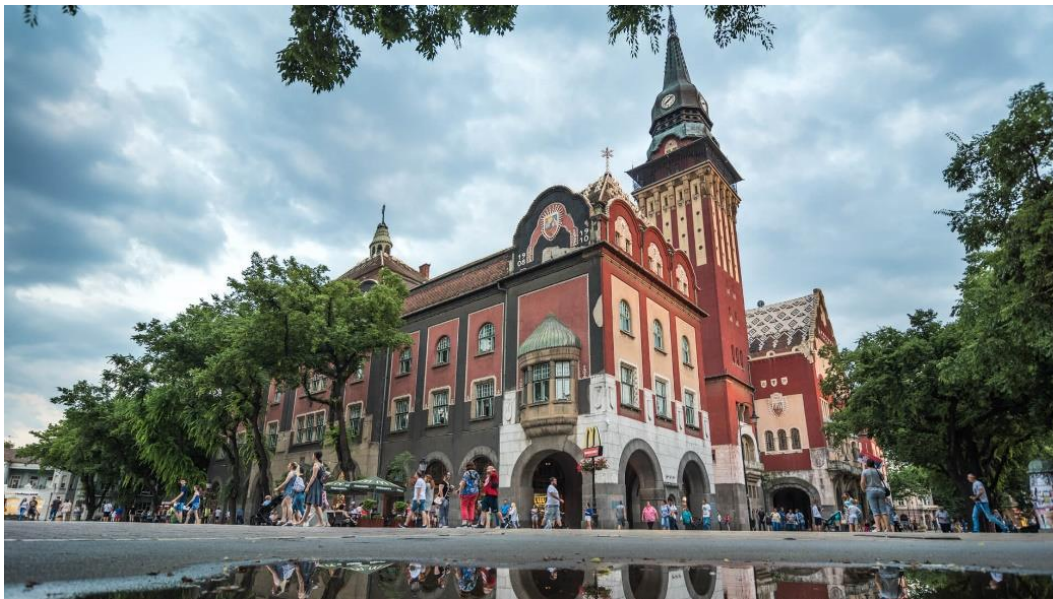
Slika 7: Gradska kuća

Subotička Gradska kuća spomenik je arhitekture secesije sa obilježjima mađarskog folklora i objekat funkcije kao premise moderne, nastupajuće, graditeljske djelatnosti. 15 Projekt su izradili poznati dvojac Jakab i Komor i on predstavlja sintezu arhitekture i umjetničkih zanata. Gradska kuća predstavlja maštovita i vizionarska viđenja Lechnera dok je s druge strane opčinjena funkcionalnošću. Konkurs je raspisan 1907. godine a osnovni kriterij žirija i razlog nastajanja je funkcija. Gradska kuća građena je od 1908. do 1910. godine, konačno je završena 1912. godine. Prvi je zakonom zaštićeni spomenik arhitekture secesije na ovom prostoru. Jakab i Komor su podijelili ovaj veliki zadatak. Komor projektira ovu građevinu kao funkcionalan objekt određene namjene, dok je Jakab zaslužan za izgled objekta i za sintezu arhitekture i umjetničkih zanata, sa stručnjacima tvornice Žolnai u Pečuhu kreirao je keramiku.