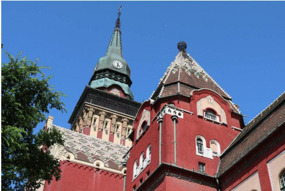
Slika 8: Gradska kuća s pogledom na vidikovac

Gradska kuća ima četiri ulaza. Centralni dio je reprezentativni dio objekta. Dekoracija se oslanja na riznicu mađarskog folklora, osnovni motiv je cvijet tulipan. Prizemlje je namijenjeno lokalima, zanatskim i trgovinskim radnjama. S tornja (vidikovca) vide se četiri unutarnja dvorišta koja pružaju dnevno svjetlo prostorijama u unutrašnjosti. Prstenasti hodnici okrenuti su k dvorištima, dok su uglovi građevine ojačani kulama. Ovo je jedna skladna kompozicija modelirana logikom funkcionalnog prostora. 16