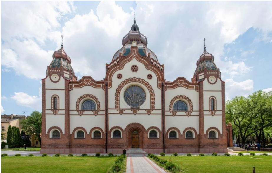
Slika 5: Sinagoga

Projektanti su inspirirani drevnom arhitekturom istoka a objekt je koncipiran kao Mojsijev šator. Sinagoga je skladan objekt s monumentalnim centralnim dijelom i tlocrtom upisanog križa. Kupola sinagoge je 25 m dok se vrh nalazi na 45 m s četiri manja ugaona tornja. U interijeru se nalazi 850 sjedala za muškarce i 550 za žene u galeriji. Prozori su ukrašeni vitrajima, koji su djelo poznatog Mikse Rótha, četiri rozete također kraje vitraji cvjetnih motiva. Čest motiv je i paunovo pero a dominantne su: ljubičasta, plava, crvena i žuta boja. Na osmougaonom prstenu, korpusu centralne kupole nalaze se po četiri polukružno zasvedena vitraja koji pružaju izvor svjetla te olakšavaju kupolu. Secesija subotičke sinagoge pripada mađarskoj varijanti sa težnjom da se uz pomoć folklornih motiva afirmiše “nacionalni stil”. 12