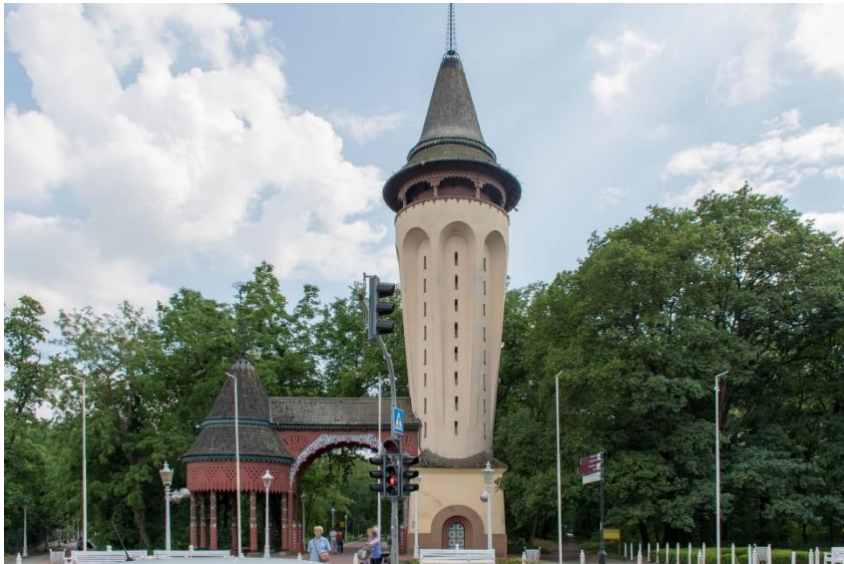
Slika 9: Vodotoranj na Paliću

Prvi objekt u njihovoj prostornoj kompoziciji je vodotoranj, postavljen na centralnom ulazu u park, poput trijumfalnog luka bio je pozdrav izletnicima, od njega su se kretale tri staze prema obali kroz park. Centralna staza kroz veliku terasu vodi direktno ka jezeru i završnom akcentu spomen fontani dok su bočne staze vodile do ženskog kupališta. Vodotoranj je objekt funkcije, Jakabu i Komoru inspiracija su bili crkveni tornjevi Erdelja. Toranj ima neuobičajenu formu kubusa a trup tornja postepeno se širi.