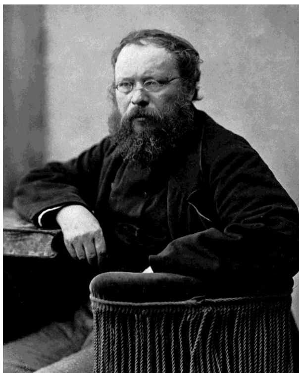
Slika 3: Pierre-Joseph Proudhon (1809.-1865.), francuski socijalist, ekonomist i začetnik mutualističke filozofije

Također se postavlja pitanje kako se takav sustav ponaša prema ljudima koji nisu sposobni zbog svoje fizičke i mentalne karakteristike sudjelovati u takvom sustavu. Do trenutka većeg širenja komunističke varijante, anarhizam ne postavlja takva pitanja kao prioritet. Mogući problemi su i određeni troškovi te rizici koji mogu uzurpirati takvu jednakost. Proudhon pokušava umanjiti taj nedostatak ovog pristupa distributivnoj pravednosti kroz kooperacijska društva uzajamnog osiguranja, pa čak uspostavu narodne banke koja bi nudila vrlo povoljne kredite kao dio rješenja problema.