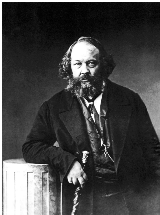
Slika 4: Mihail Bakunjin (1814.-1876.), ruski revolucionar i začetnik kolektivističkog anarhizma

kroz nagradne vaučere koji bi se mogli koristiti u komunalnim tržnicama gdje su vrijednosti unaprijed demokratski dogovorene. Na taj način se eliminira koncept slobodnog tržišta kakav postoji u prethodno spomenutom mutualizmu. Kolektivizam se može bez oklijevanja uvrstiti u socijalni anarhizam, a s druge strane mutualizam je znao aktivirati daleko više asocijacija s njegovom suprotnošću, tj. individualističkim anarhizmom.