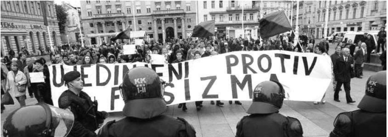
Slika 3 Zagreb, 14. travnja 2012. – Ujedinjeni protiv fašizma

slobodarskog profila izaći će iz stranke. 80 81 Jedna od najnovijih inicijativa koja privlači simpatizere slobodarskih ideja jest Libertarijanska ljevica, a nastala je krajem 2010-ih i sačinjava ponajviše mladu generaciju koja je navikla na digitalizaciju svakodnevnog života te doživljavaju ovakav suvremeni životni stil i funkcioniranje kao nešto sasvim normalno i prirodno, ali ujedno se ne libe baviti uličnim akcijama. 82