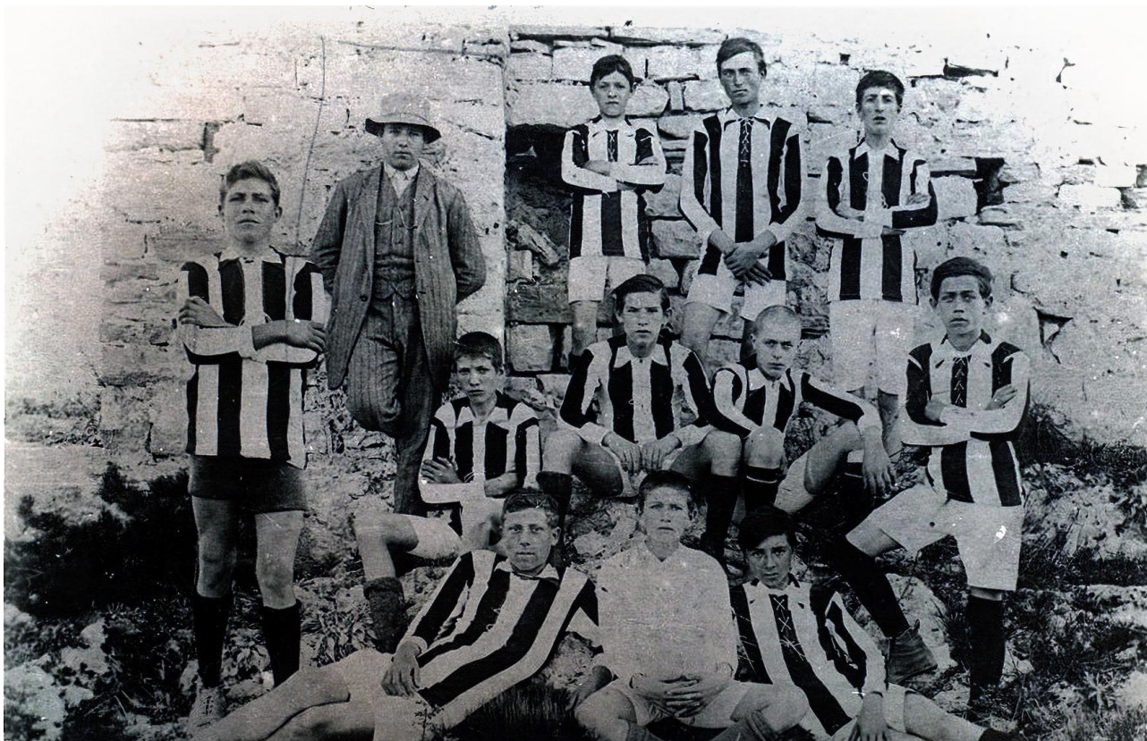
Slika 2: Nogometni klub 'Anarh' iz 1920.-ih

Anarhistički utjecaj je bio dalekosežniji od striktno političkih i društvenih pitanja. U umjetnosti o anarhizmu promišljaju i pronalaze inspiracije pisci poput Antuna Gustava Matoša (1873.-1914.), Janka Polića Kamova (1886.-1910.), Augusta Cesarca (1893.-1941.) i Miroslava Krleža (1893.-1981.). Što se sporta tiče, zanimljivo je da su učenici obrtničke škole 1912. u Splitu osnovali nogometni klub „Anarh”, godinu dana nakon osnivanja Hajduka u Pragu. 64 Danas je klub poznati kao Radnički nogometni klub „Split” 65 .