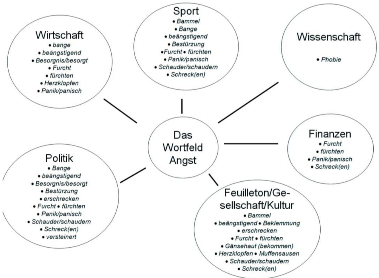
Schema 2: (Henn-Memmesheimer, 2012: 27): Grafik 1: Sprechen über Emotionen und Gefühle: neurobiologisch und alltagsprachlich - Das Beispiel Angst

Die Definition des Oberbegriffs hängt von der Kultur ab, der sie angehören, dem Bereich, in dem sie arbeiten und ihren Interessen. Unser Gehirn funktioniert, indem es Konzepte verbindet, die sich auf unsere Umgebung beziehen, in der wir uns befinden. Deswegen sind seltenere Wörter unterschiedlich auf die einzelnen Ressorts verteilt. (vgl. Henn-Memmesheimer, 2012: 26-27) Das folgende Schema zeigt, wie man unterschiedliche Ressorts mit unterschiedlichen Bereichen verbindet: