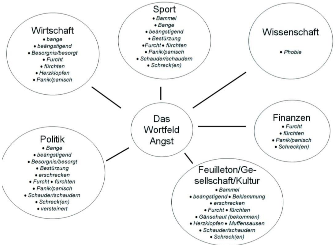
Schema 2: (Henn-Memmesheimer, 2012: 27): Grafik 1: Sprechen über Emotionen und Gefühle: neurobiologisch und alltagssprachlich - Das Beispiel Angst

Die Definition des Oberbegriffs hängt von der Kultur ab, der sie angehören, dem Bereich, in dem sie arbeiten und ihren Interessen. Unser Gehirn funktioniert, indem es Konzepte verbindet, die sich auf unsere Umgebung beziehen, in der wir uns befinden. Deswegen sind seltenere Wörter unterschiedlich auf die einzelnen Ressorts verteilt. (vgl. Henn-Memmesheimer, 2012: 26-27) Das folgende Schema zeigt, wie man unterschiedliche Ressorts mit unterschiedlichen Bereichen verbindet: