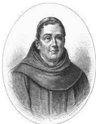
Slika 1.-Portret Andrije Kačića Miošića

Nadalje, Andrija Kačić Miošić vratio se u domovinu te postaje učitelj u Šibeniku na bogosloviji, a nakon deset godina službe odlazi u Sumartin na Brač gdje se zalagao za obnovu