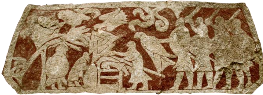
Slika 2: Stora Hammar I. https://www.medievalists.net/2011/01/notes-and-documents-viking-atrocity-and-skaldic-verse-the-rite-of-the-blood-eagle/ (Pristupljeno: 11.08.2021.)

Vjerodostojnim izvorom smatra se jedan od četiri kamena iz Švedske datiranih oko 7. stoljeća poznatijih kao kamenje iz Stora Hammara. Naime, ovaj primjer gotlandskog slikanog kamenja ukazuje na to da su pripadnici elite sudjelovali u javnim kultovima i izvodili ritualne radnje. Čini se da je vladajuća obitelj koristila vjerske obrede pri očitovanju njihove moći i suvereniteta. Na tzv. Kamenu Stora Hammar I. postoji prikaz muškarca kako leži na trbuhu dok drugi muškarac iznad njega stoji sa oružjem na njegovim leđima.