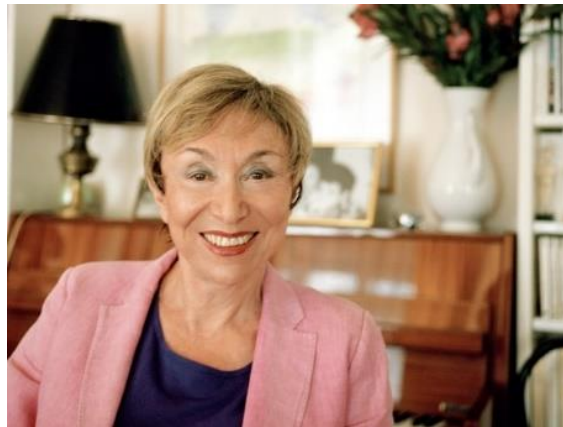
Slika 11. Julija Kristeva

Prema Toril Moi, Kristeva smatra da svako jačanje semiotičkog mora dovesti do slabljenja tradicionalnih spolnih podjela, a ne promicanju ženstvenosti jer je ženstvenost patrijarhalni konstrukt. Takva kritika ženstvenosti utjecala je na feminističku teorijsku misao jer se ženstvenost uvijek prikazivala kao negativna i iracionalna, a Kristeva sada pokazuje da je ženstvenost samo pitanje pozicioniranosti. Prema Kristevi, ukoliko prihvatimo da su sve žene isključivo i nužno ženstvene, a svi muškarci isključivo i nužno muževni, zapravo dopuštamo patrijarhatu da sve žene definira kao marginalne simboličkom društvu (Moi 2007: 226-228).