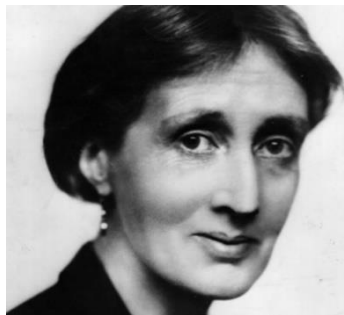
Slika 5. Virginia Woolf

Woolf je na kraju života počinila samoubojstvo zbog nemogućnosti da promijeni patrijarhalno društvo koje ne cijeni ženu pa postaje dokazom koliko daleko sežu društvena pravila, konsenzusi i odnosi spram pojedinca. Njezina su djela neupitno vrijedan prikaz feminističke književnosti, a njezine su riječi koje je upućivala studenticama na ženskim fakultetima inspiracija za svaku ženu.