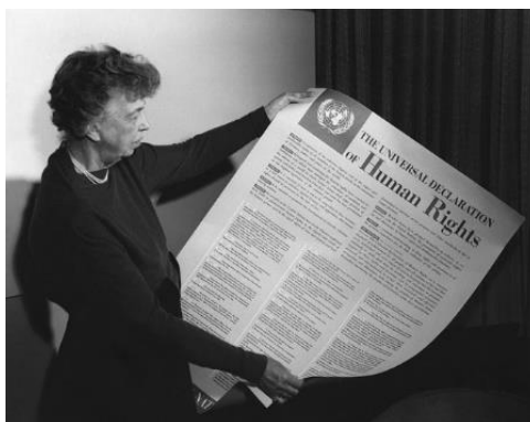
Slika 2. Eleanor Roosevelt i Opća deklaracija o ljudskim pravima (1949.)

U razdoblju drugoga vala feminizma američki predsjednik J.F. Kennedy osnovao je Predsjedničku komisiju o statusu žena , organizaciju koja se bavila pitanjima ravnopravnosti, (ne)jednakih prilika za zapošljavanje, obrazovanje i sigurnost žena, pritom se boreći za ukidanje zakona kojima su se diskriminirala ženska prava. Iz svega navedenoga, razvidno je da su ženska prava u drugom valu feminizma postala pitanja nacionalnog interesa i da su raniji feministički pokreti urodili plodom. Predsjednik Kennedy imenovao je Eleanor Roosevelt predsjednicom komisije za ljudska prava. Roosevelt je bila prva predsjednica Povjerenstva Ujedinjenih naroda za ljudska prava , a uvelike je utjecala na nastanak Opće deklaracije o ljudskim pravima . 11 Prema Deklaraciji , svaka je osoba od rođenja slobodna i ima pravo uživati u jednakim pravima u skladu s dostojanstvom (Deklaracija o ljudskim pravima 1948: članak 1).