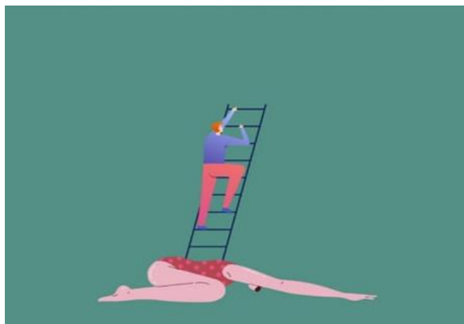
Slika 12. Slika koja prikazuje kako žene drže ljestve patrijarhatu te potiče na promjene 42

U dobroj nadi možemo vjerovati će se žene uvijek, hrabro i neustrašivo, boriti za ono što im je uvijek i trebalo pripadati. Valja naglasiti da nije potrebno da se svaka osoba identificira kao feminist ili feministica. Kao što tvrdi Bell Hooks: „Ne znači da se moramo pridružiti organizacijama; u ime feminizma možemo djelovati tamo gdje jesmo. Možemo početi feministički djelovati kod kuće, tamo gdje živimo, obrazujući sebe i ljude koje volimo“ (Hooks 2004: 149). Također, u dobroj nadi možemo vjerovati da će stigma koja prati ženski spol s vremenom postati prošlost, a apsolutna ravnopravnost spolova u svim područjima života – naša budućnost. Dosjetka Bernarda Shawa: „Bijeli Amerikanac u biti stavlja crnca u rang čistača cipela i iz toga zaključuje da je dobar samo za čišćenje cipela“ osvjetljava i problem ženskog položaja u društvu (Beauvoir 2016:20). Potrebno je, prije svega, krenuti od izmjene društvenih pravila i normi koje su postavljene tako da oduvijek stavljaju ženski spol u niži, drugi , položaj.