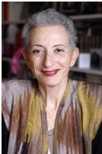
Slika 9. Helene Cixous

Uz Cixous, Luce Irigaray i Julija Kristeva naglašavaju da su žene jednako sposobne stvarati kvalitetna djela kao i muškarci te da stereotip o ženskim smanjenim sposobnostima izražavanja u književnim djelima nema nikakvo činjenično uporište (Lekić 2019: 32).