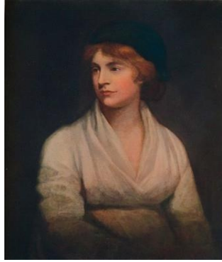
Slika 4. Mary Wollstonecraft