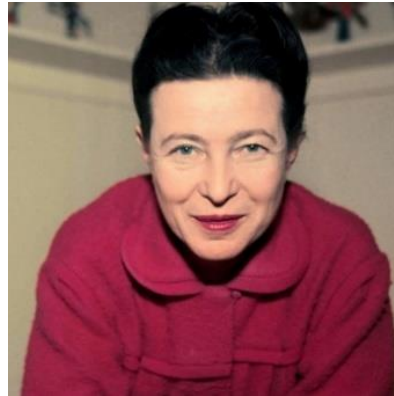
Slika 6. Simone de Beauvoir

se za ravnopravni sustav u kojem će se ženu, jednako kao i muškarca, poštivati kao individuu sa svim pravima u kojima uživa i muškarac.