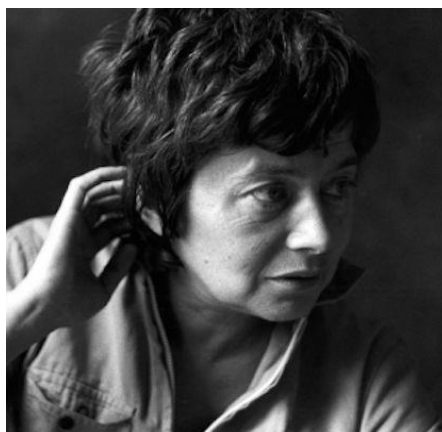
Slika 10. Luce Irigaray

Također, Irigaray navodi da je korisno s djevojčicama imati razgovore u kojima govore kao ja-žena i obraća se tebi-ženi jer takav govor danas gotovo kao da ne postoji (Irigaray 1999:37-38). Činjenica je da je ženski rod, prema Irigaray, danas izjednačen s ne-muškim. Njezina je temeljna misao vezana uz izmjenu postojećih nepravdi koje postoje u jeziku i koje ženama onemogućuju stvaranje, pisanje i djelovanje kao što je to omogućeno muškarcima.