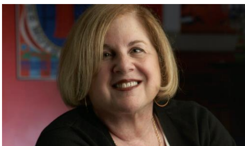
Slika 8. Elaine Showalter

istraživanja specifičnosti ženskog iskustva 35 , a ženska estetika promatra žensko pismo kao posebni oblik opisivanja ženskog iskustva. Uz ginokritiku odnosno žensku književnost navodi se i poststrukturalistička feministička kritika koja se bavi ženstvenošću kao posebnom kategorijom te na koncu teorija roda koja proučava spolne i rodne različitosti. Prema Omeragić, poststrukturalistička feministička kritika ili gynesis istražuje jezik, filozofiju i psihoanalizu (Omeragić 2013: 41).