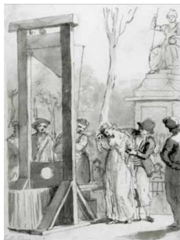
Slika 1. Pogubljenje Olympe de Gouges

Što se tiče prvog vala feminizma u Francuskoj , neupitno je da je Francuska revolucija 1789. godine utjecala na borbu za prava žena. Žene su se počele boriti za vlastita prava, jednakost spolova i jednake mogućnosti obrazovanja, a jedna od najznačajnijih revolucionarki koja djeluje u tom razdoblju je Olympe de Gouges . 1791. godine objavila je djelo Povelja o pravima žene i građanke prema Deklaraciji o pravima čovjeka i građanina (Lekić 2019:13). Slično kao i John Stuart Mill, samo gotovo stoljeće ranije, zalagala se da se uz termin građanin uvede termin građanka . Čvrsto je smatrala da žene pravno gledajući moraju biti jednake muškarcima, a za žene je smatrala da su čak i hrabrije od suprotnog spola. U rečenicama koje slijede vidljivo je njezino mišljenje o neravnopravnosti muškaraca i žena: „Kažite mi! Tko vam je dao suvereni autoritet da podčinite moj spol.“ (Mihaljević 2016: 152). Kao i brojne feministice, zalagala se za pravo rada i obavljanja svih poslova na koje imaju pravo i muškarci. Prema Jeleni Lekić najpoznatija rečenica Olympe de Gouges bila je „Žena ima pravo da se popne na giljotinu; ona mora imati jednako pravo da se popne i na govornicu.“, a zbog otvorenog progovaranja i zastupanja ženskih prava, osuđena je na giljotinu (smrtnu kaznu) 1793. godine (Lekić 2019:13).