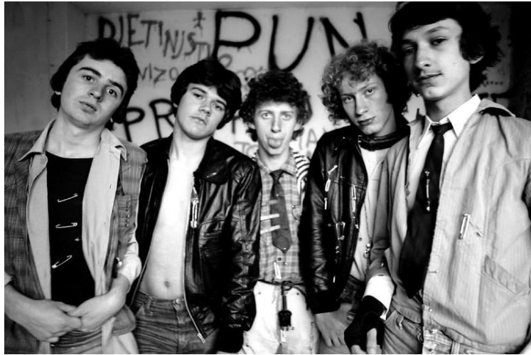
Prilog 6: Prljavo kazalište

Punk moda ruši ustaljene standarde, ona provocira i eksperimentira u znaku društvene pobune. Tome pridonosi i britanska modna dizajnerica Vivienne Westwood, koja stil punka spaja s visokom modom, na primjer stavljajući britansku zastavu na traperice ili koristeći uvredljive natpise na majicama. Eksperimentirala je s naizgled nespojivim poput škotskog uzorka po kojem je danas i poznata. 107 Zajedno s Malcomom McLarenom, koji je također utjecao na punk modu, otvorila je trgovinu „SEX“ sredinom sedamdesetih godina 20. stoljeća, gdje su prodavali odjeću od gume ili kože te razne neuobičajene komade, stvarajući tzv. „ulični stil“ 108