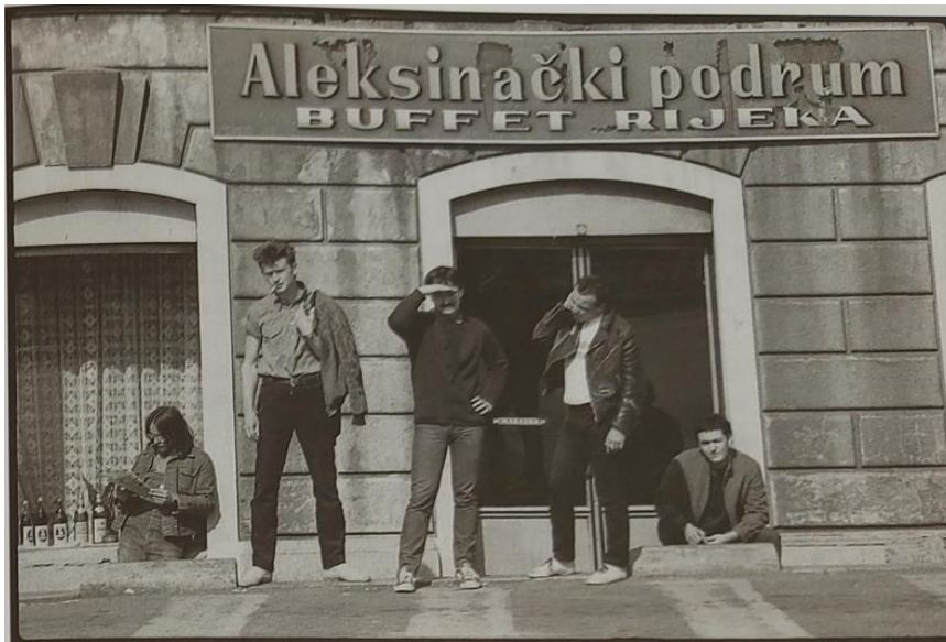
Prilog 4: Mrtvi kanal (izvor: Zoran Žmirić, Riječke rock himne , Rijeka, 2011., str. 41.)

na riječkoj novovalnoj sceni. Njihovi tekstovi pjesama bavili su se društvenom problematikom socijalističkog režima u okviru radničkih menzi, klasne podijele, lažnih vrijednosti, nepotizma. No, bez obzira što su progovarali o problematici klasnog društva, teškom položaju radničke klase i s druge strane lagodnom životu pojedinaca u vrijeme ekonomske krize te o kritikama JNA kao temelju sistema, nisu podliježali represijama režima kao što se s time na primjer borila grupa Paraf .. 95