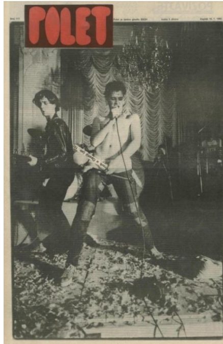
Prilog 3: Naslovnica, Polet , br. 177 (16. siječnja 1980.)

jugoslavenska izdavačka kuća Jugoton nudila snimanje ploče, no grupa je to odbila zbog zahtjeva koji im nisu odgovarali, nešto poput mnogobrojnih izmjena, cenzure tekstova pjesama i slično. 93