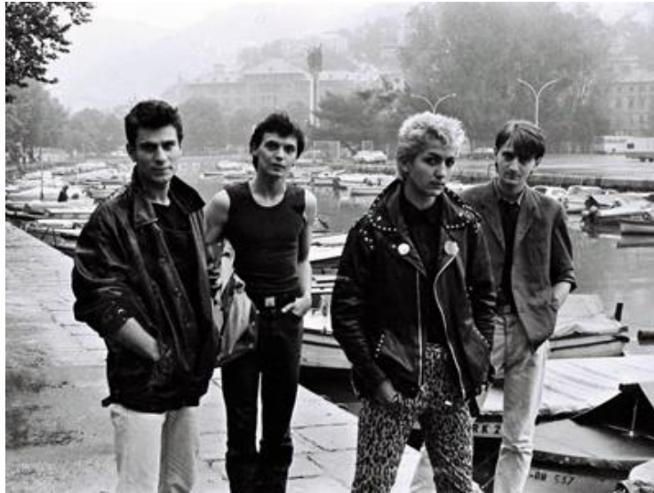
Prilog 5: Paraf

Poznati riječki dizajneri Gus i Maja izrađivali su odjeću od kože za scenske nastupe grupa Paraf i Termiti , a na specifičan način „škarama, ljepilom i dosjetkom, stvarana izobličenja koja su unosila pomaknutu estetiku u imidž grupe“ išla su u prilog njihovom vlastitom jedinstvenom vizualnom identitetu. 104 Jedan od primjera navodi Valter Kocijančić, član grupe Paraf , koji kaže da su mu šivali kožne hlače. 105