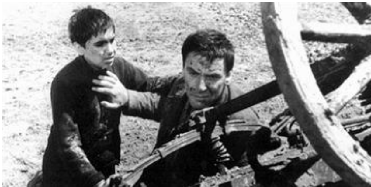
Slika 12 Scena iz filma ne okreći se sine

sine Bauera učinio i profesionalnim i filmsko-političkim autoritetom postajući tako „(...) reprezentom ideološki uzorne upotrebe klasičnog stila.“ (Turković, 2002: 17).