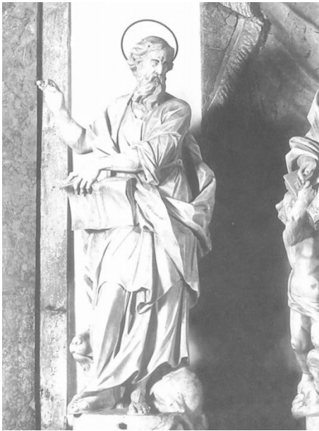
Slika 2. Francesco Cabianca, Sv. Marko, Oltar Presvetog Sakramenta, katedrala sv. Anastazije (Stošije), Zadar, 1719.