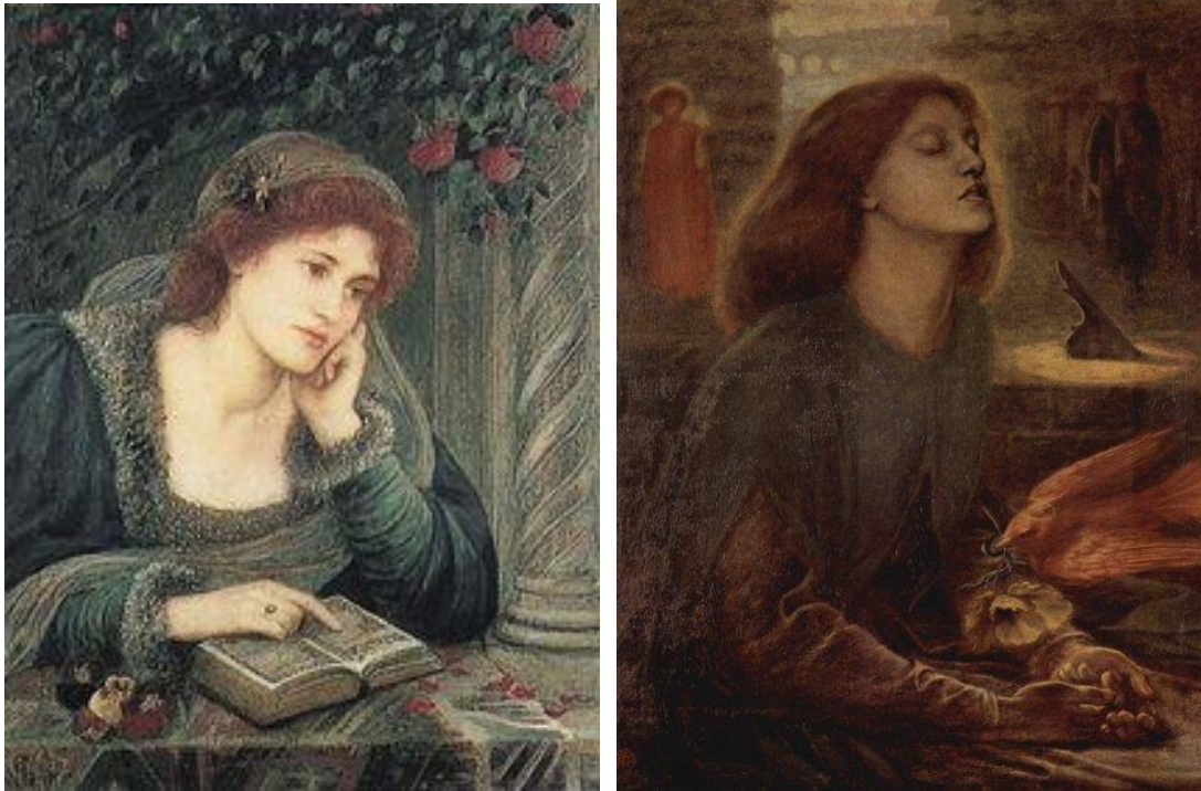
Fig.1. M. S. Stillman, Beatrice , 1895, Delaware Art Museum.